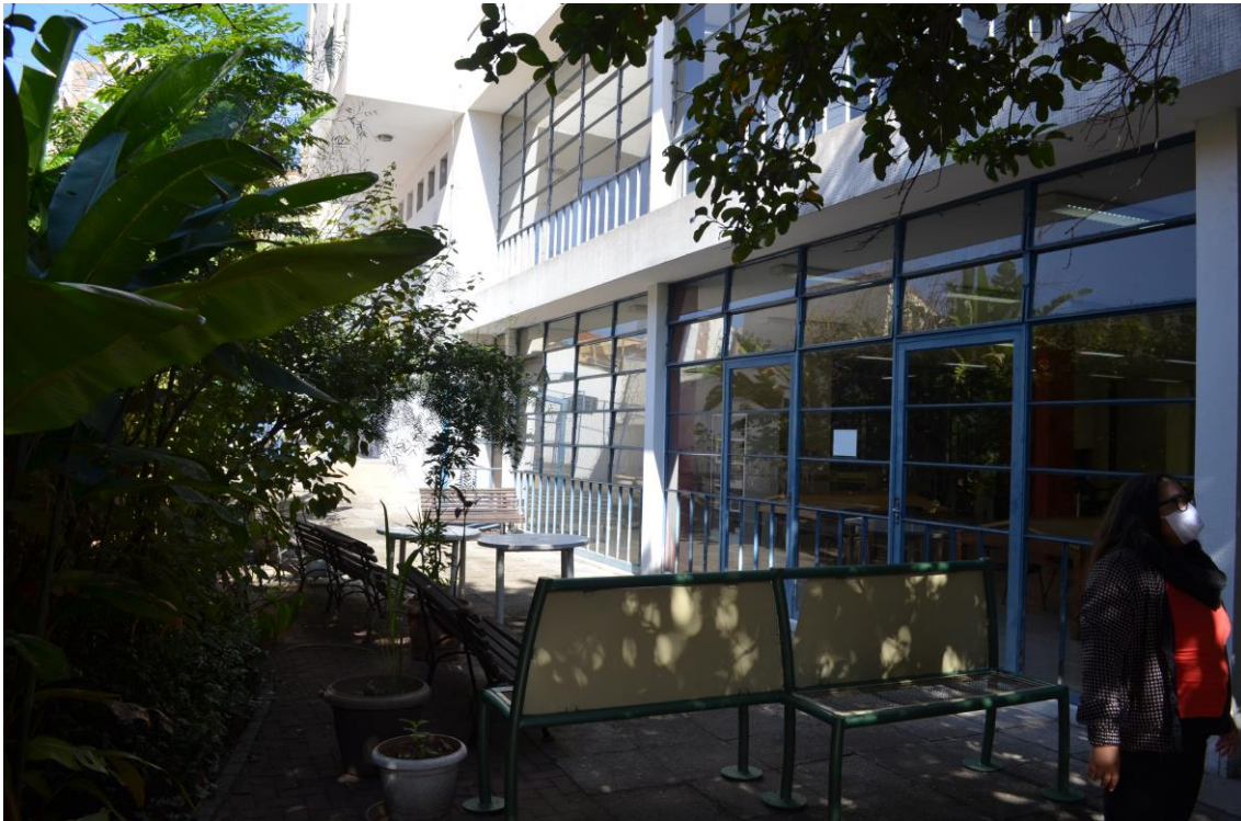
Figura 4 – Biblioteca Mario Schenberg