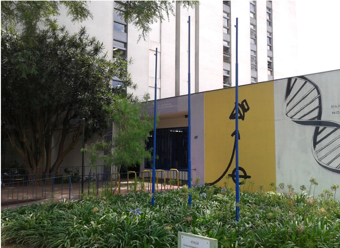
Figura 3 – Fachada da Biblioteca Mario Schenberg