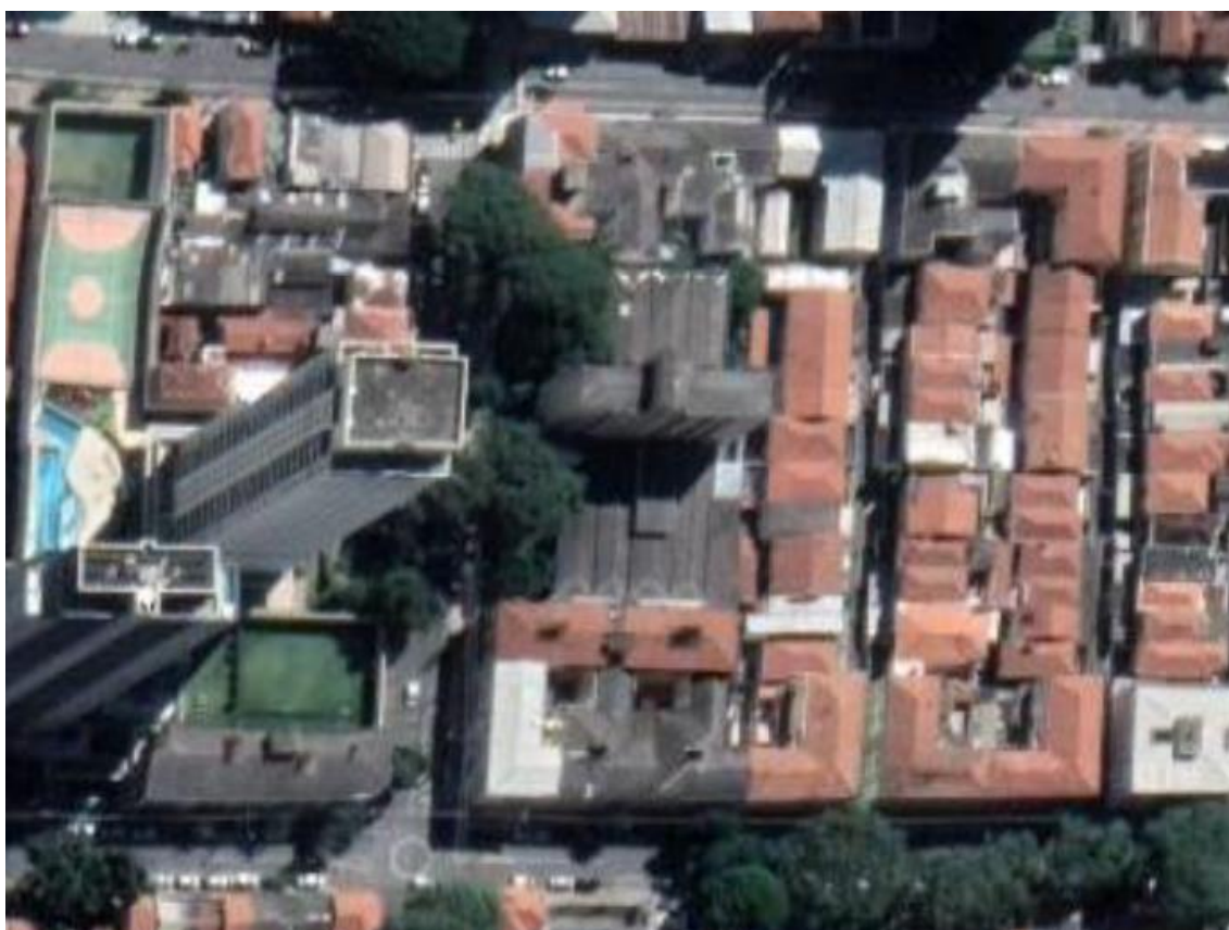
Figura 1 – Imagem de satélite atual