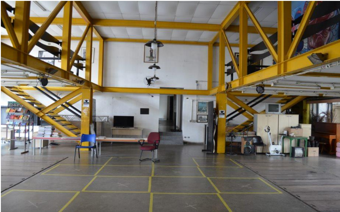
Figura 5 – Interior da Casa de Cultura da Freguesia do Ó