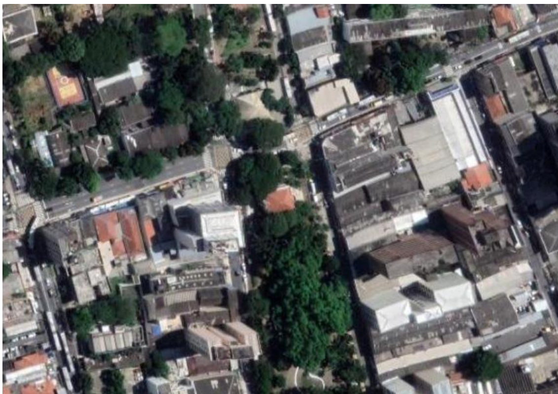
Figura 1 – Imagem de satélite atual