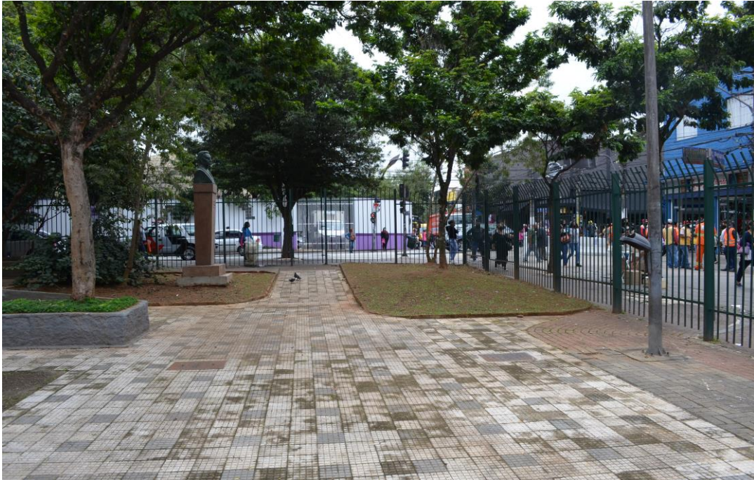
Figura 4 - Área externa do Paço Cultural Júlio Guerra