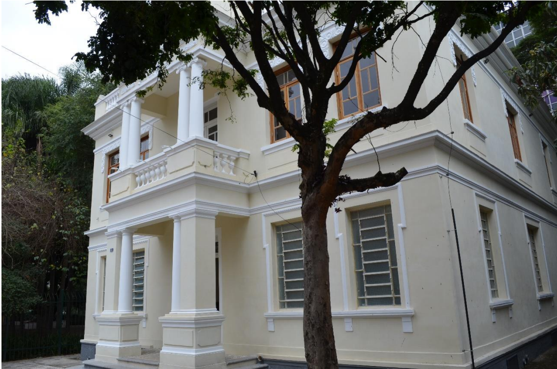
Figura 3 - Fachada do Paço Cultural Júlio Guerra