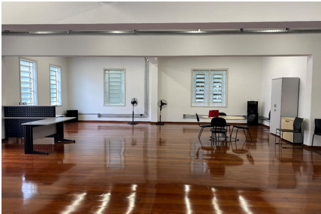
Foto 3 - Área interna do Paço Cultural Júlio Guerra