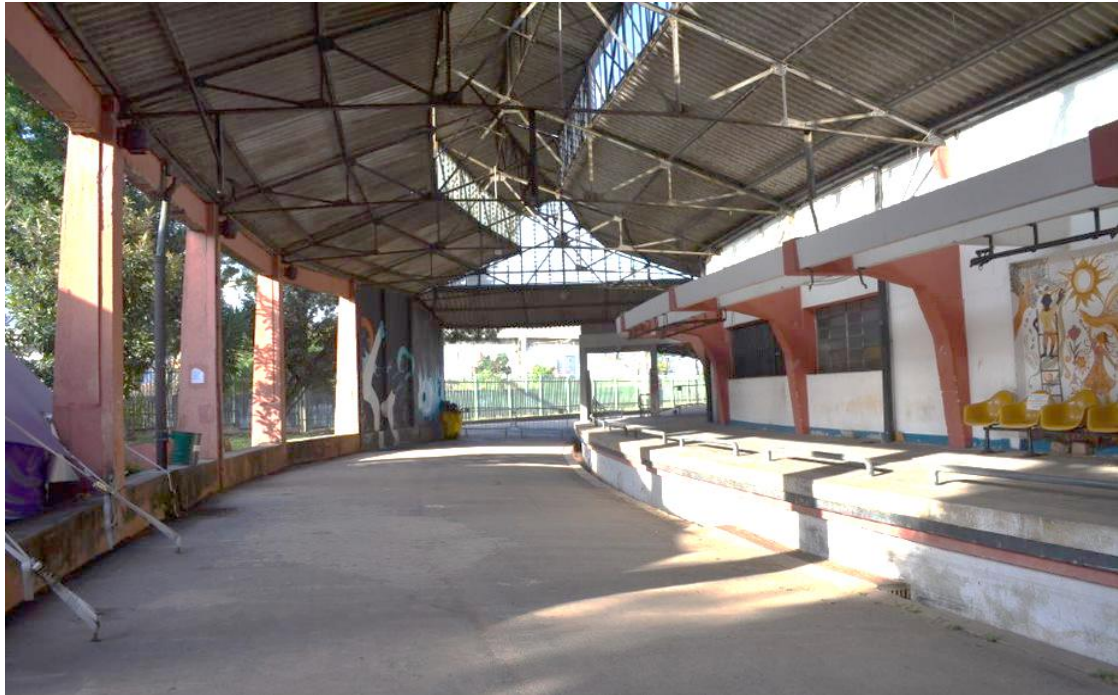
Figura 4 – Centro Cultural Tental da Lapa