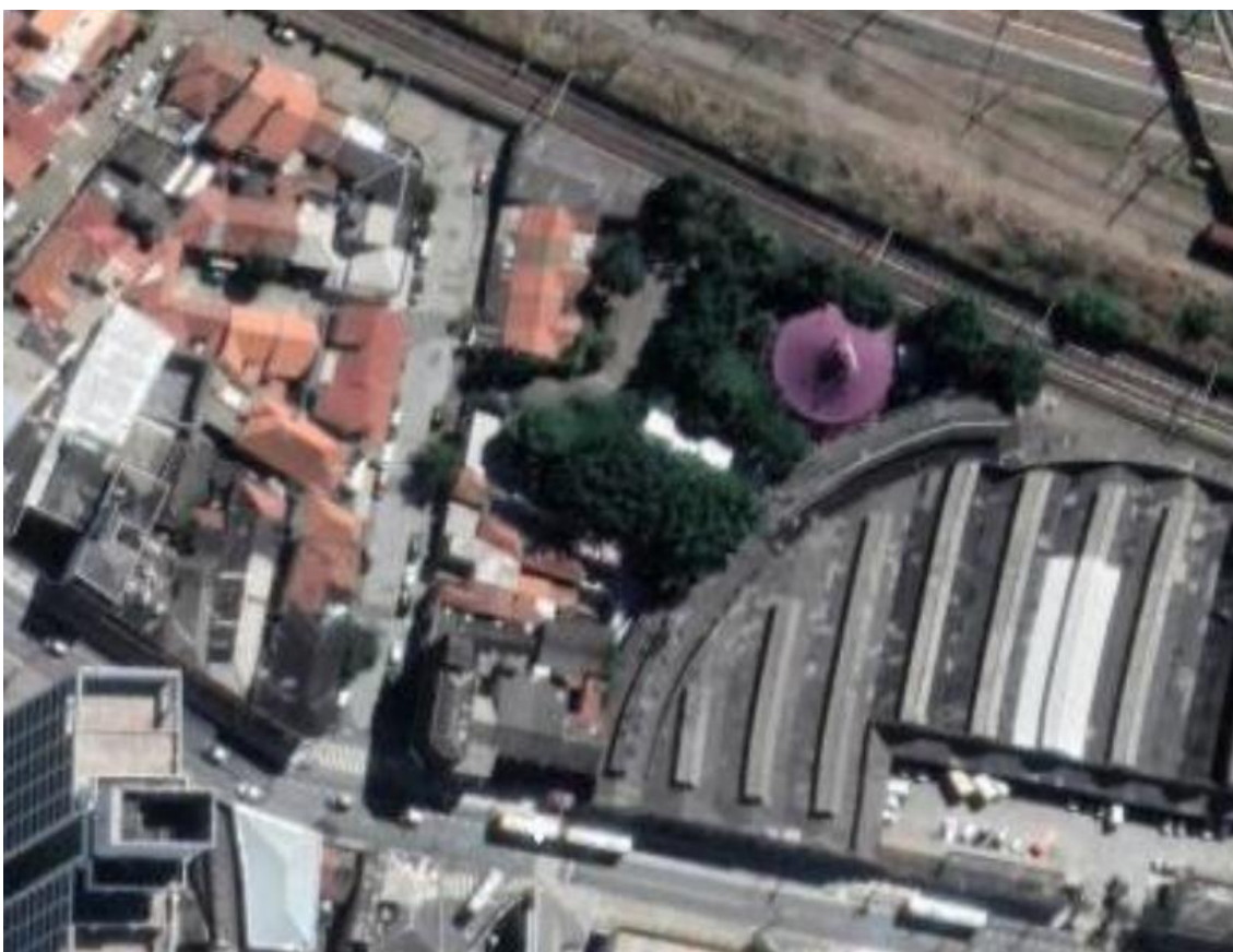
Figura 1 – Imagem de satélite atual