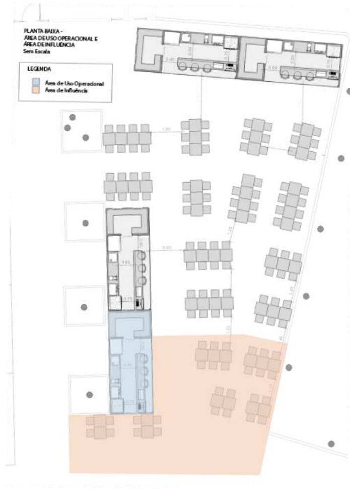
Figura 2 – Planta da ÁREA DA PERMISSÃO 12