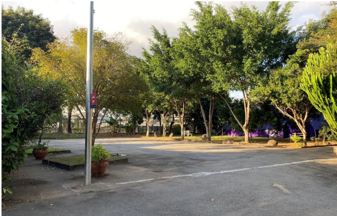
Figura 9 – ÁREA DA PERMISSÃO