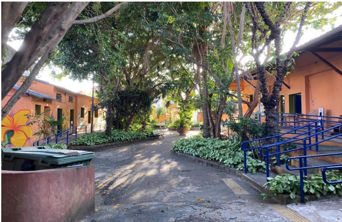
Figura 7 – Centro Cultural Tendam da Lapa