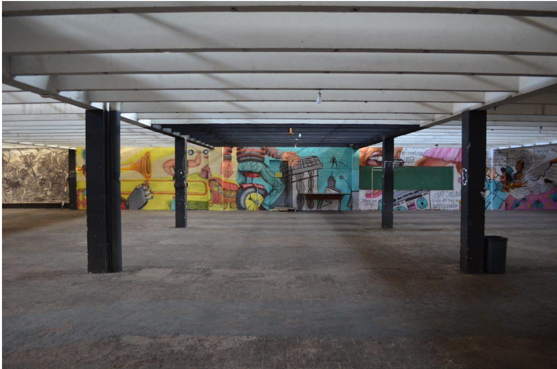
Figura 6 – Espaço interno do Centro Cultural Tendam da Lapa