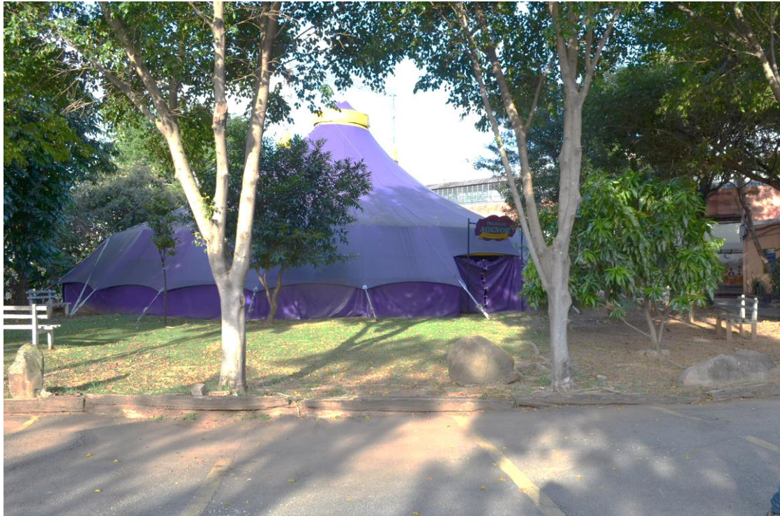
Figura 8 – Centro Cultural Tental da Lapa