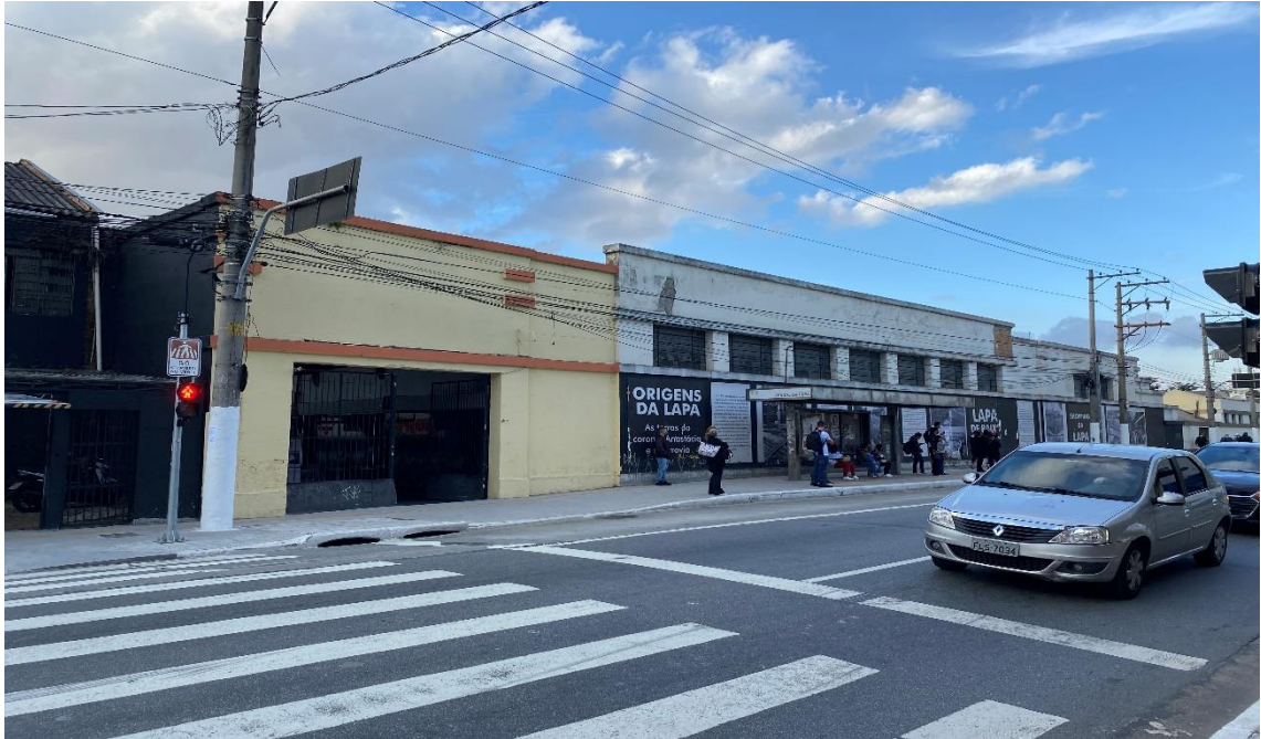
Figura 3 – Fachada do Centro Cultural Tendam da Lapa