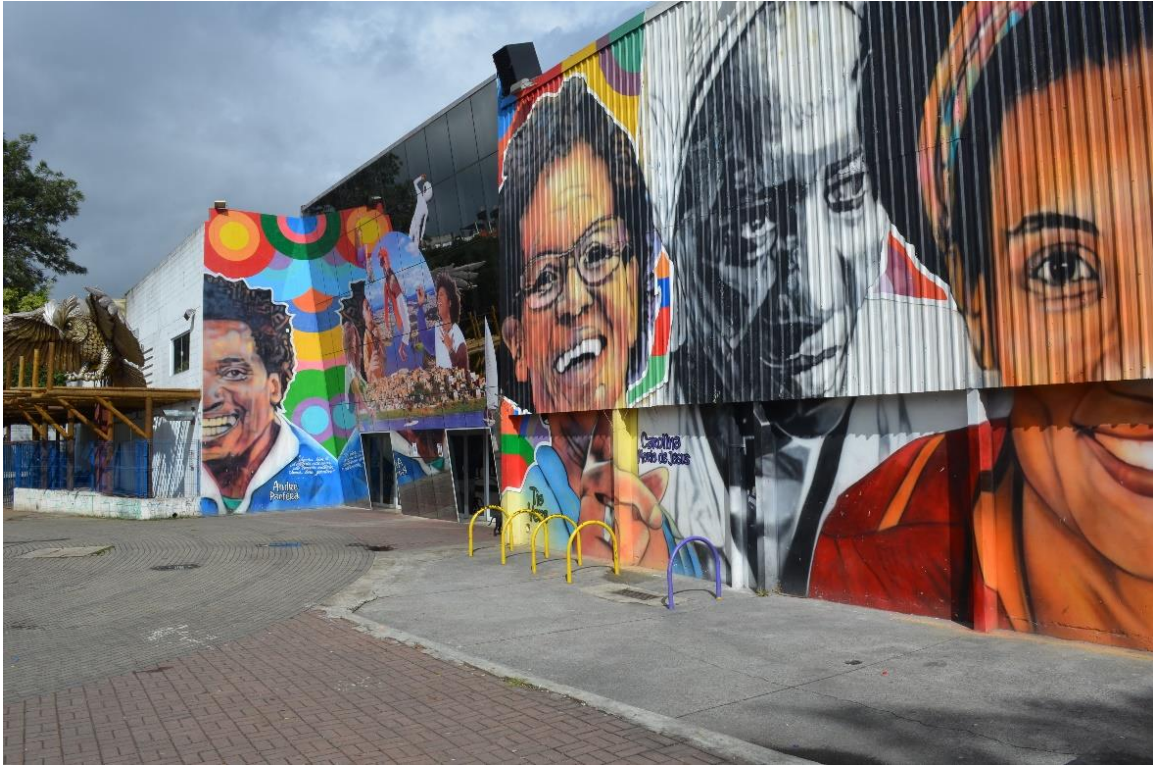
Figura 3 – Fachada do Centro Cultural do Grajaú