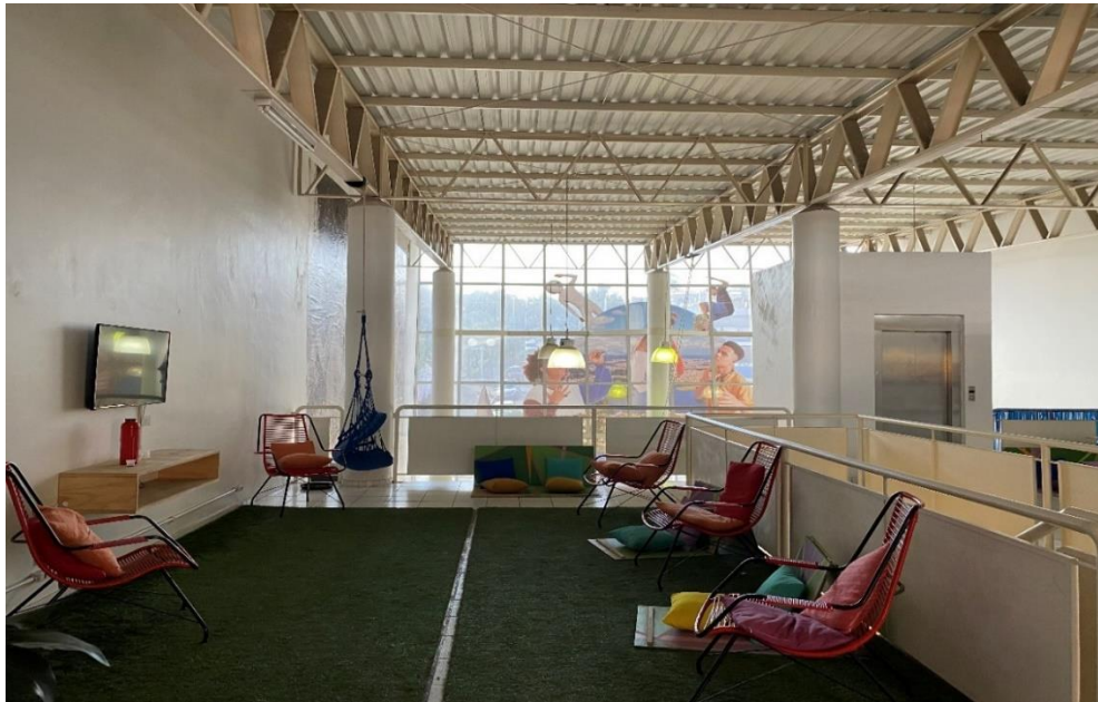
Figura 6 – Área interna do Centro Cultural do Grajaú