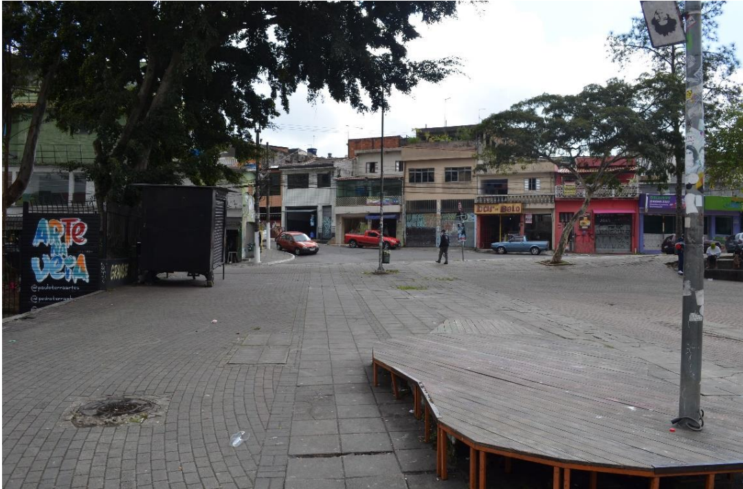
Figura 4 – Calçada do Grajaú, lindeiro ao Centro Cultural