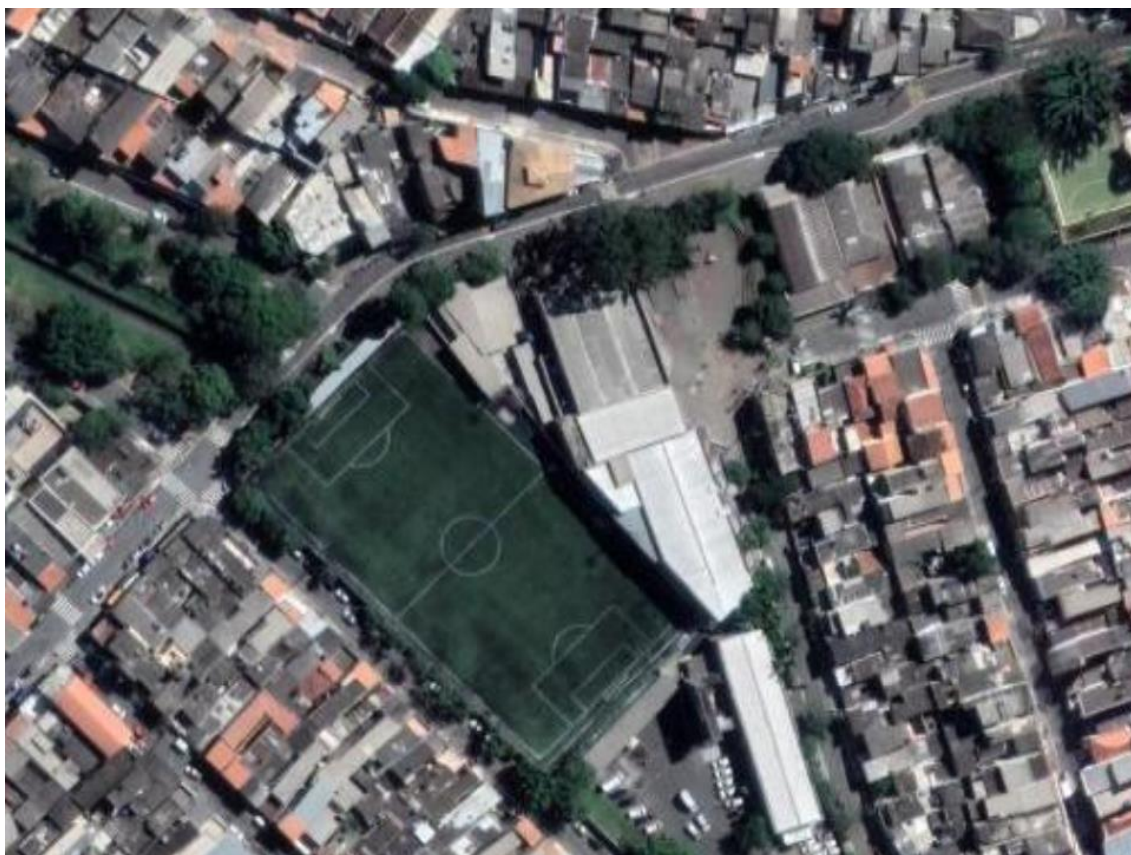
Figura 1 – Imagem de satélite atual