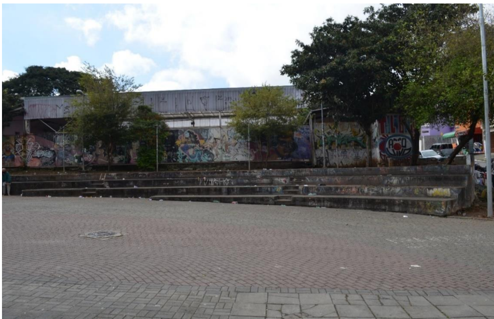
Figura 5 – Calçada do Grajaú, lindeiro ao Centro Cultural