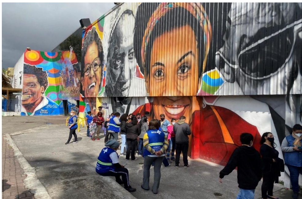
Figura 7 - ÁREA DA PERMISSÃO