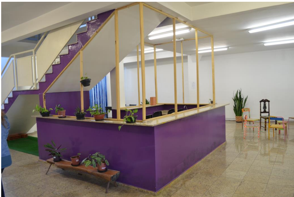
Figura 7 - ÁREA DA PERMISSÃO