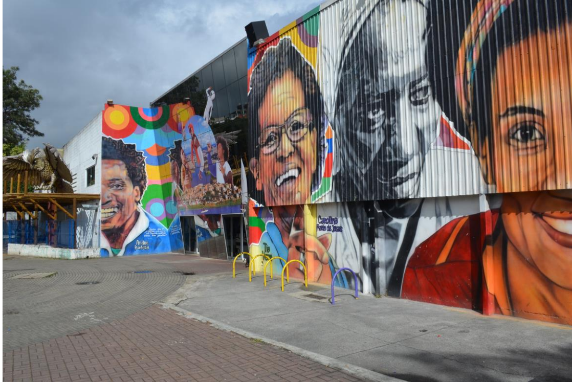
Figura 3 - Fachada do Centro Cultural do Grajaú