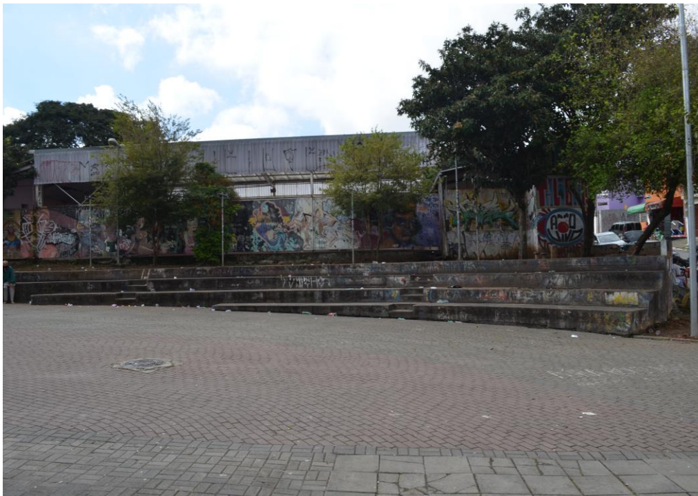
Figura 5 - Calçadão do Grajaú, lindeiro ao Centro Cultural