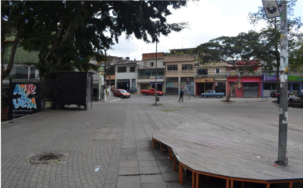
Figura 4 - Calçadão do Grajaú, lindeiro ao Centro Cultural