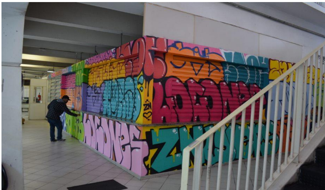
Figura 9 - ÁREA DA PERMISSÃO