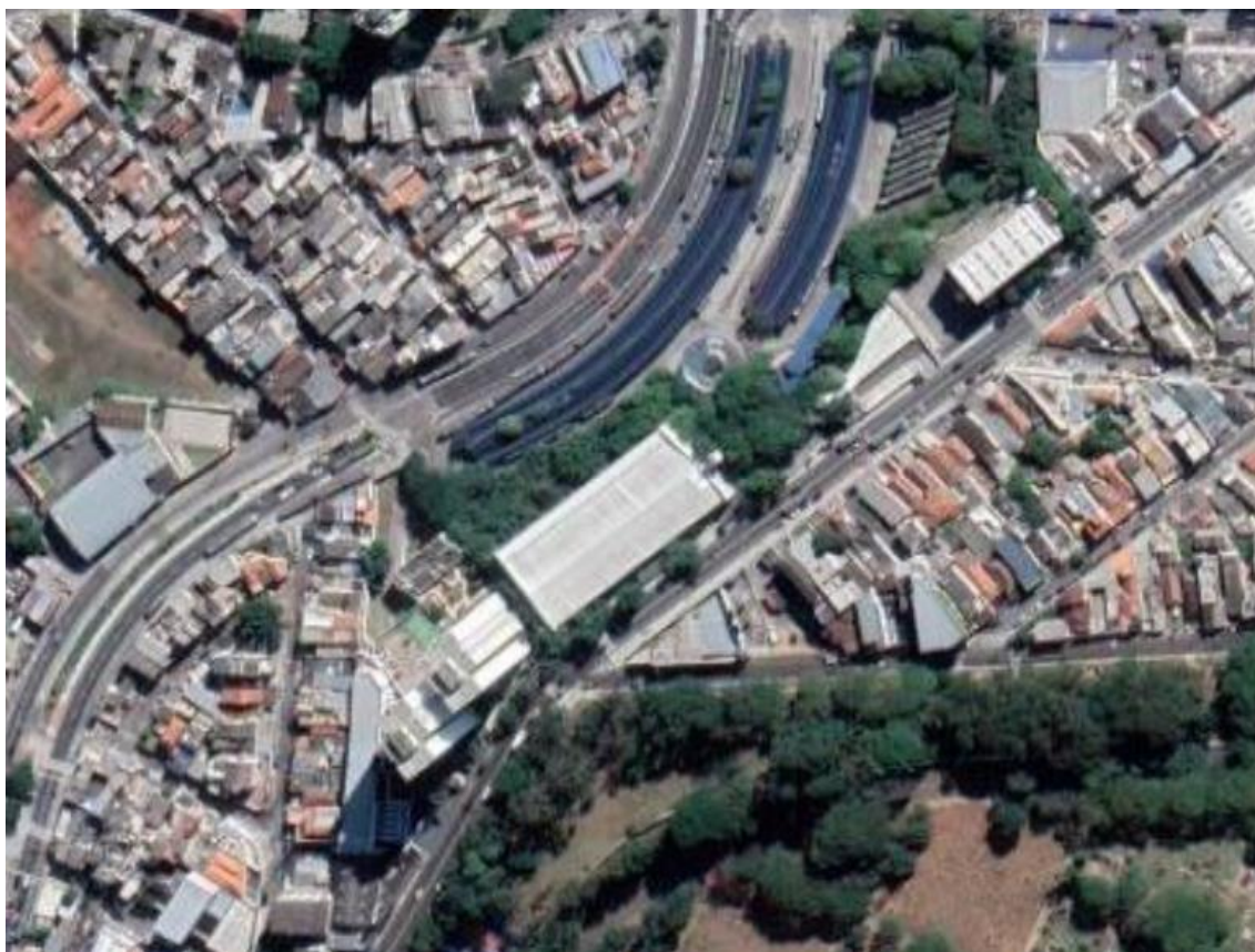
Figura 1 – Imagem de satélite atual

Fonte: Google Maps, 2021. Disponível em: < https://www.google.com/maps/place/Centro+Cultural+da+Juventude+Ruth+Cardoso/@-23.4763216,-46.6705322,381m/data=!3m1!1e3!4m5!3m4!1s0x0:0x4a61e1753d6cb642!8m2!3d-23.4761638!4d-46.6703964 >. Acesso em: 25/08/2021.