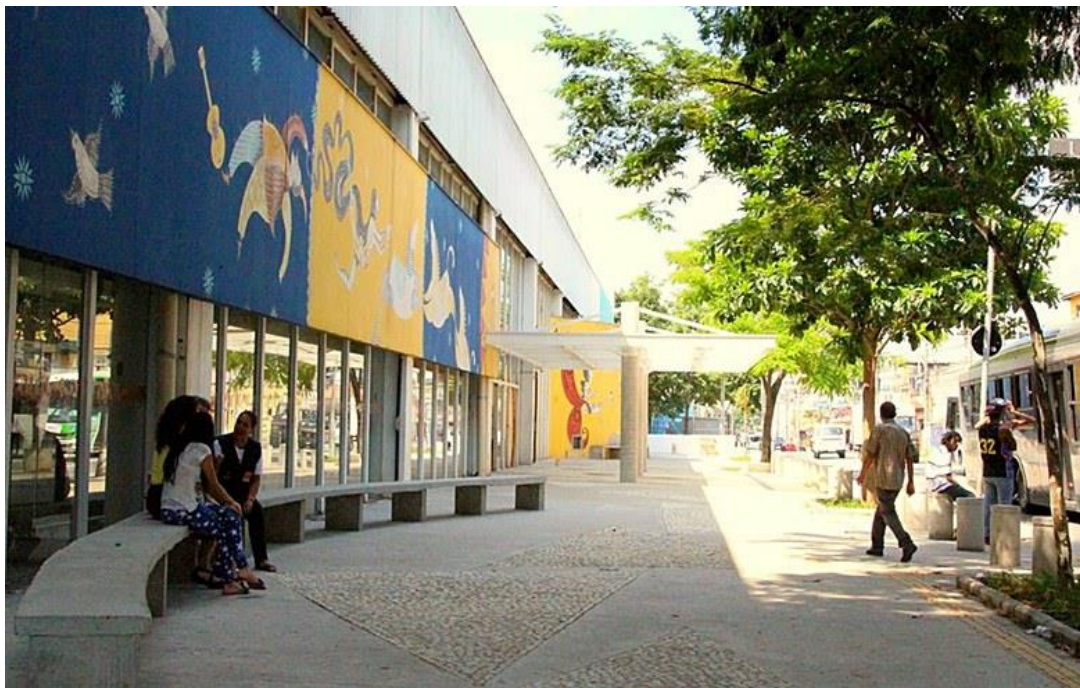
Figura 3 – Frente do Centro Cultural da Juventude