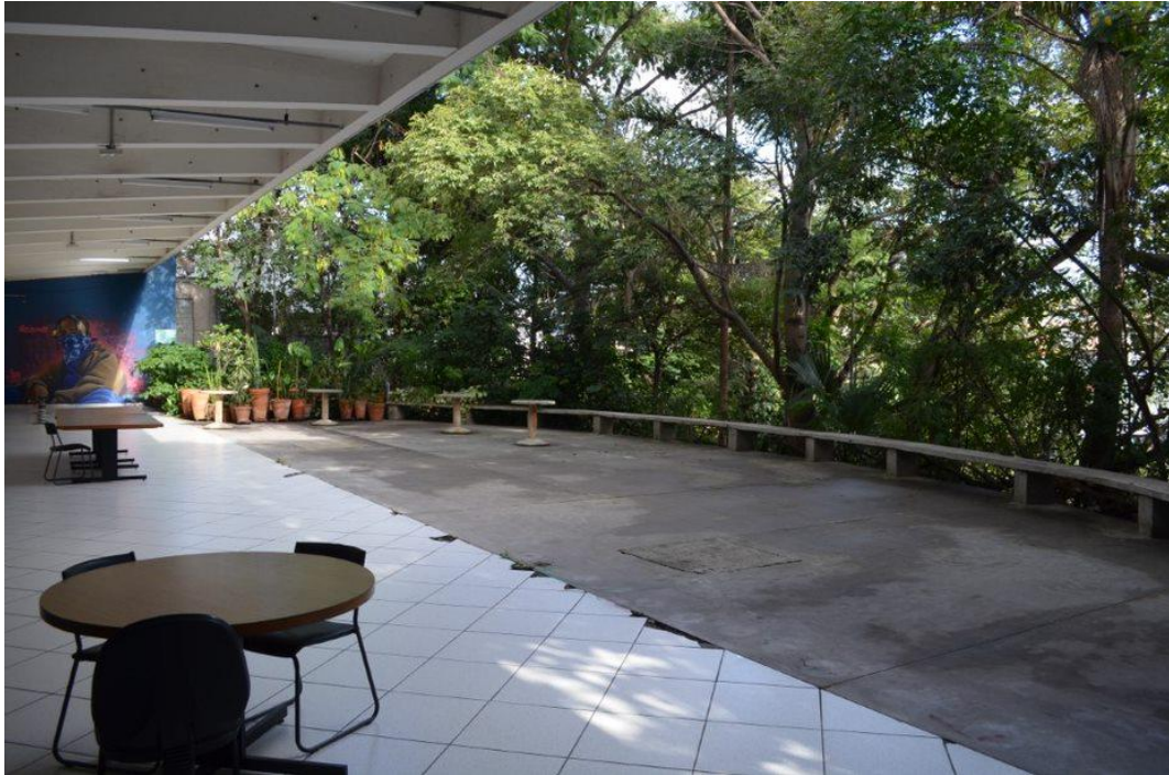
Figura 4 - Espaço interno do Centro Cultural da Juventude