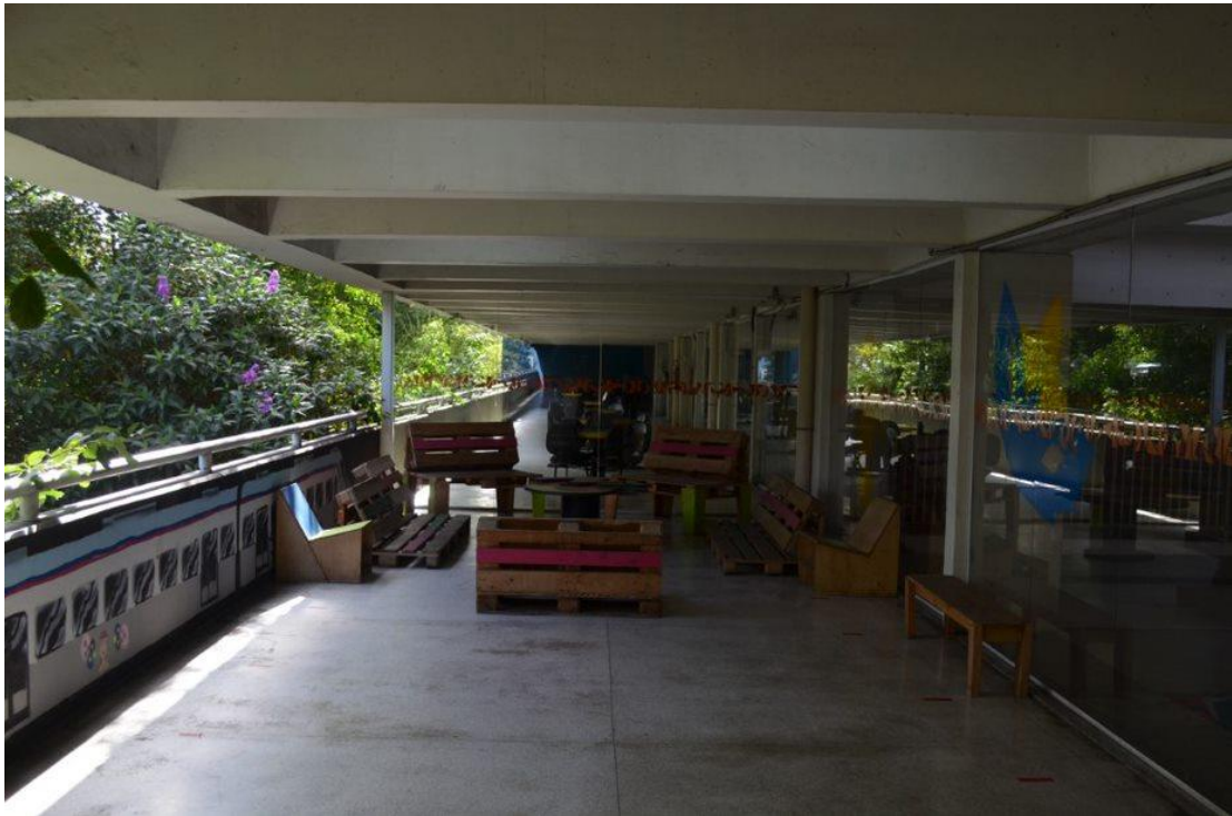
Figura 8 – Espaço interno do Centro Cultural da Juventude