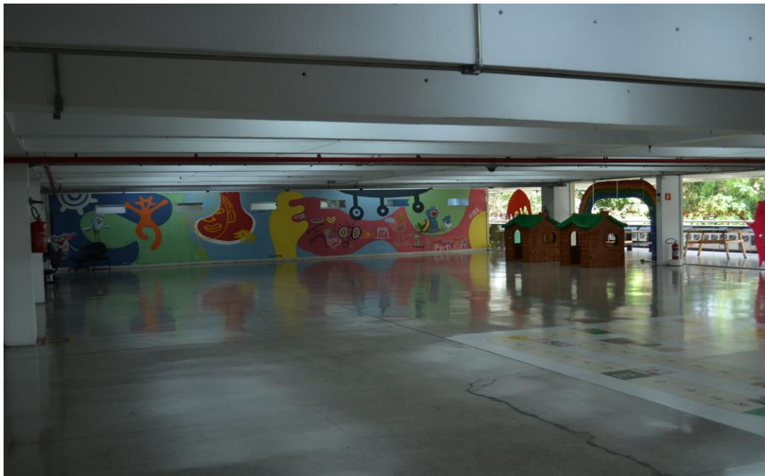
Figura 5 - Espaço interno do Centro Cultural da Juventude