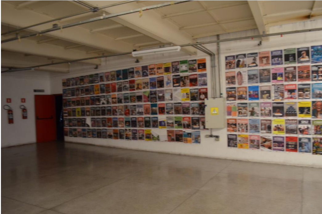
Figura 6 – Espaço interno do Centro Cultural da Juventude