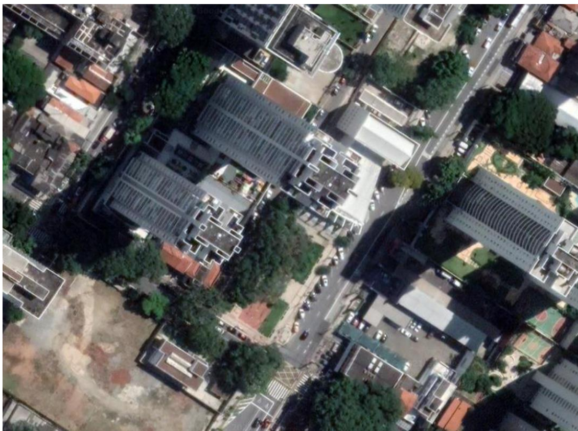
Figura 1 – Imagem de satélite atual