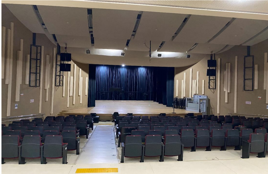
Figura 5 - Área interna do Teatro Paulo Eiró