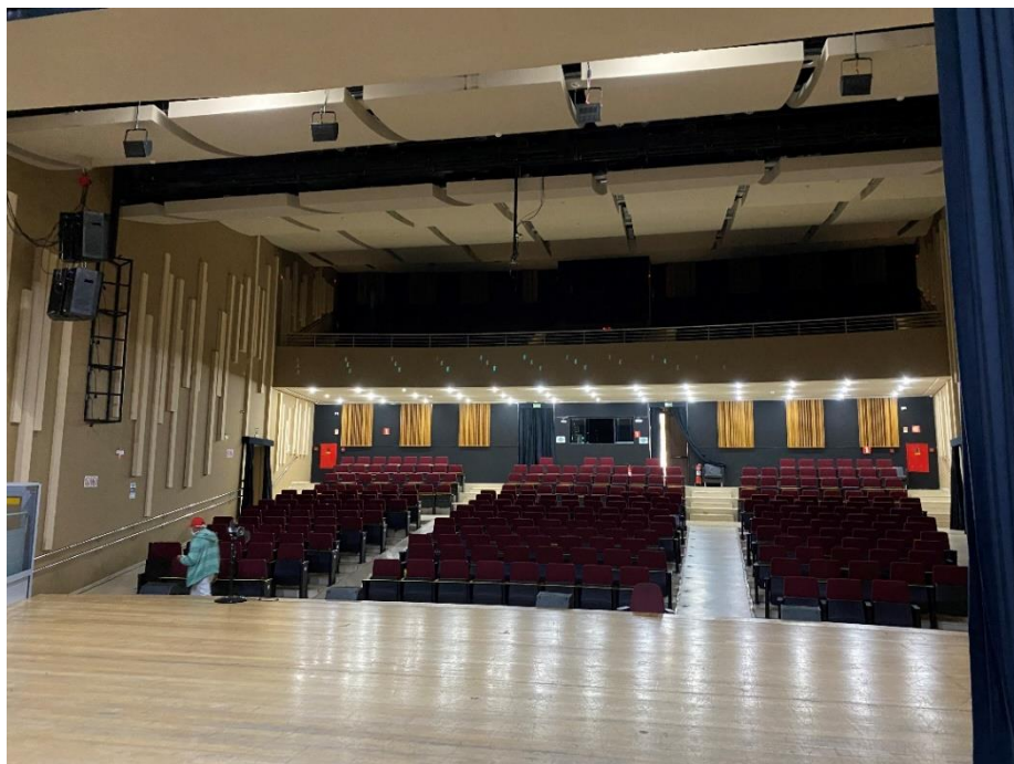
Figura 6 - Área interna do Teatro Paulo Eiró