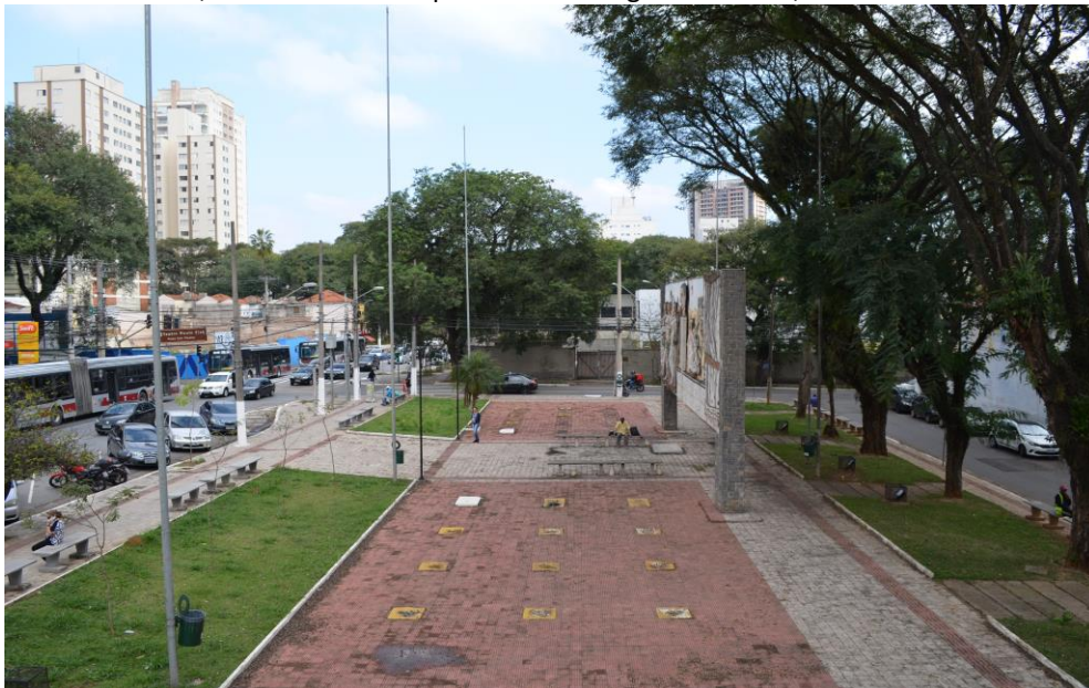
Figura 4 - Área externa, onde se localiza o painel “Homenagem às Artes”, em frente ao Teatro Paulo Eiró