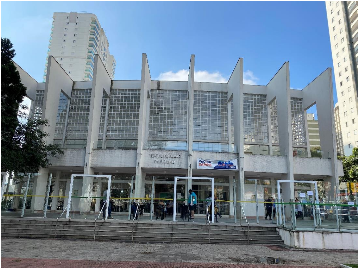
Figura 3 - Fachada do Teatro Paulo Eiró