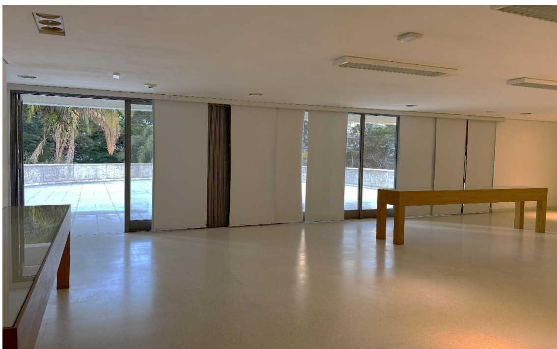
Figura 6 –ÁREA DA PERMISSÃO 23