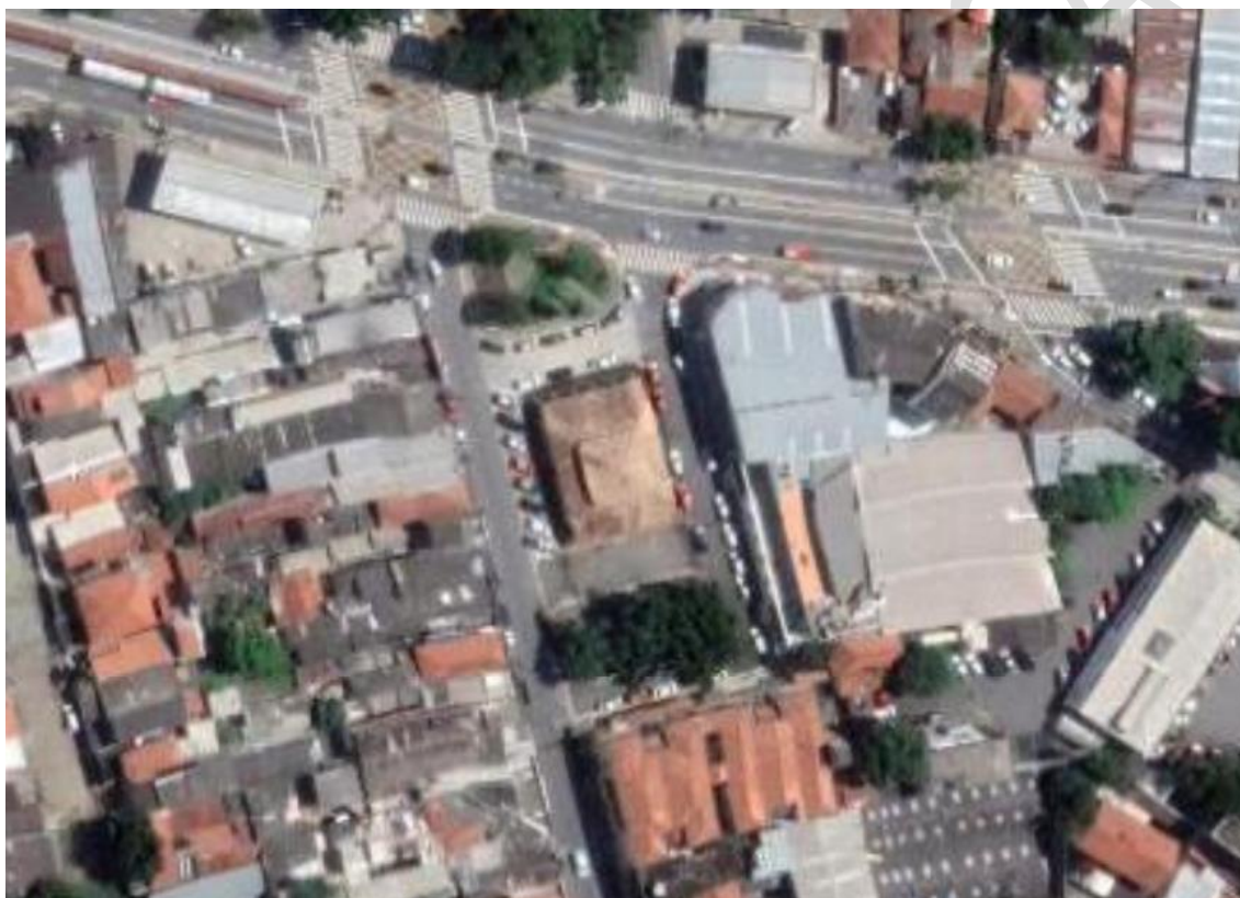
Figura 1 – Imagem de satélite atual