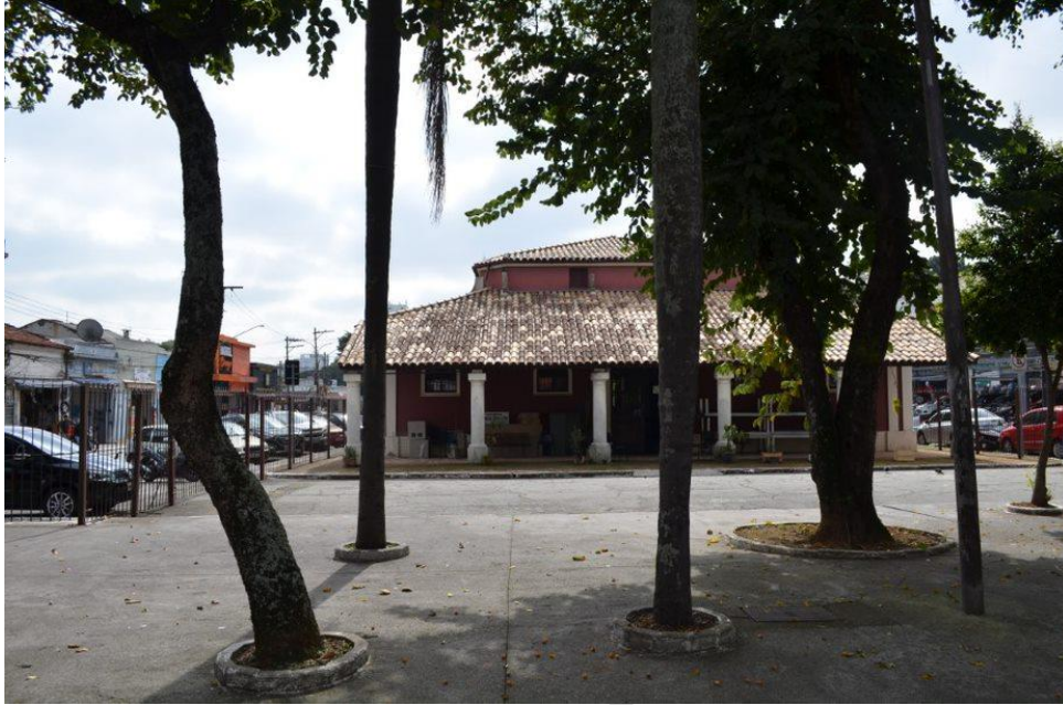
Figura 4 – Praça Dr. Francisco Ferreira Lopes, onde se localiza a Casa de Cultura de Santo Amaro