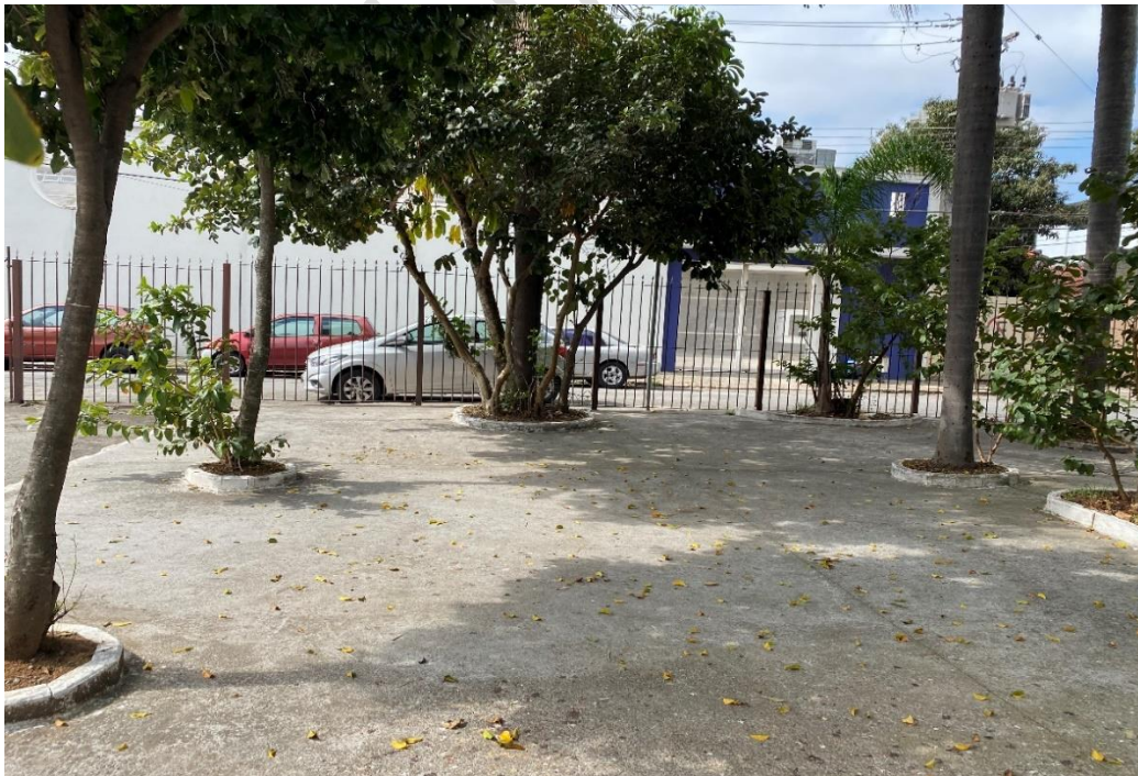
Figura 5 – ÁREA DA PERMISSÃO