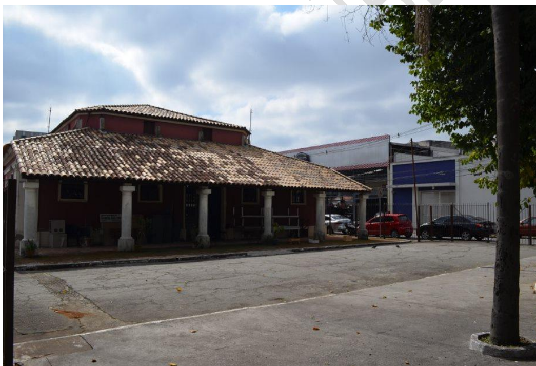
Figura 3 – Fachada da Casa de Cultura de Santo Amaro