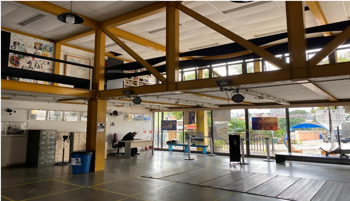
Figura 6 – ÁREA DA PERMISSÃO