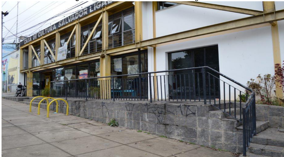
Figura 4 – Fachada da Casa de Cultura da Freguesia do Ó