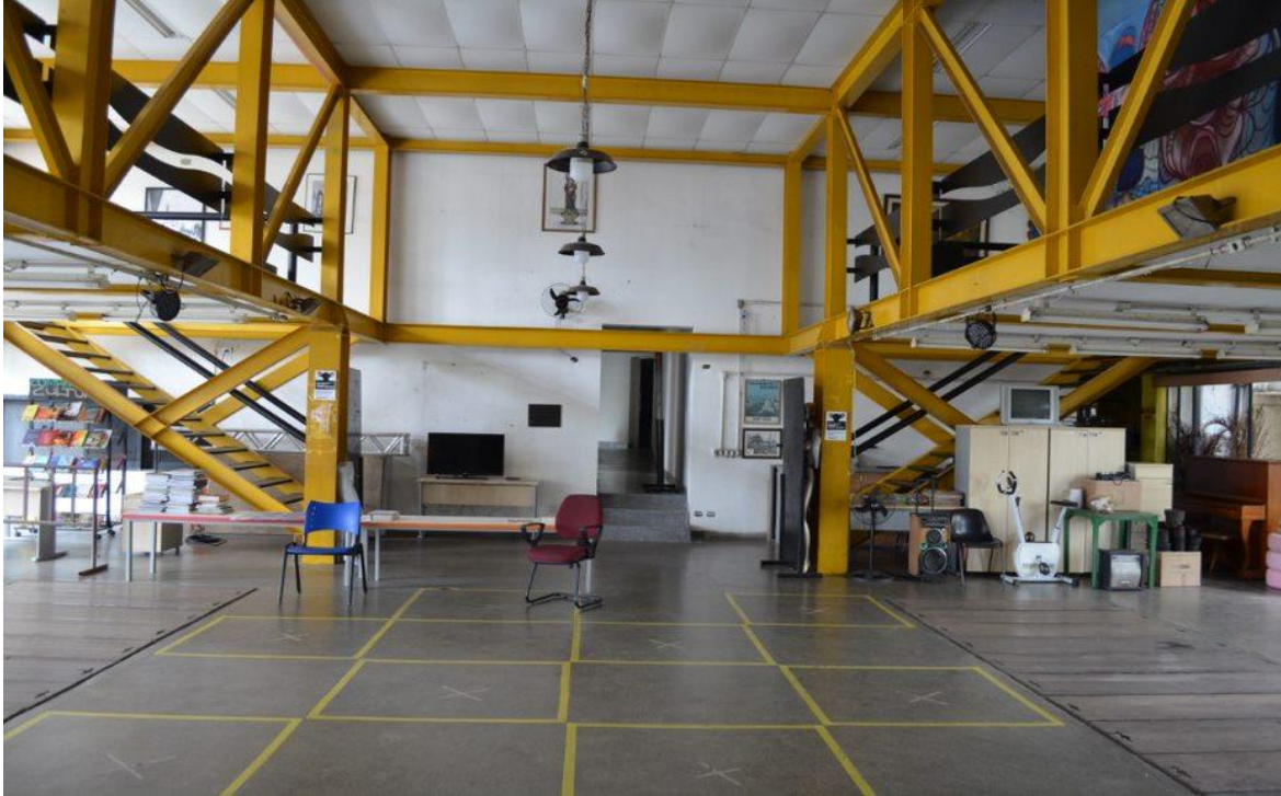
Figura 5 – Interior da Casa de Cultura da Freguesia do Ó