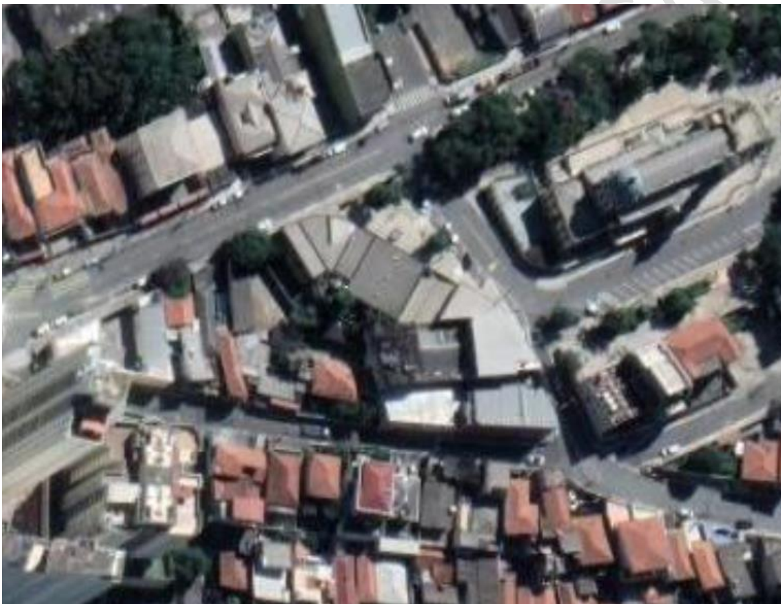
Figura 1 – Imagem de satélite atual