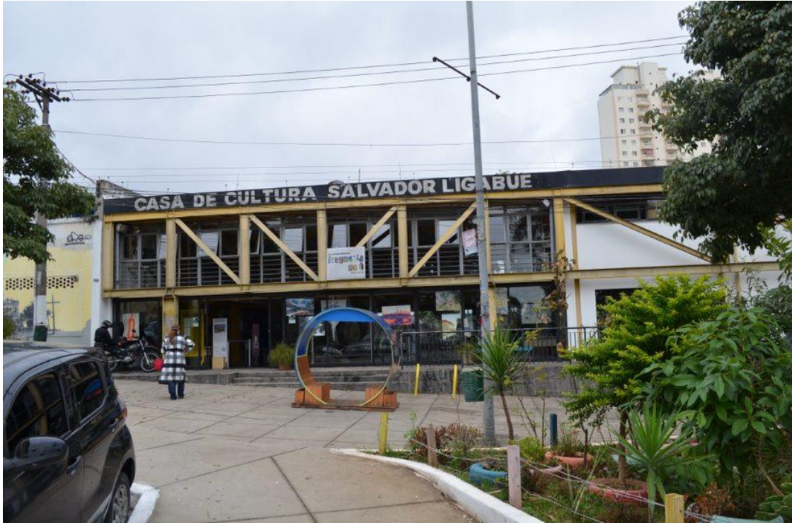
Figura 3 – Fachada da Casa de Cultura da Freguesia do Ó