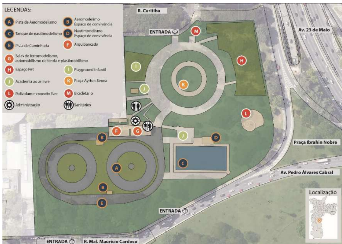
Figura 1 – Mapa do Modelódromo do Ibirapuera

A área de abrangência do presente CONTRATO compreende toda a extensão do Modelódromo do Ibirapuera, totalizando aproximadamente 26.000 m 2 (vinte e seis mil metros quadrados) 1 .