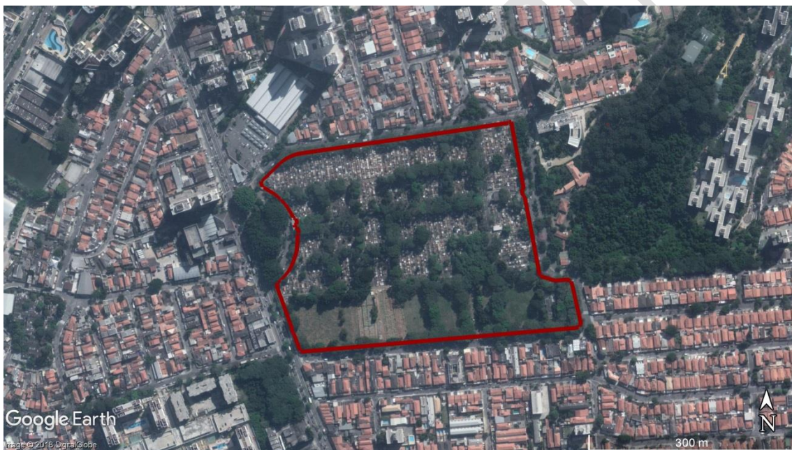
Figura 2 - Delimitação da área do CEMITÉRIO Campo Grande