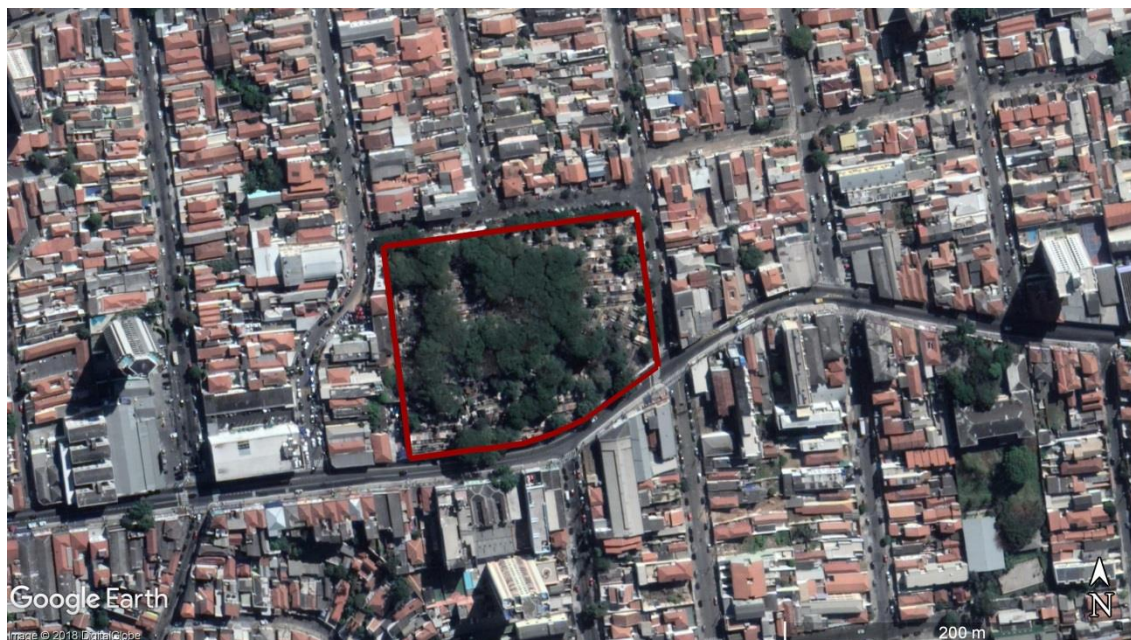
Figura 10 - Delimitação da área do CEMITÉRIO Penha