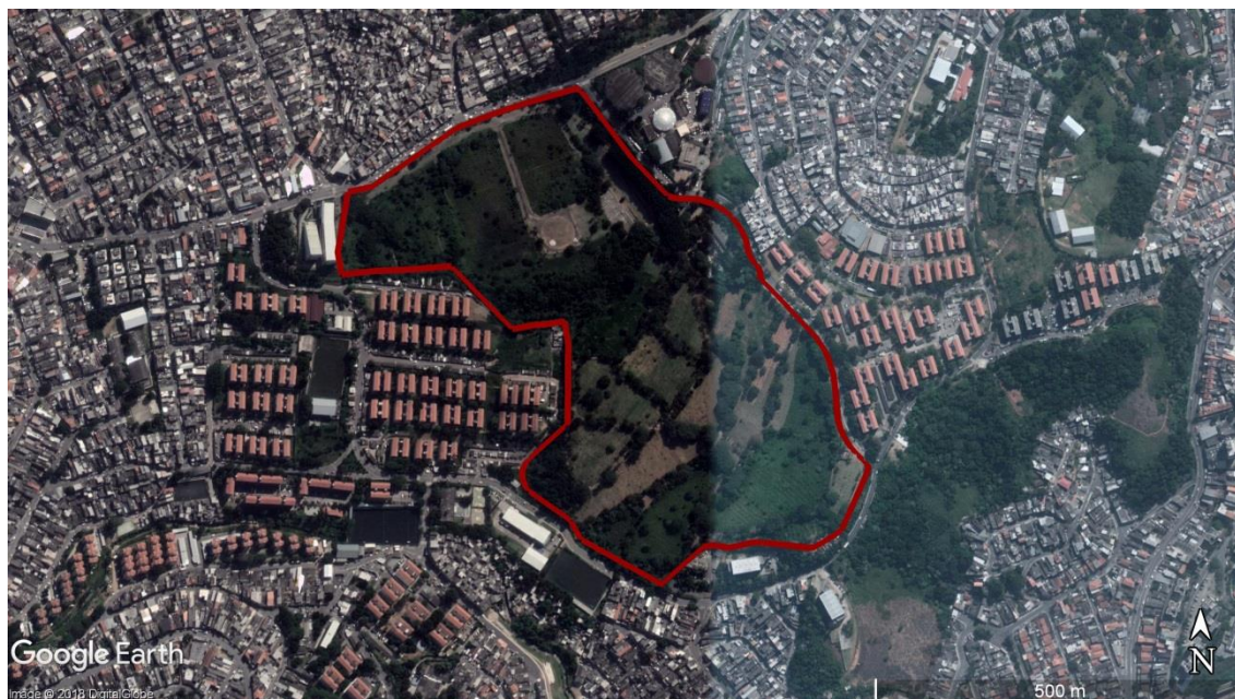
Figura 14 - Delimitação da área do CEMITÉRIO São Luiz