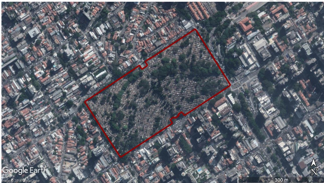
Figura 15 - Delimitação da área do CEMITÉRIO São Paulo