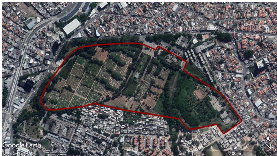
Figura 22 - Delimitação da área do CEMITÉRIO Vila Nova Cachoeirinha