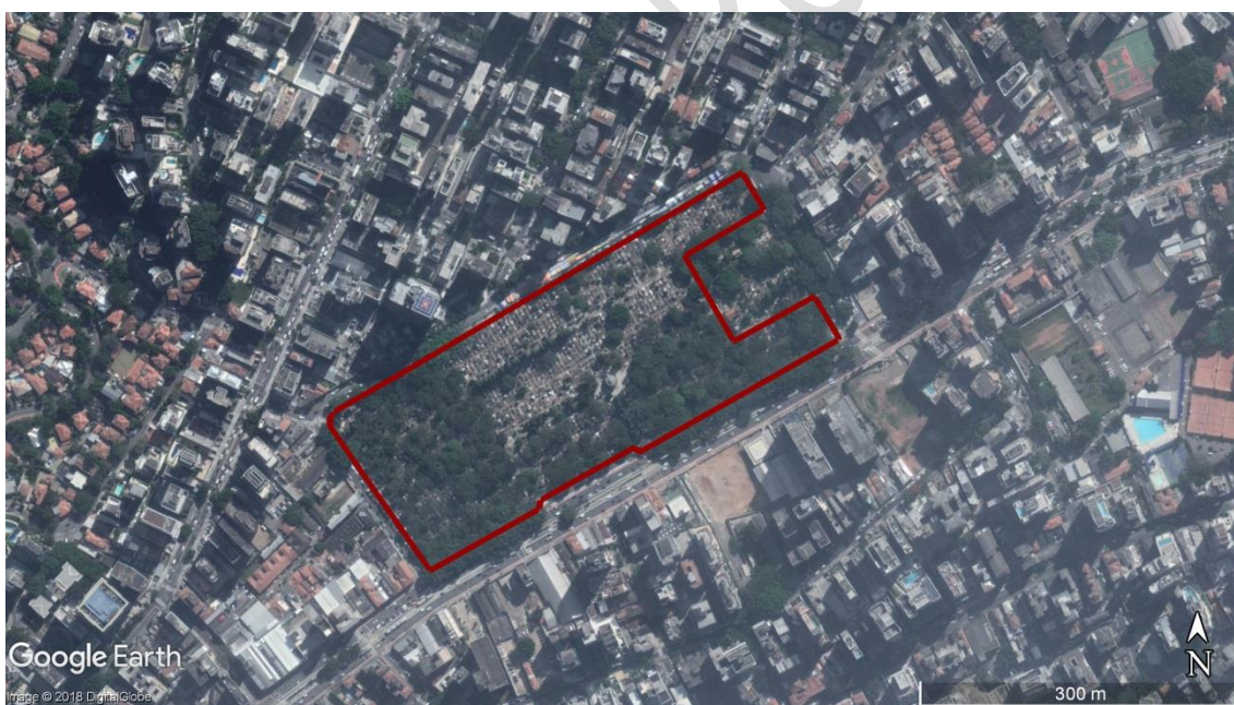
Figura 3 - Delimitação da área do CEMITÉRIO Consolação