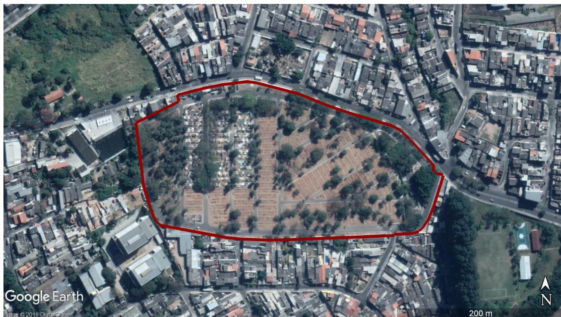
Figura 7- Delimitação da área do CEMITÉRIO Lageado