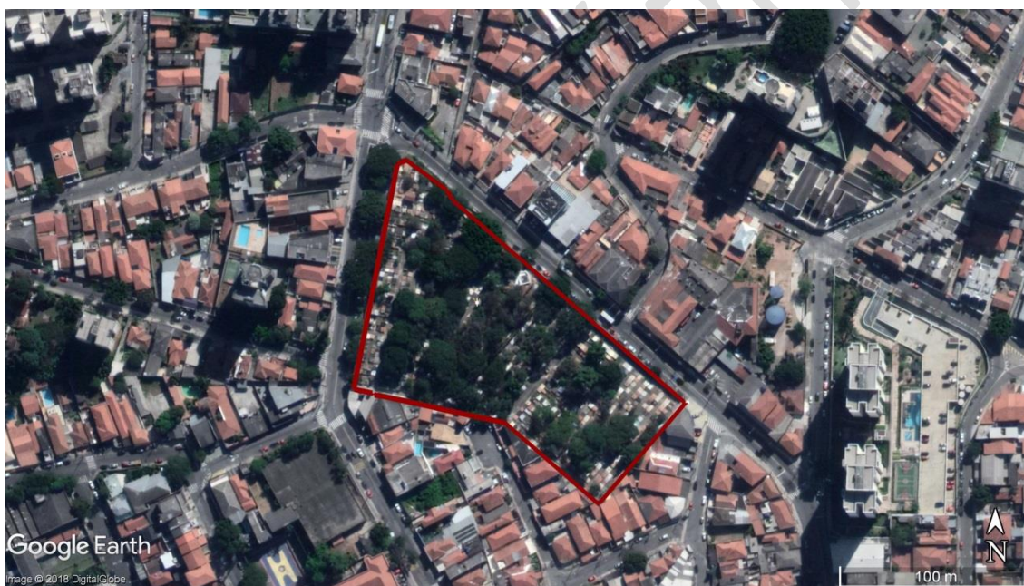
Figura 5 - Delimitação da área do CEMITÉRIO Freguesia do Ó