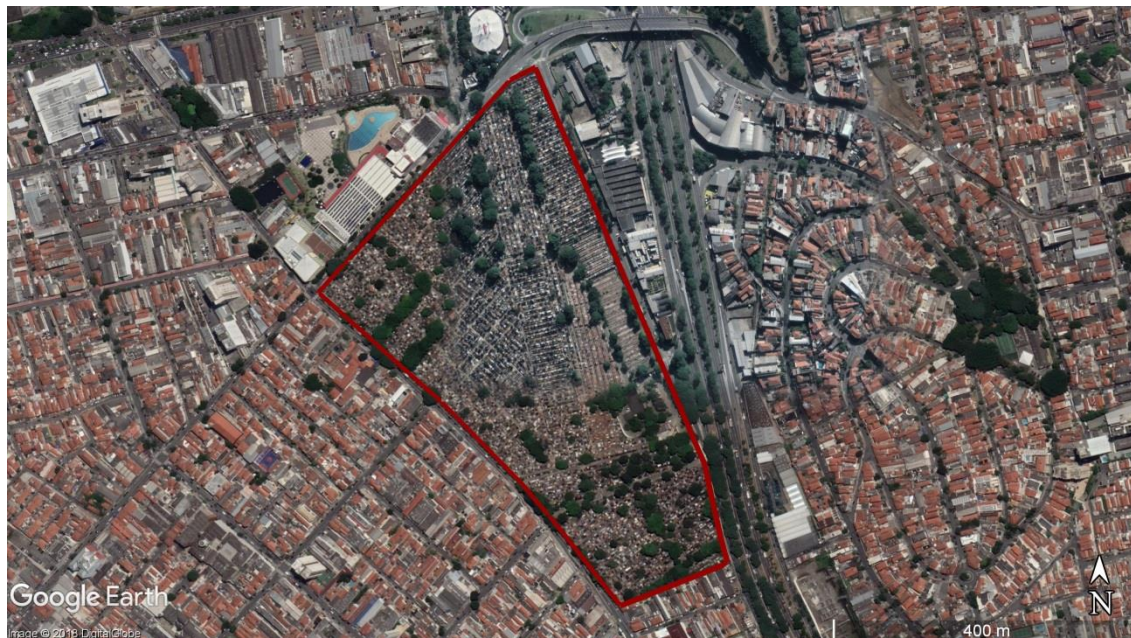
Figura 11 - Delimitação da área do CEMITÉRIO Quarta Parada