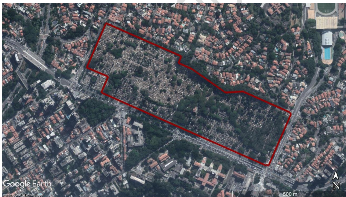
Figura 1 - Delimitação da área do CEMITÉRIO Araçá