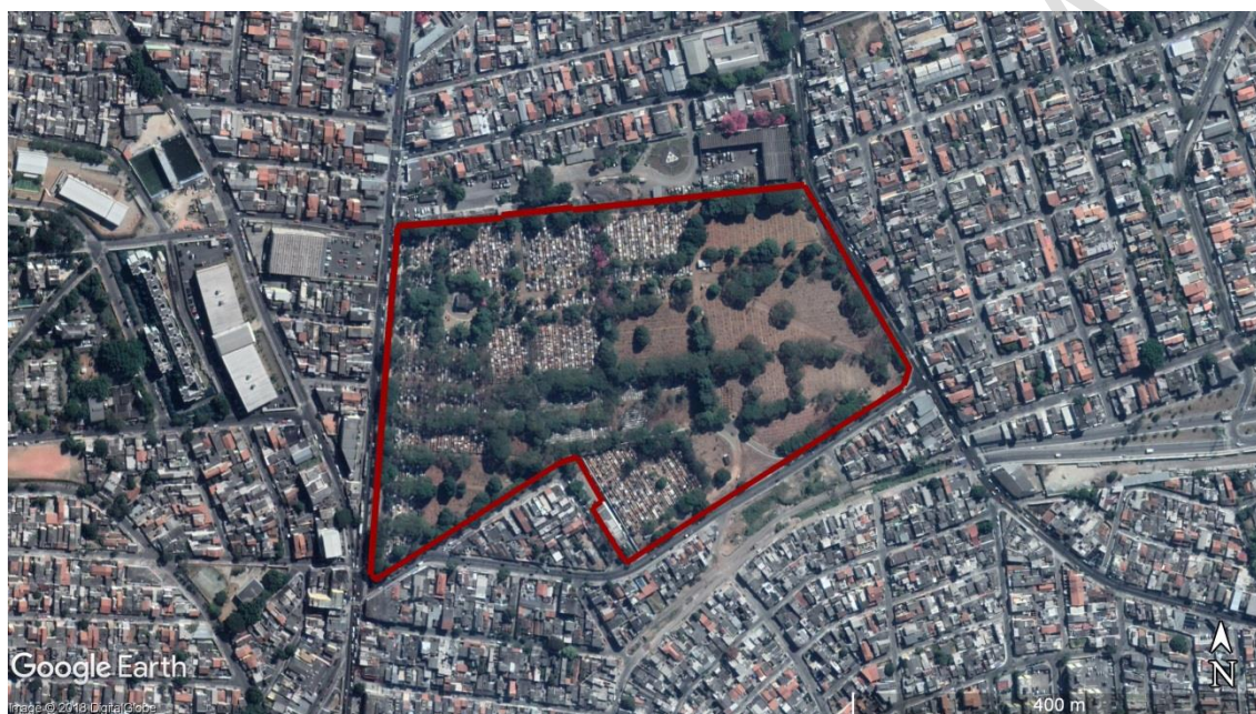
Figura 17 - Delimitação da área do CEMITÉRIO Saudade