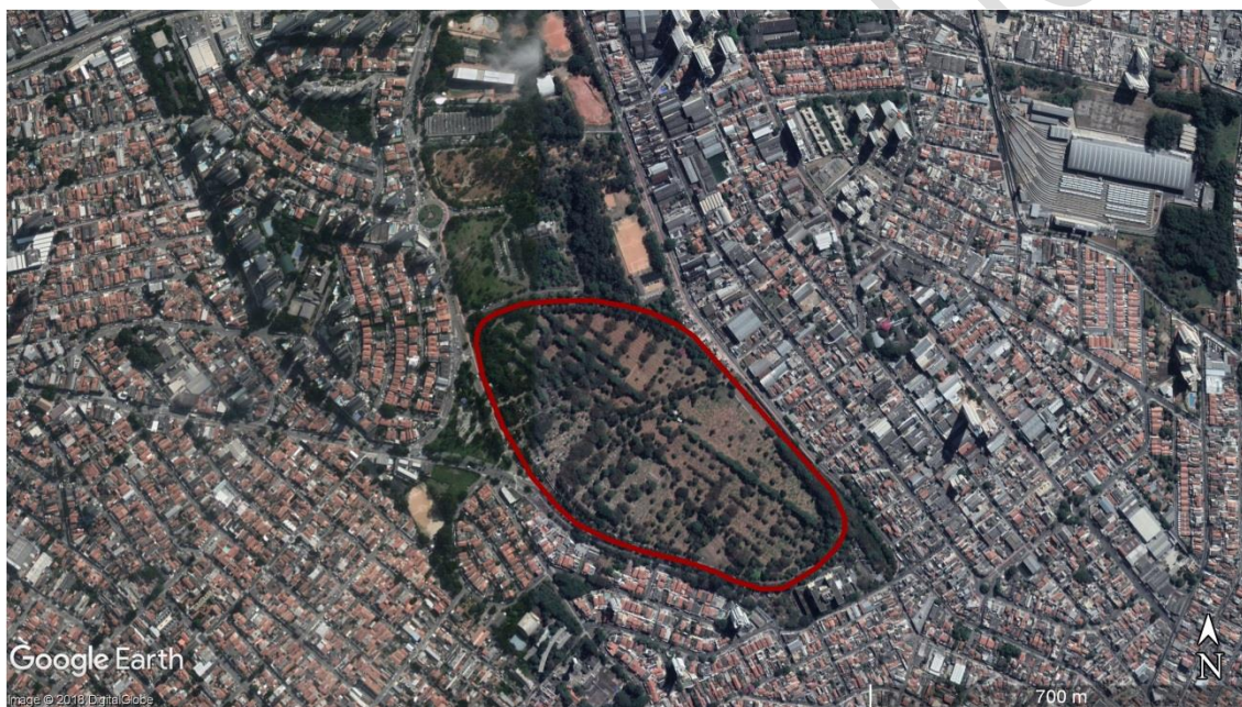
Figura 16 - Delimitação da área do CEMITÉRIO São Pedro