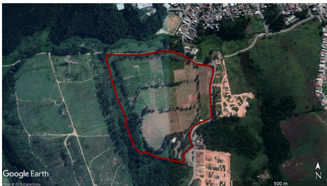
Figura 4 - Delimitação da área do CEMITÉRIO Dom Bosco