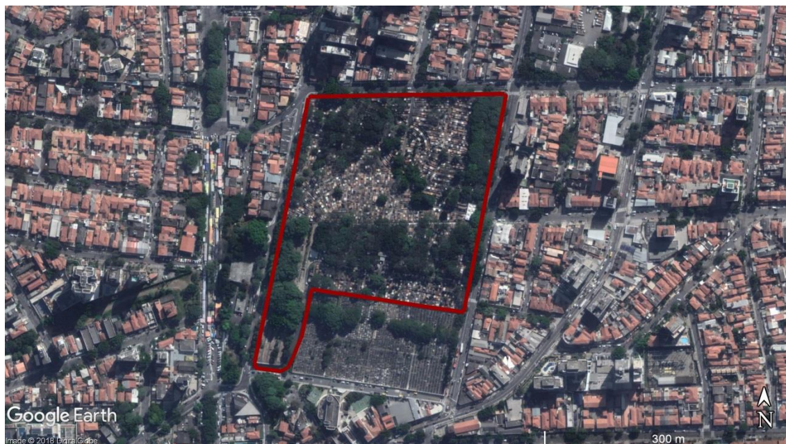
Figura 21 - Delimitação da área do CEMITÉRIO Vila Mariana