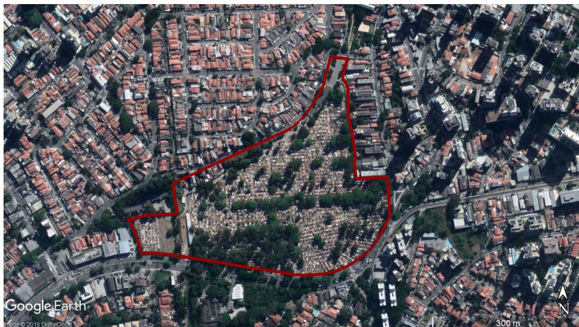
Figura 8 - Delimitação da área do CEMITÉRIO da Lapa