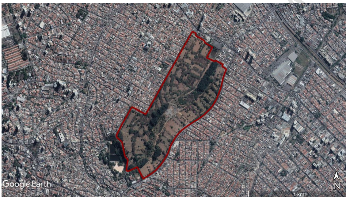
Figura 20 - Delimitação da área do CEMITÉRIO Vila Formosa I e II