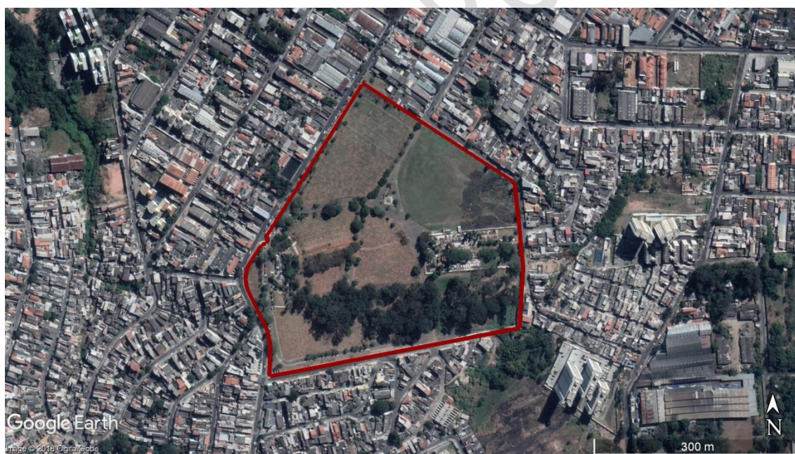
Figura 6 - Delimitação da área do CEMITÉRIO Itaquera

19.3. A área do CEMITÉRIO Itaquera OBJETO da CONCESSÃO é delimitada pelo perímetro em vermelho, disposto na Figura 6 a seguir.