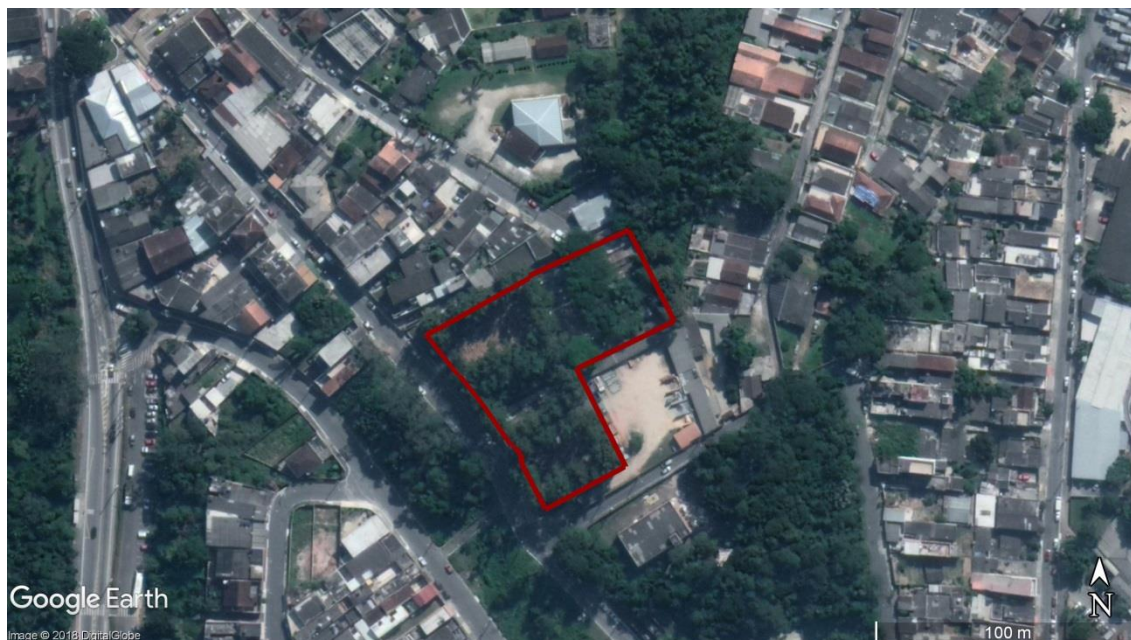
Figura 9 - Delimitação da área do CEMITÉRIO Parelheiros