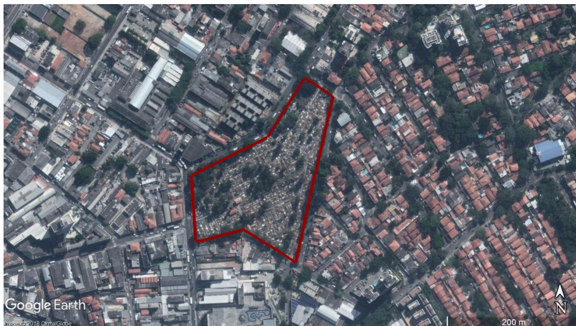
Figura 13 - Delimitação da área do CEMITÉRIO Santo Amaro