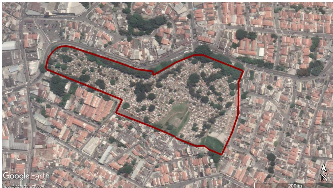
Figura 18- Delimitação da área do CEMITÉRIO Tremembé