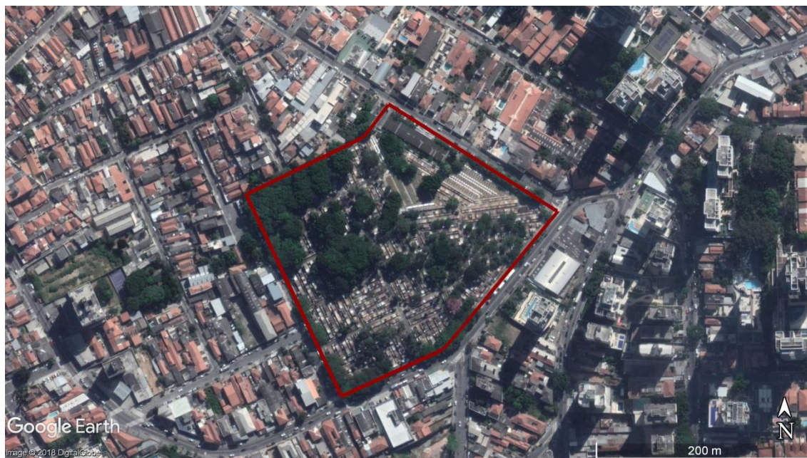
Figura 12 - Delimitação da área do CEMITÉRIO de SANTANA