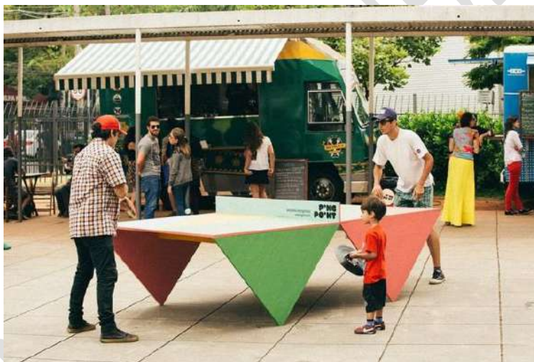
Figura 16 - Ping Point no MIS