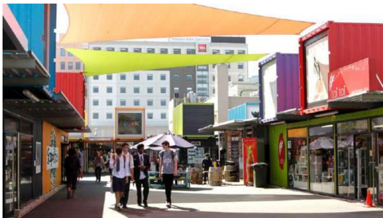
Figura 6 - Restart Mall , Nova Zelândia.