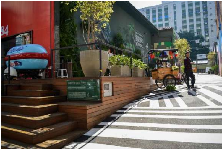
Figura 10 - Pracinha Oscar Freire