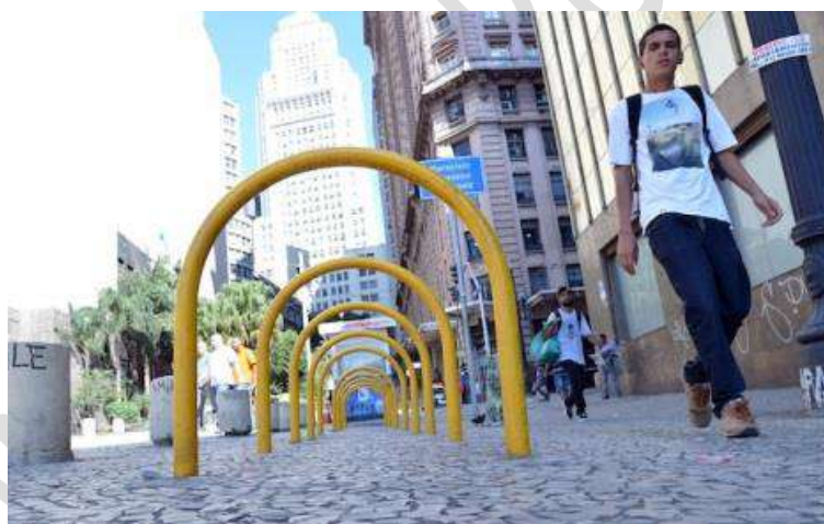
Figura 13 - Paraciclos - Centro de São Paulo.