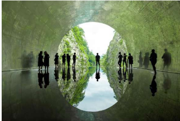
Figura 27 – Túnel restaurado em Kiyotsu, Japão – MAD Architects