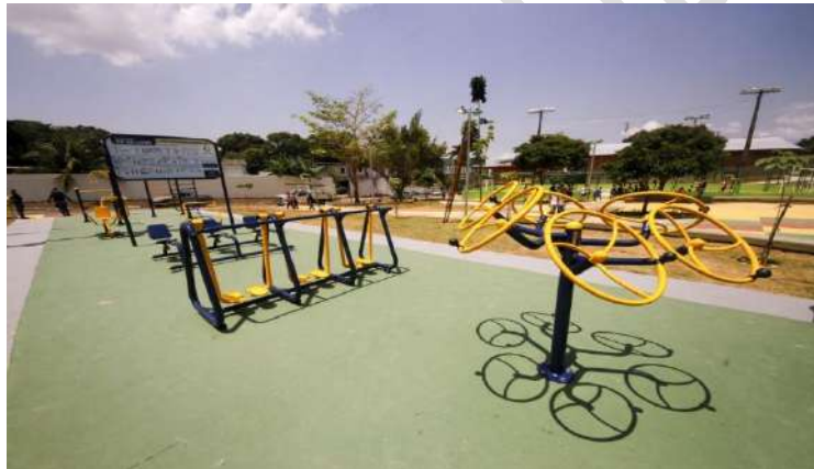
Figura 21 - Instalações para a prática de exercícios físicos, com equipamentos acessíveis.

A CONCESSIONÁRIA poderá desenvolver ATIVIDADES, tanto de INTERESSE COLETIVO como ECONÔMICAS.