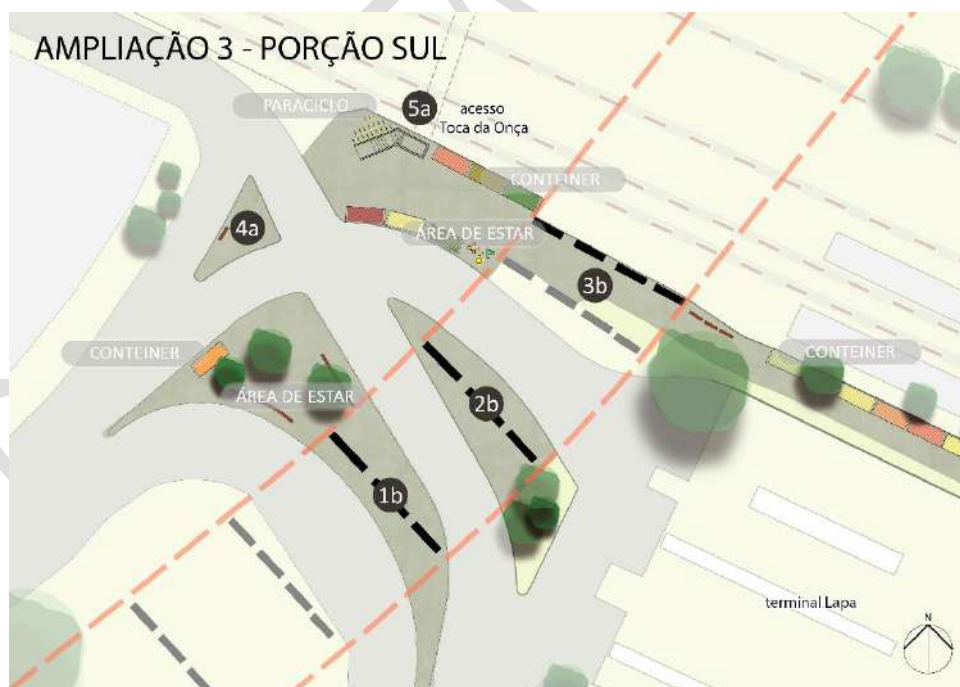
Figura 4 – Ampliação 3 do Plano de Ocupação Referencial – Porção Sul