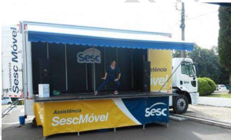
Figura 24 - SESC Móvel, palco itinerante