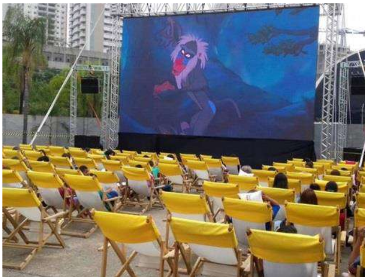
Figura 23 - Cinema ao ar livre em Campinas