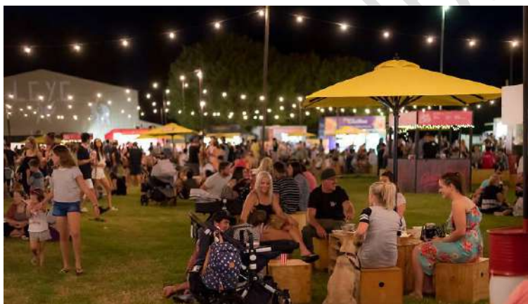
Figura 22 - Eventos com food trucks e food bikes

Por sua vez, entre as ATIVIDADES DE INTERESSE COLETIVO possíveis estão as socioculturais, esportivas, de saúde e educacionais tais como, a disponibilização de biblioteca fixa ou itinerante, espaços de leitura, cinema ao ar livre, apresentações teatrais e musicais, aulas e cursos diversos, exposições e intervenções artísticas, a disponibilização de atendimento médico, vacinação, atendimento psicológico, campanhas de conscientização à prevenção de doenças, distribuição de medicamentos, o oferecimento de atividades de danças, yoga, treinos de ginástica diversos, treinos esportivos , entre outras.