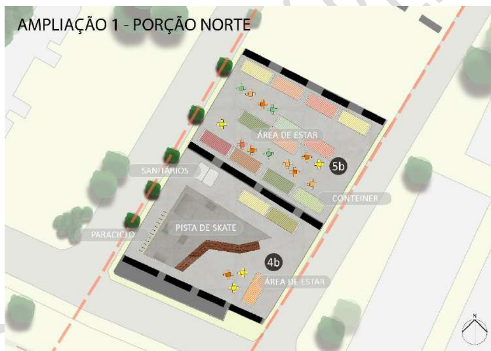
Figura 2 – Ampliação 1 do Plano de Ocupação Referencial – Porção Norte Fonte: Elaboração Própria

Nas áreas do baixo do VIADUTO LAPA (1b – 5b) são consideradas diversas possibilidades de ATIVIDADES, além das ilustradas nas ampliações que seguem, ora trazidas a título referencial.