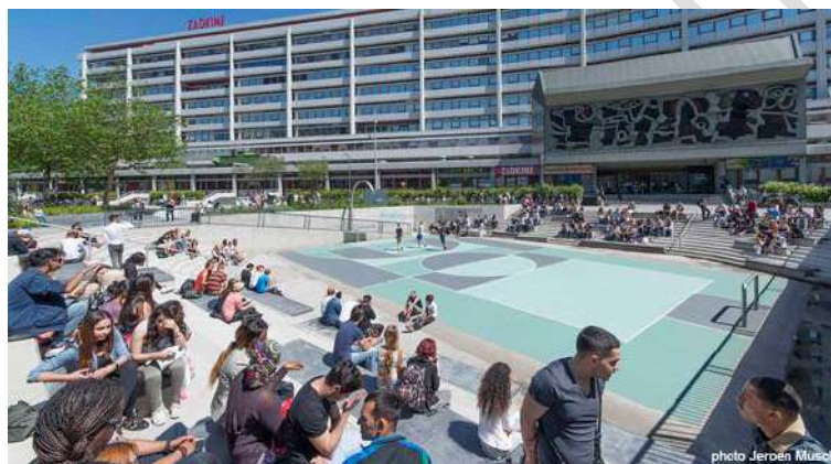
Figura 18 - Benthemplein