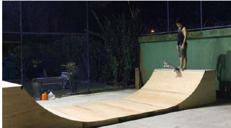
Figura 17 - Mini rampa.