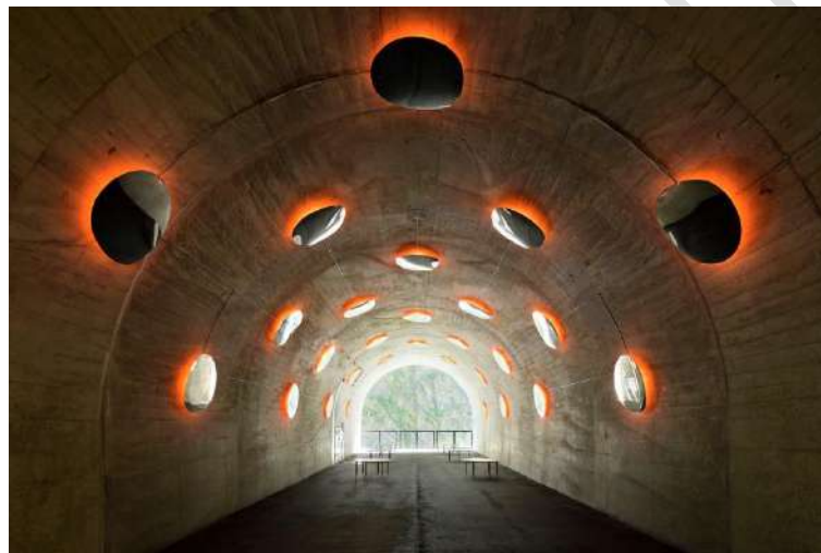
Figura 26 – Túnel restaurado em Kiyotsu, Japão – MAD Architects