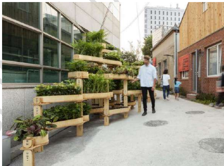
Figura 9 - Kit modular: Mini Jardim, Dinamarca