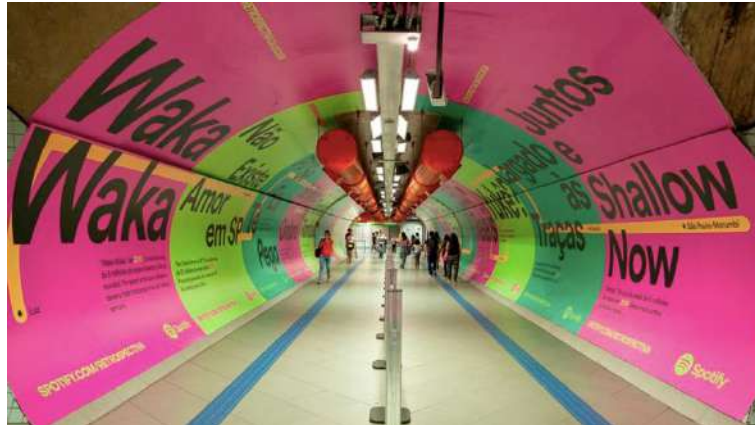
Figura 25 – Divulgação Spotify Metrô de São Paulo, Dezembro/2019