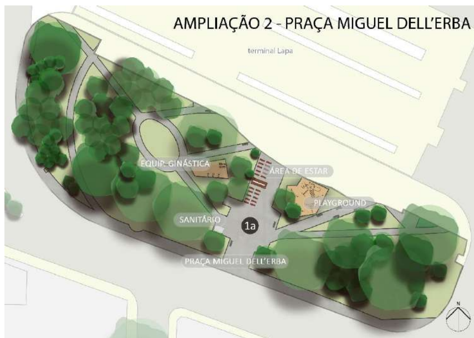
Figura 3 – Ampliação 2 do Plano de Ocupação Referencial – Praça Miguel Dell’Erba