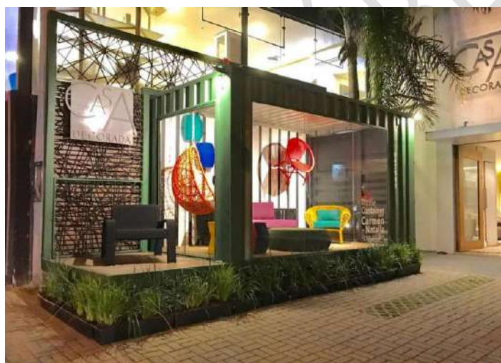
Figura 7 – Vitrine Container . Foto: Robson Salgado

O MOBILIÁRIO URBANO compreende bens e equipamentos de uso coletivo, instalados com a função de desenvolver áreas de estar e convivência, tais como, mas não limitados a assentos, mesas, floreiras, lixeiras, bebedouros, paraciclos, luminárias paisagísticas ou esportivas, etc, conforme imagens exemplificativas a seguir que tratam da instalação de equipamentos de estar (Figura 8 - Praça Amadeu Decome), de requalificação da paisagem (Figura 9 - Kit modular: Mini Jardim, Dinamarca, Figura 10 - Pracinha Oscar Freire e Figura 11 - Parques de bolsillo, Cidade do México.), de espaços