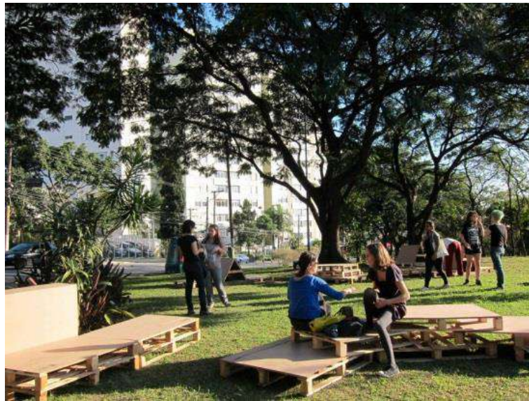
Figura 8 - Praça Amadeu Decome

de uso comunitário (Figura 12 - Horta Comunitária, Praça do Ciclista, São Paulo.) e de equipamentos de suporte ao usuário (Figura 13 - Paraciclos e Figura 14 - Banheiros Ecotransportáveis em Belo Horizonte.).