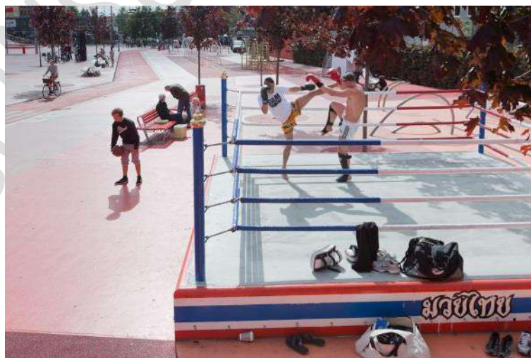
Figura 19 – Estrutura de Ringue – Superkilen, Copenhagem.