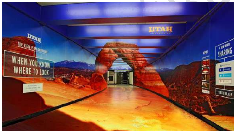
Figura 28 – Divulgação de Turismo em Utah na Estação Montgomery, São Francisco – Agência Struck