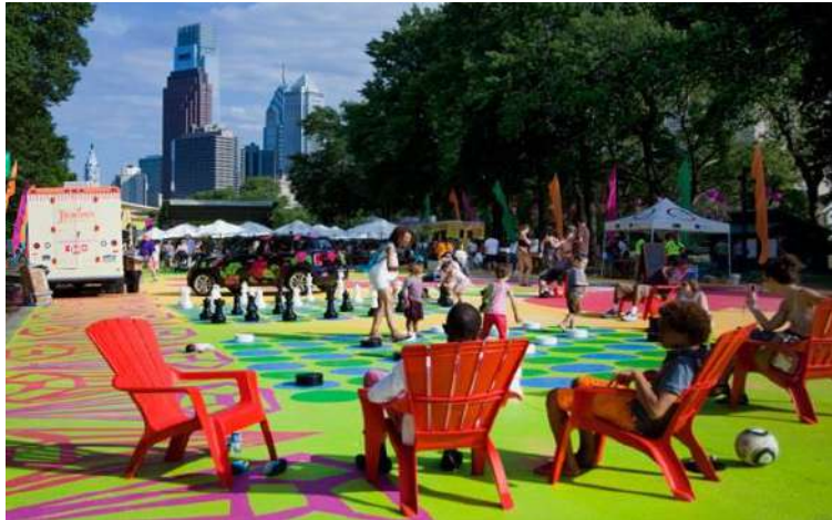
Figura 20 – Estrutura de xadrez e dama, The Oval park, Philadelphia.