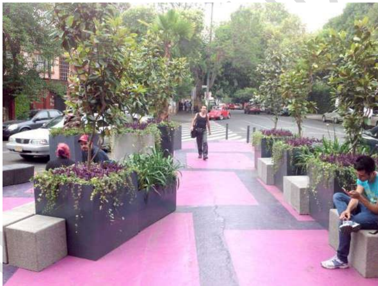
Figura 11 - Parques de bolsillo, Cidade do México.