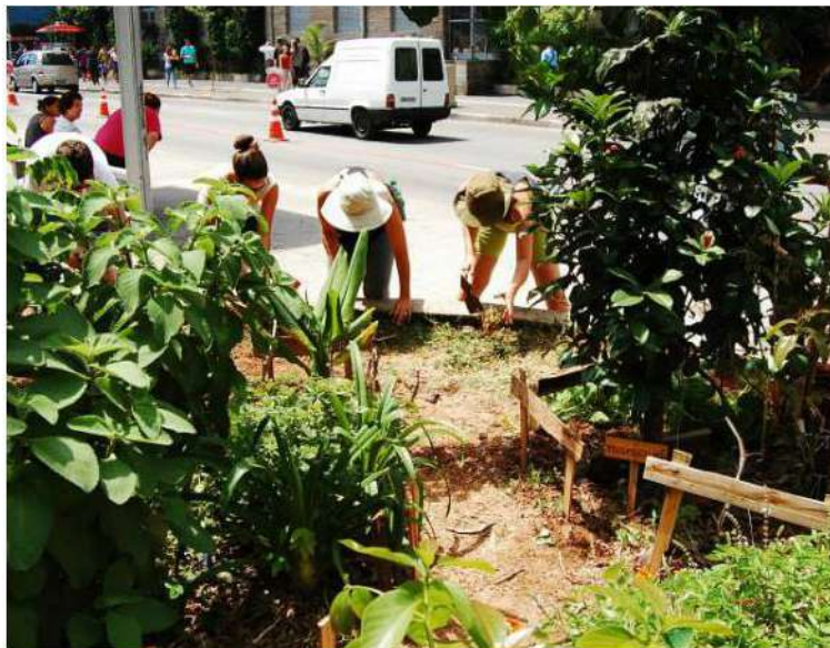
Figura 12 - Horta Comunitária, Praça do Ciclista, São Paulo.