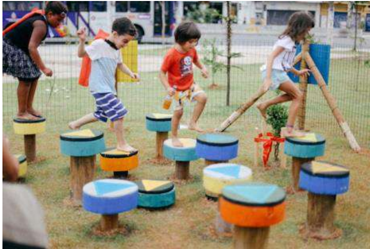
Figura 15 - Brinquedos lúdicos no Largo da Batata.