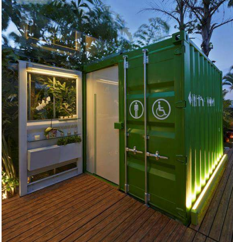
Figura 14 - Banheiros Ecotransportáveis em Belo Horizonte.

Os EQUIPAMENTOS compreendem bens de uso coletivo, instalados com a função de prover à ÁREA DA CONCESSÃO um uso específico, tais como, mas não limitados a quadra poliesportiva, playground, academia ao ar livre; área de skate; área de bicicleta; cachorródromo, entre outras destinações, conforme exemplificadamente demonstrado nas imagens a seguir com equipamentos de caráter recreativo e lúdico (Figura 15 - Brinquedos lúdicos no Largo da Batata. e Figura 16 - Ping Point), instalações esportivas (Figura 17 - Mini rampa., Figura 18 - Benthemplein, Figura 19 – Estrutura de Ringue – Superkilen, Copenhagem.e Figura 20 – Estrutura de Xadrez e Dama) e de prática de exercícios físicos (Figura 21 - Instalações para a prática de exercícios físicos, com).