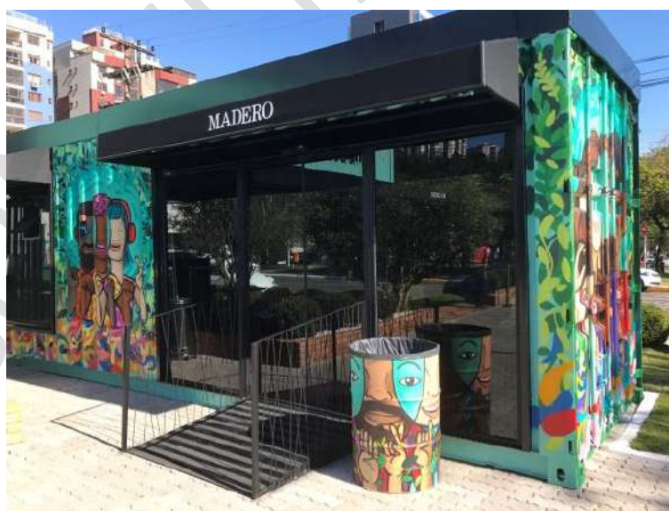
Figura 5 - Madero Container – Novo Hamburgo – RS.

Compostas por ESTRUTURAS AUTOPORTANTES, EDIFICAÇÕES, EQUIPAMENTOS e MOBILIÁRIO URBANO, as INSTALAÇÕES podem ser implantadas pela CONCESSIONÁRIA para a realização de ATIVIDADES e EVENTOS, conforme projeto a ser desenvolvido pela CONCESSIONÁRIA e aprovado pelo PODER CONCEDENTE e CMDP com objetivo de requalificar a ÁREA DA CONCESSÃO.