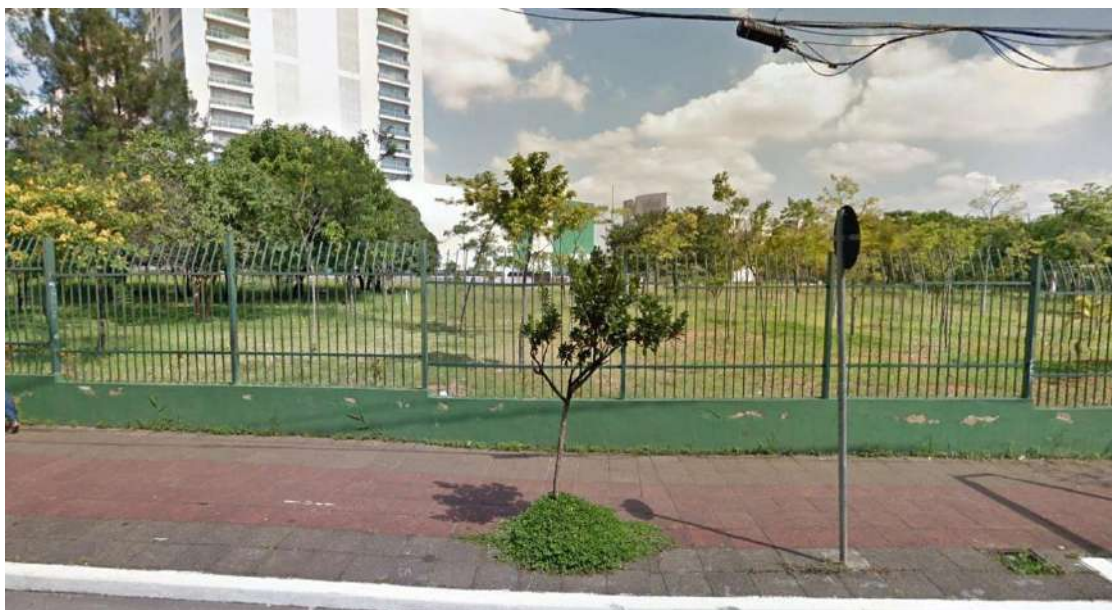
Figura 3: Área localizada na adjacência do Viaduto Antártica (Google 2018)