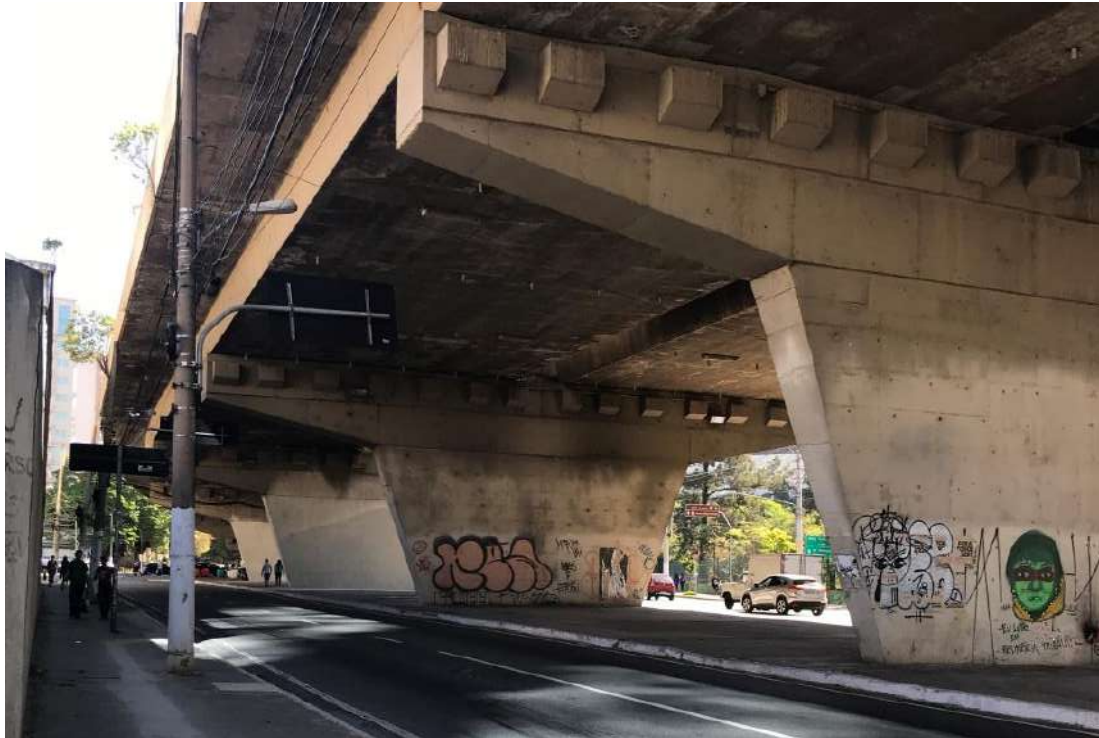
Figura 2: Área do Baixo do Viaduto Antártica

O grande fluxo de pedestres que circula pela região provém, também, do Terminal Intermodal Palmeiras – Barra Funda, que é o segundo intercambiador de transporte mais importante de São Paulo, atrás somente do Terminal Rodoviário do Tietê, e reúne, num mesmo complexo, linhas de ônibus municipais, intermunicipais, interestaduais, internacionais e metropolitanos de trens e metrô, estando localizado a apenas 500m das áreas dos baixos e adjacências do Viaduto Antártica.