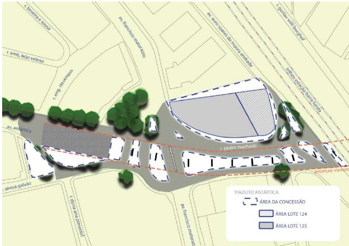
Figura 4: Mapa delimitando a ÁREA DA CONCESSÃO (Elaboração própria)

Assim, nos termos acima, a ÁREA DA CONCESSÃO compreende toda a extensão do baixo da porção ao sul da linha férrea do VIADUTO ANTÁRTICA e suas ADJACÊNCIAS , conforme delimitados no mapa abaixo: