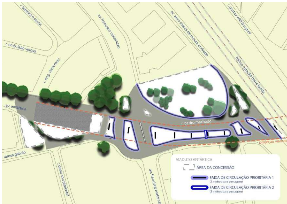
Figura 6 – Delimitação das FAIXAS DE CIRCULAÇÃO PRIORITÁRIAS (Elaboração própria)

A FAIXA DE CIRCULAÇÃO 1, inserida no perímetro de praticamente a totalidade da ÁREA DA CONCESSÃO, possui como dimensões mínimas obrigatórias a largura de 2m (dois metros) destinados à livre circulação de pedestres e transeuntes podendo ser subdividida em 1,20m (um metro e vinte centímetros) de faixa livre e 0,80m (oitenta centímetros) de faixa de serviço.