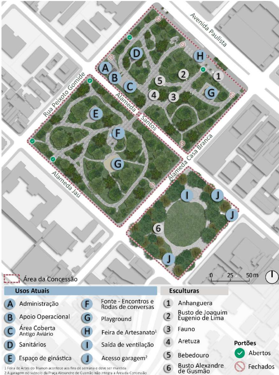
Figura 7 - Ocupação Atual - Parque Tenente Siqueira Campos (Trianon)