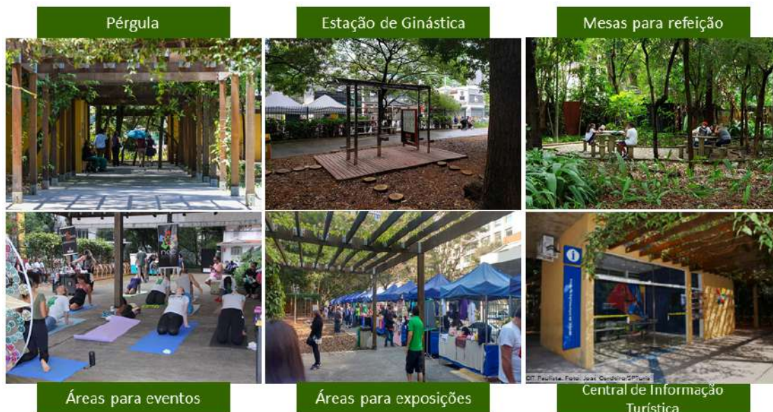
Figura 3 – Ocupação Atual - Parque Mário Covas