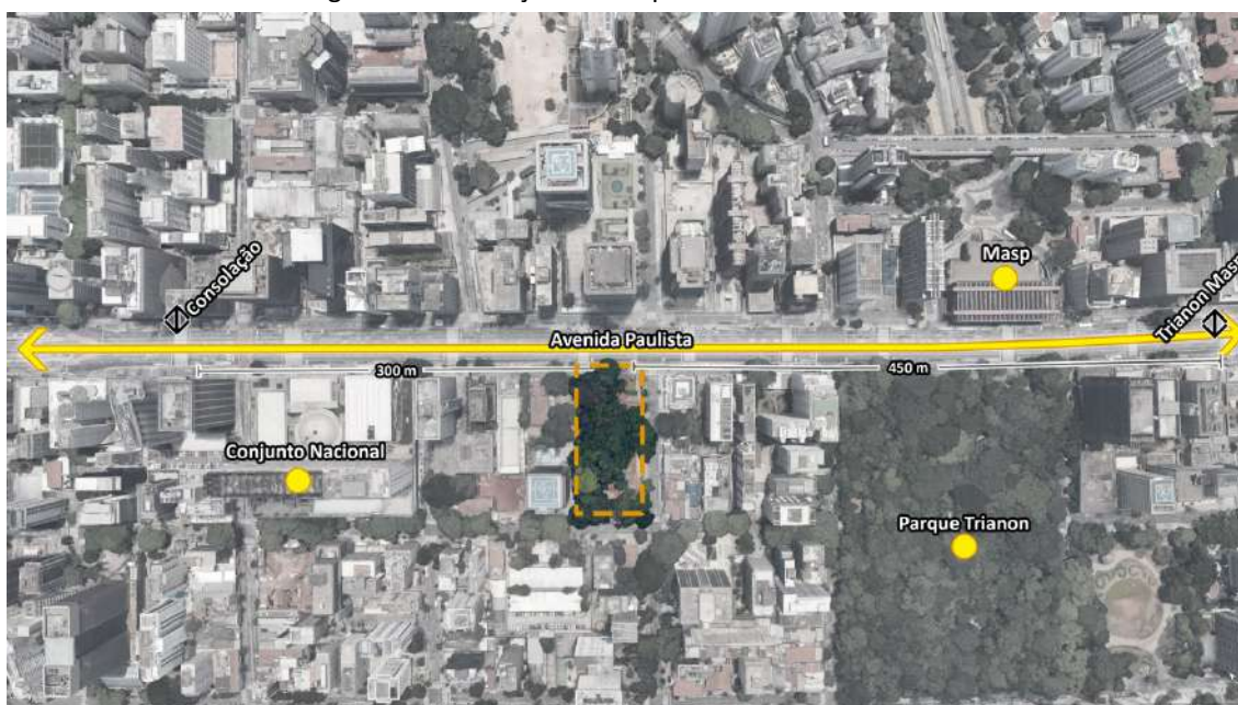
Figura 1 - Localização do Parque Prefeito Mário Covas