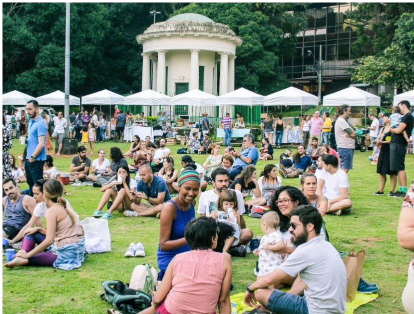
Figura 5 – Feira do Intercâmbio e Criatividade realizada em 2019