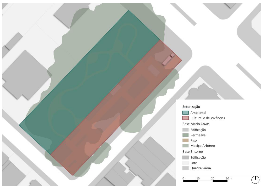
Figura 1 – Setorização do PARQUE PREFEITO MÁRIO COVAS

2.1.2. O parque é dividido em Setor Ambiental e Setor Cultural e de Vivências em função das particularidades de implantação, notadamente quanto à vegetação, e conformações dos espaços livres, acrescidas da dinâmica espacial resultante dos usos e apropriações.