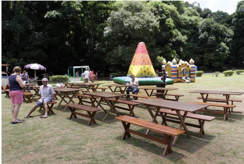
Figura 4 – Feira gastronômica com atrações musicais e atividades infantis realizado em 2017 na PRAÇA ALEXANDRE DE GUSMÃO