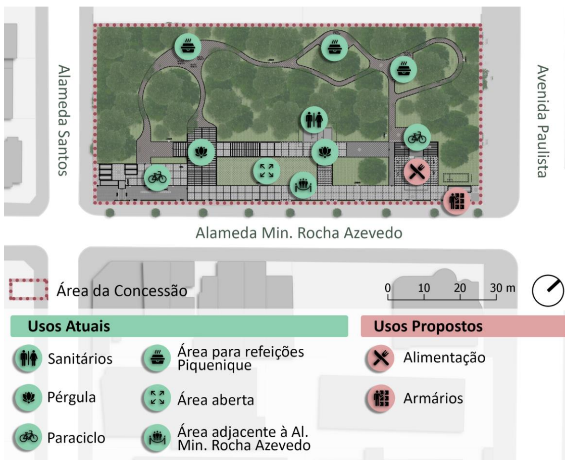
Figura 2 – Plano de Ocupação Referencial do PARQUE PREFEITO MÁRIO COVAS

2.1.5. As propostas apresentadas estão sintetizadas na Figura 1 e Quadro 1 a seguir.