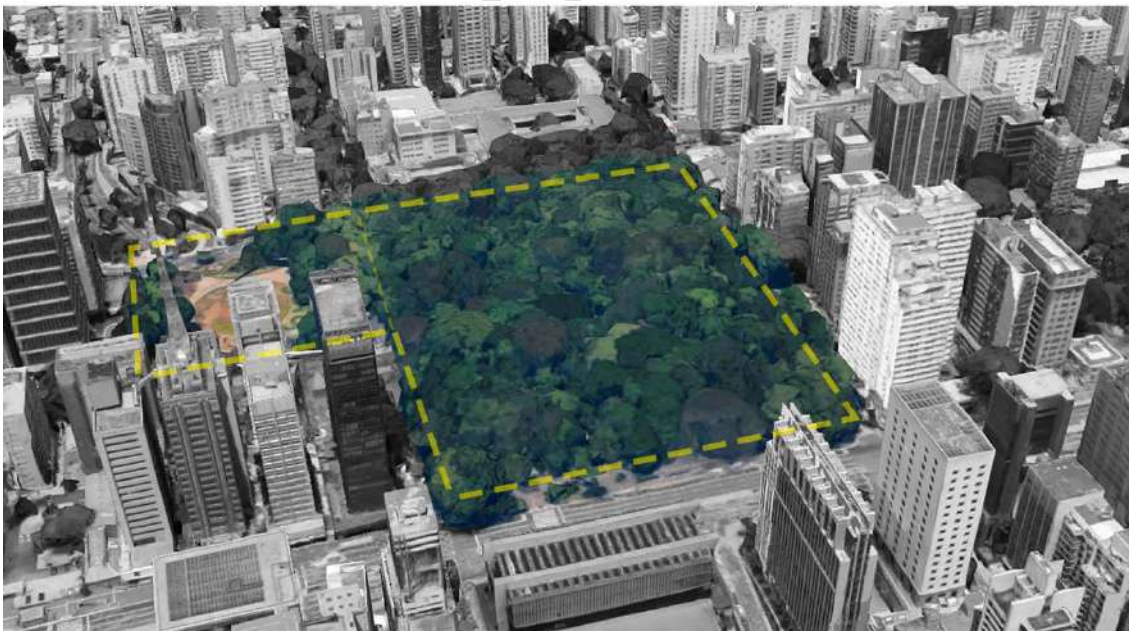
Figura 8 - Perímetro - Parque Tenente Siqueira Campos (Trianon) e Praça Alexandre de Gusmão