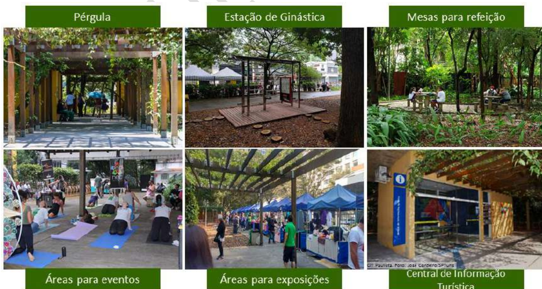
Figura 3 – Ocupação Atual - Parque Mário Covas