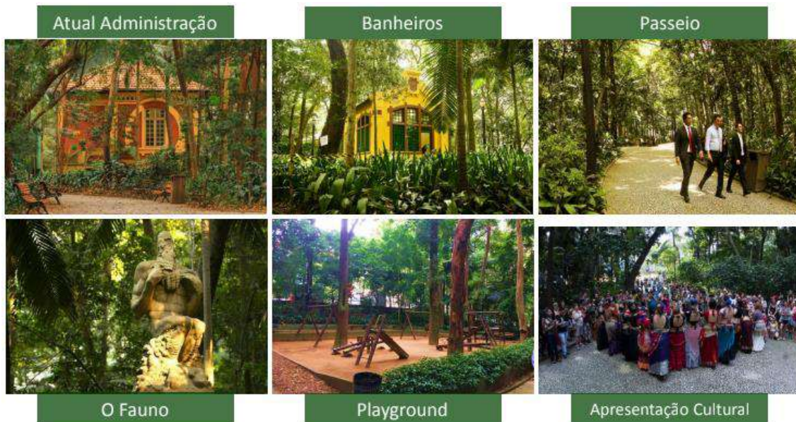
Figura 7 - Ocupação Atual - Parque Tenente Siqueira Campos (Trianon)