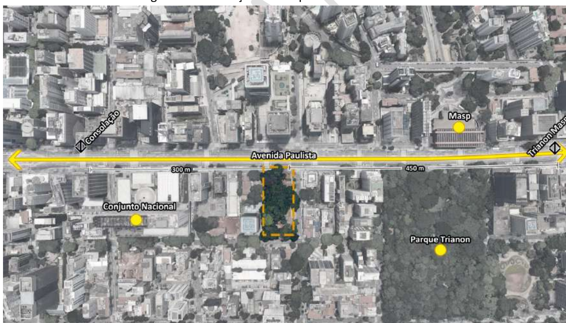
Figura 1 - Localização do Parque Prefeito Mário Covas