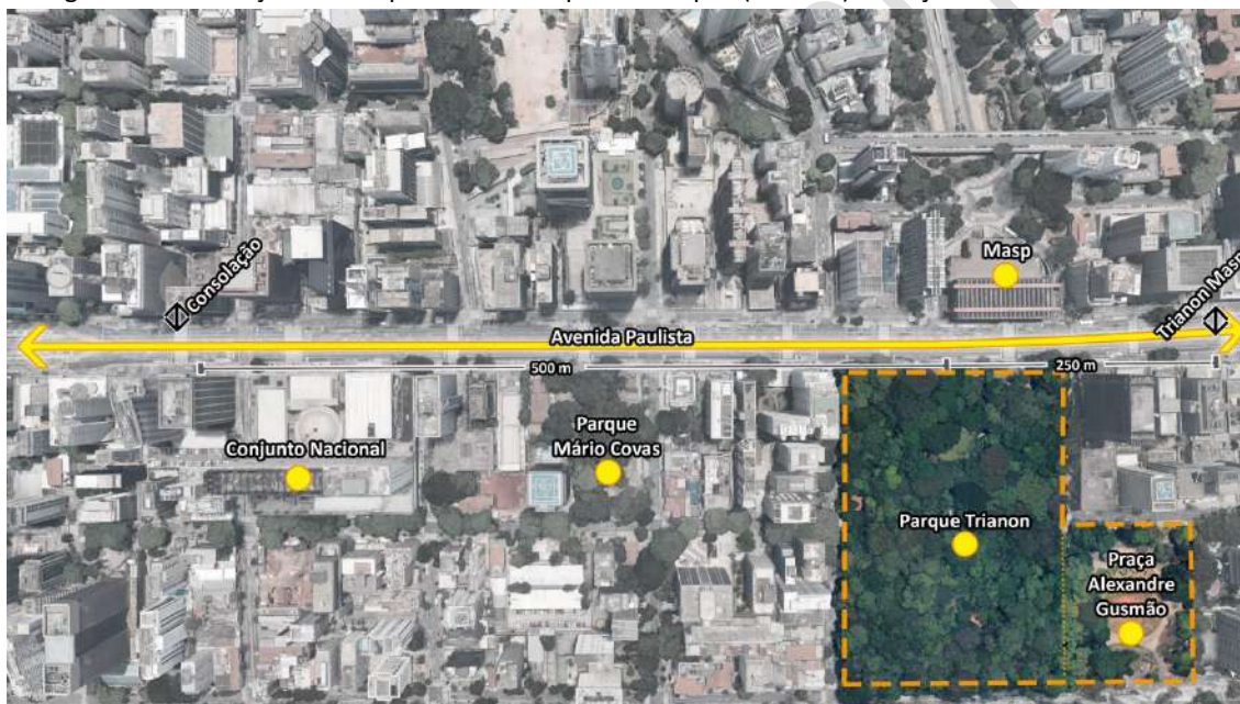
Figura 5 - Localização do Parque Tenente Siqueira Campos (Trianon) e Praça Alexandre de Gusmão

Fonte: Google Earth Pro. Disponível em: < www.google.com/earth >. Acesso em: mar. 2019. Elaboração Própria.