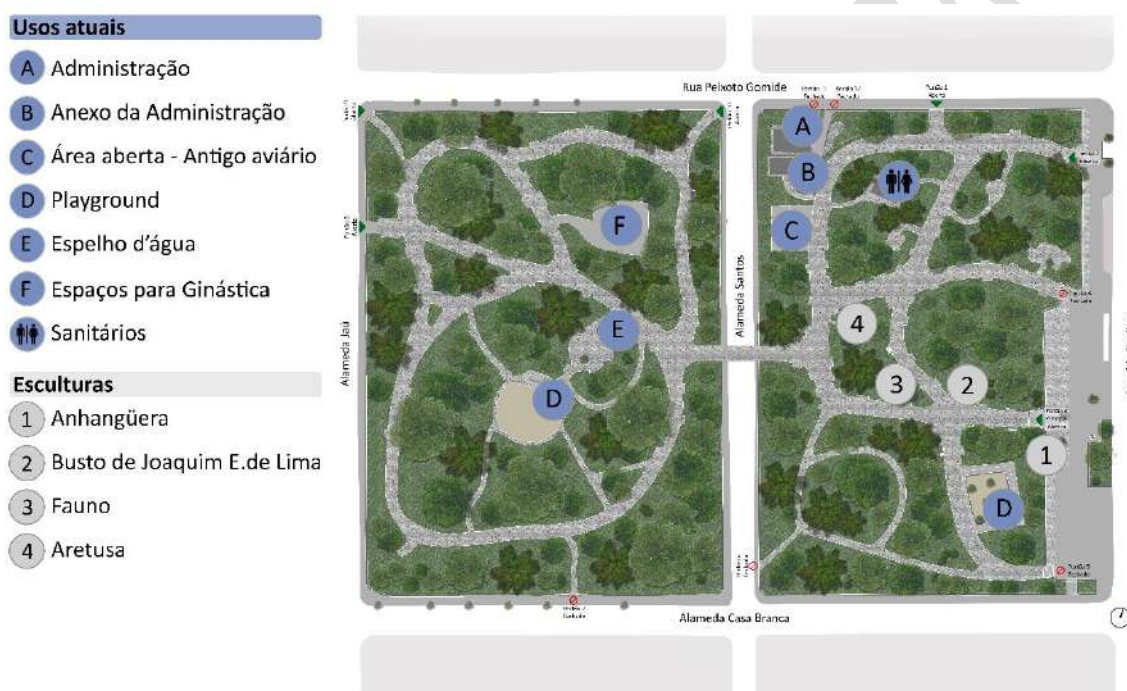
Figura 6 - Usos - Parque Tenente Siqueira Campos (Trianon)

Fonte: Secretaria do Verde e do Meio Ambiente. Elaboração Própria.