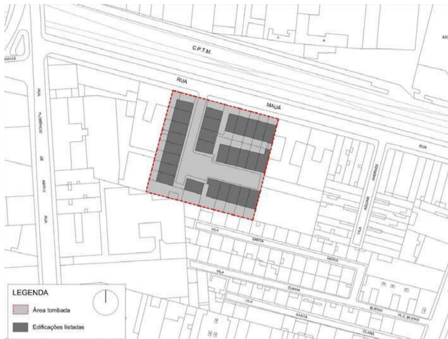
Anexo II - Mapa do Perímetro de Tombamento