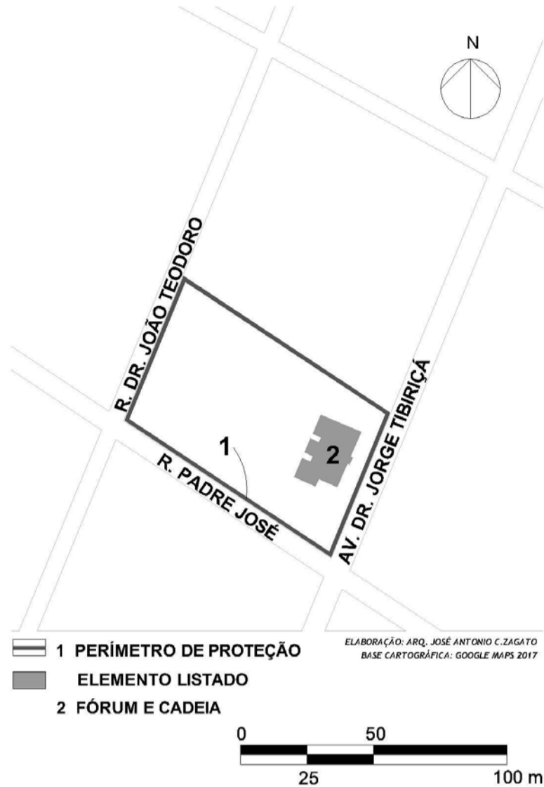
Anexo II: Mapa do Perímetro de Tombamento