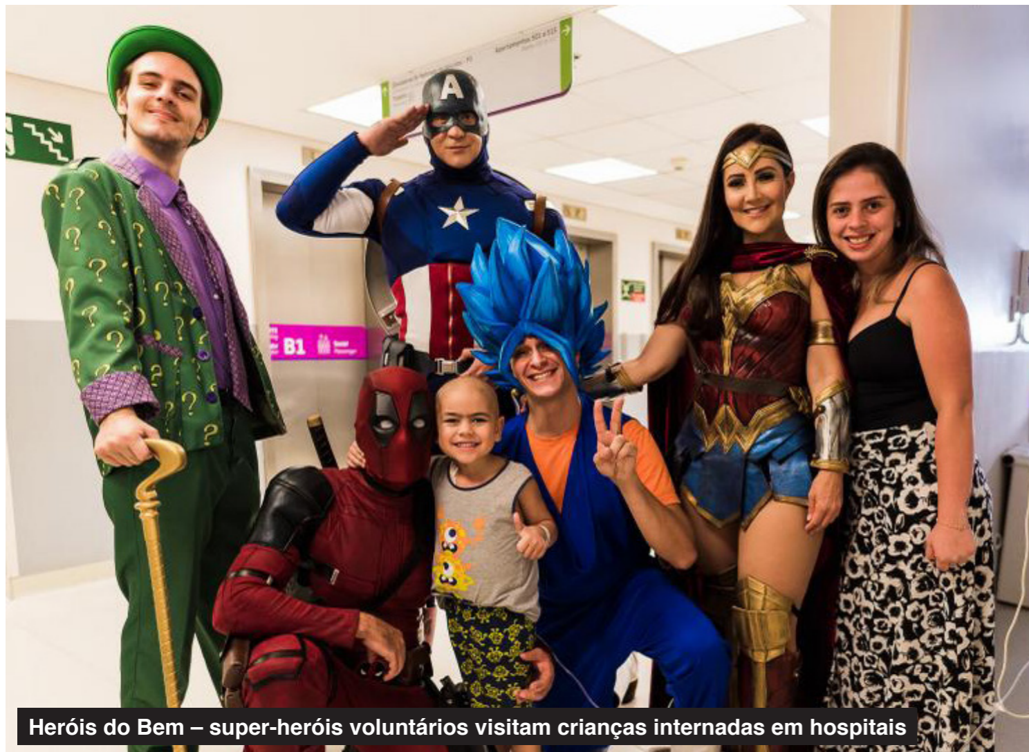
Heróis do Bem – super-heróis voluntários visitam crianças internadas em hospitais

Novembro 2022 Nº5 | 17/11/2022 (Circulação Quinzenal)