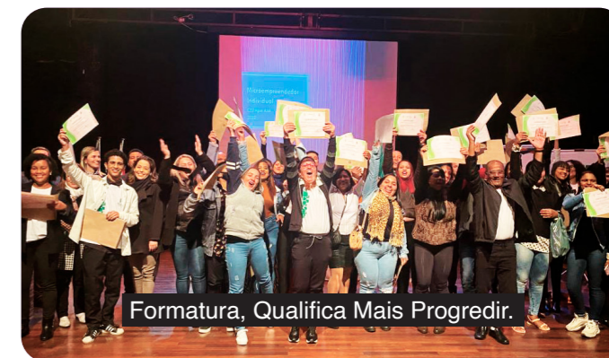
Formatura, Qualifica Mais Progredir.

No dia 30/08, em cerimônia no CEU Água Azul, 40 jovens receberam o certificado de conclusão do curso de Microempreendedor Individual (MEI) do Programa Qualifica Mais Progredir, parceria da Coordenação de Políticas para Juventude com o Ministério da Educação.