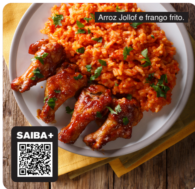
Arroz Jollof e frango frito.

A cidade de São Paulo é conhecida por ser multicultural, que acolhe migrantes de todas as partes do mundo. Alguns bairros são conhecidos pela grande concentração de populações como italianos no Bixiga, japoneses na Liberdade, bolivianos no Pari, coreanos no Bom Retiro. Para reunir informações e prestações de serviços de migrantes e para migrantes, a Coordenação de Políticas para Imigrantes e Promoção do Trabalho Decente da SMDHC, com o apoio da Organização Internacional para Migrações (OIM) lançou o Mapeamento Colaborativo, que está disponível online em cinco idiomas. Coletivos, associações, organizações e pessoas migrantes podem inscrever suas iniciativas nas áreas indicadas preenchendo um relatório nesse link https://linktr.ee/smdhcmapeamento até 30/09.