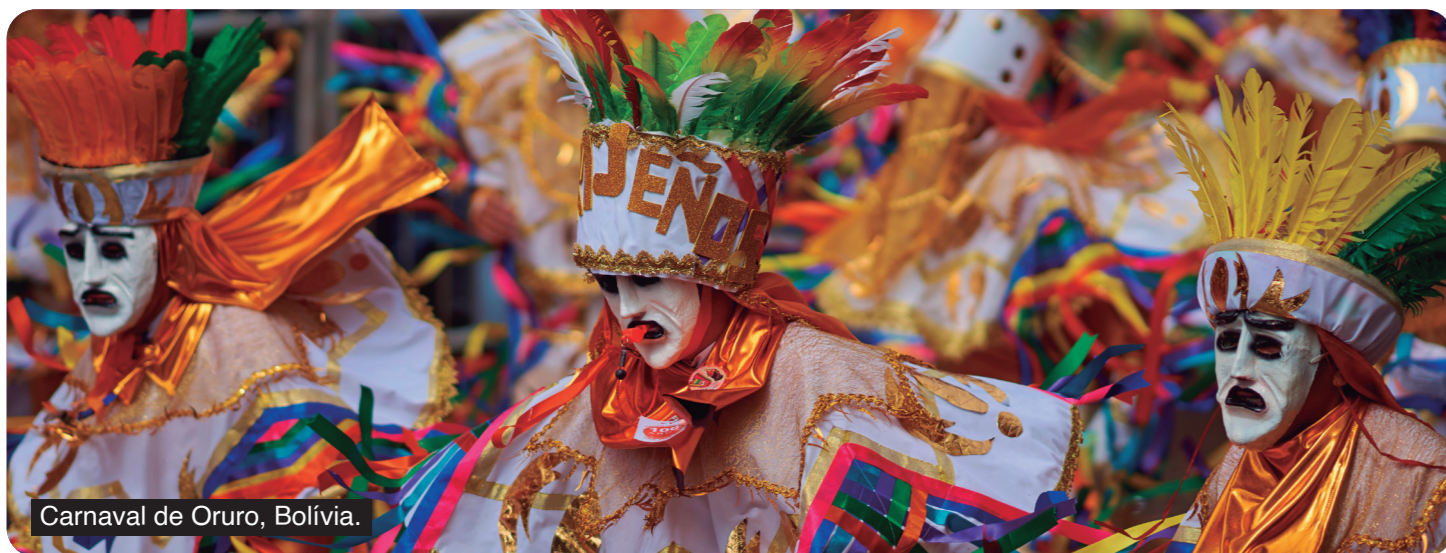
Carnaval de Oruro, Bolívia.

Setembro/2022 Nº1 (Circulação Quinzenal)