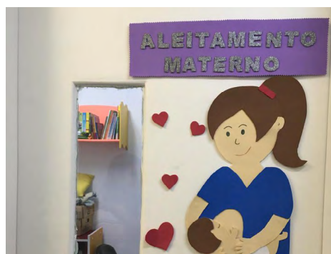
Porta da sala dos professores

*ora-pro-nóbis: planta alimentícia não convencional abundante na região.