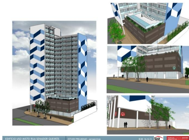
EDIFÍCIO USO MISTO RUA SENADOR QUEIROIS