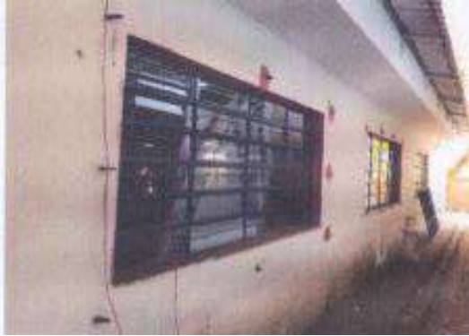
Retirada de esquadrias e portas