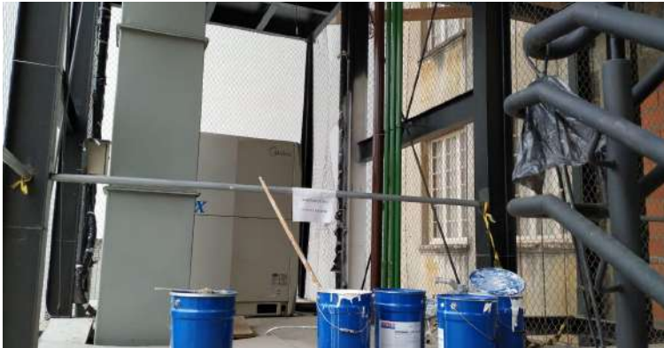
Aplicação de pintura intumescente