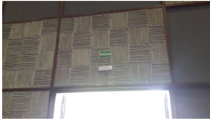
Sinalização de emergência