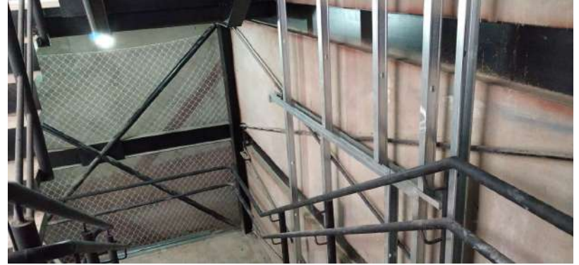
Fechamento da escada de emergência