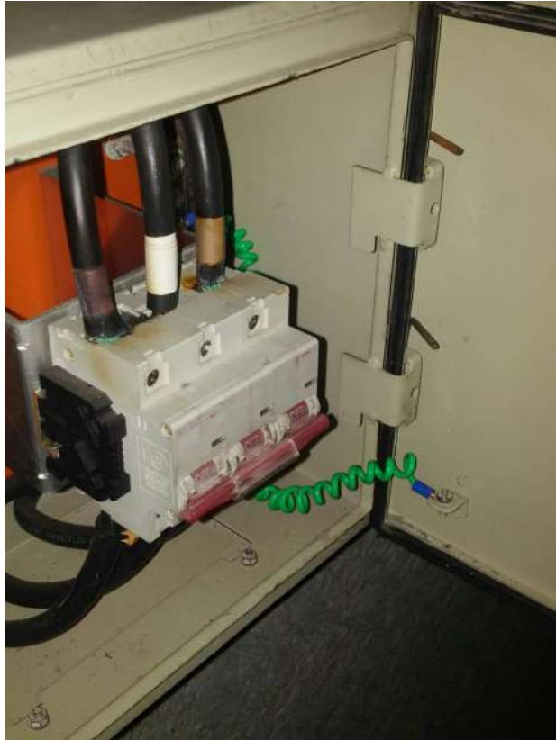
Serviços de elétrica

Serviços corretivos para obtenção de AVCB (em andamento)