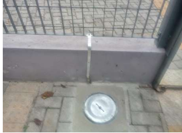
Sinalização de emergência