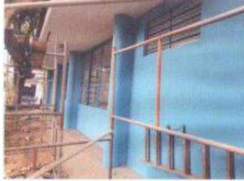
Pintura - diversos locais