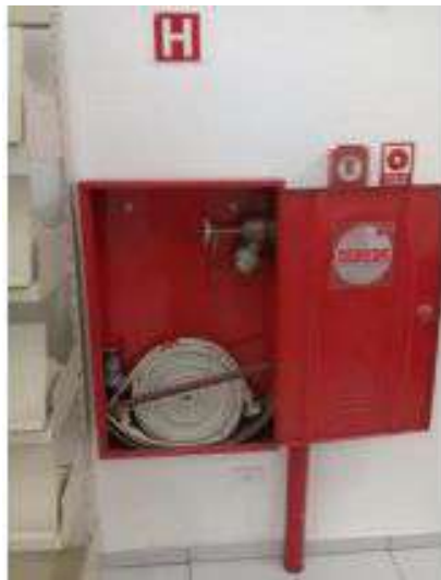
Instalação de esguicho com engate rápido no sagão da B. Anne Frank

Serviços corretivos para obtenção de AVCB (em andamento)