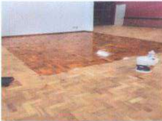
Raspagem e aplicação de resina (durante)