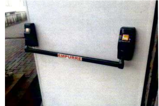
Instalação de barra antipânico