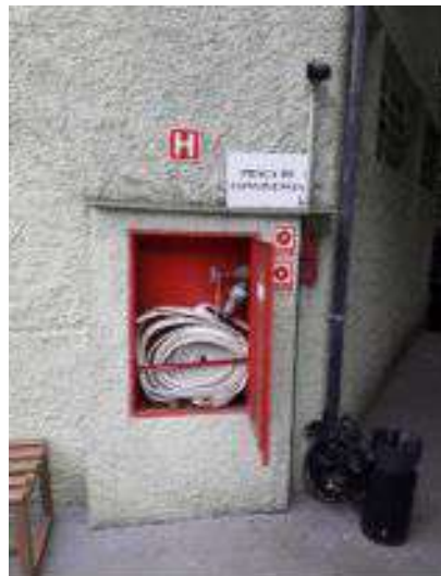
Instalação de esguicho com engate rápido na área externa do Teatro Décio de Almeida Prado