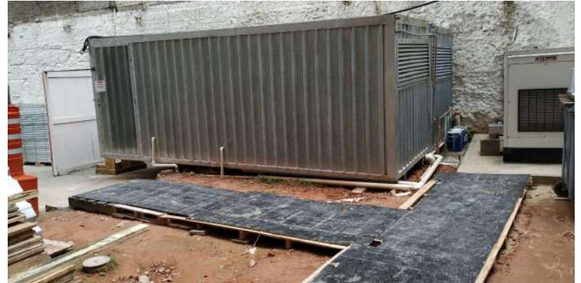
Parte do canteiro de obras (externo)