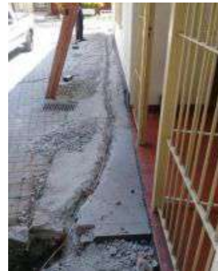
Instalação do SPDA na Biblioteca e no Teatro