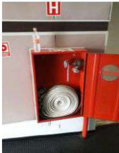
Instalação de esguicho com engate rápido na plateia do Teatro Décio de Almeida Prado