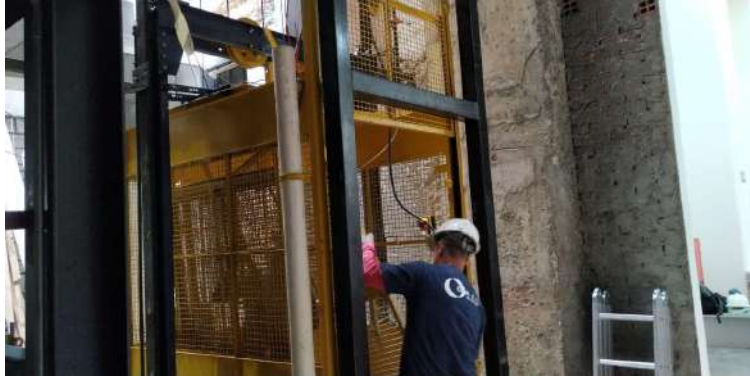
Instalação do elevador de serviço