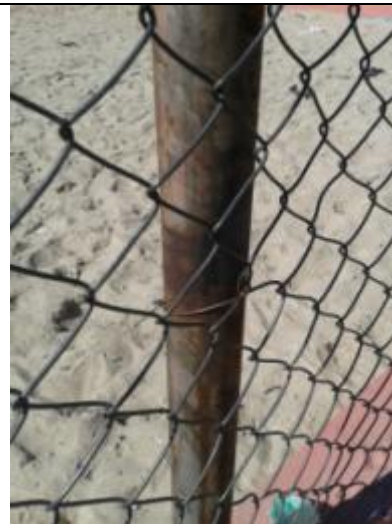
Fotos 1 e 2 – Estrutura Metálica do Alambrado apresenta ferrugem e falta de pintura.

b) Portão em Ferro Perfilado com Tela – Pela aparência do portão foi executado recentemente, tendo em vista a condição do material e sua pintura; contudo, de acordo com a medição de 2,42 m 2 , deveria ser confeccionado em estrutura de ferro perfilado e fechamento em tela ondulada de arame galvanizado malha 1, fio 10. Verificou-se em vistoria que o portão existente foi construído em tubo de aço galvanizado e o seu fechamento em tela alambrado, notadamente itens inferiores e mais baratos que os medidos.