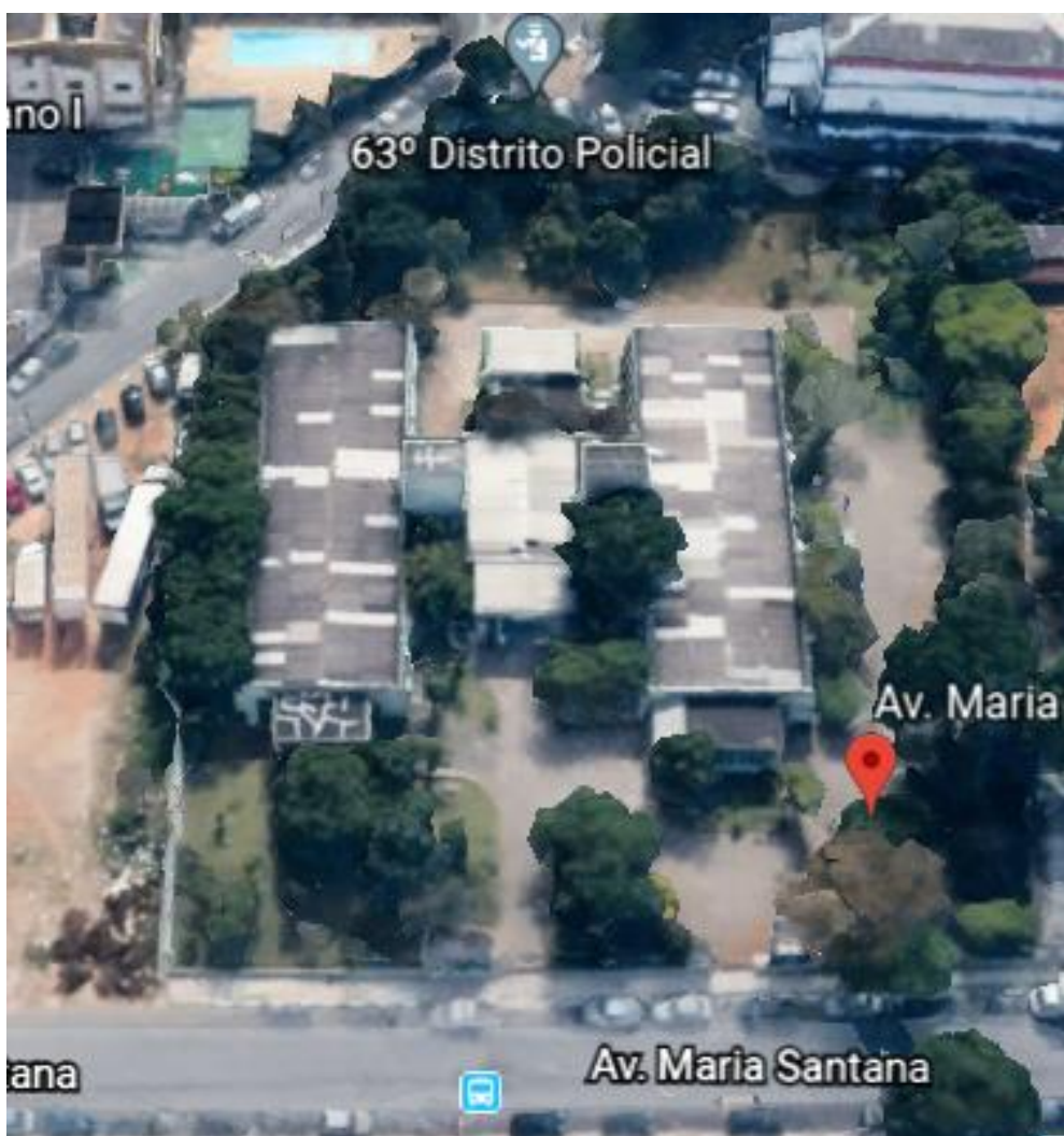
MAPA DA LOCALIZAÇÃO DA UNIDADE

ENDEREÇO: RUA MARIA SANTANA, 101, VILA JACUÍ