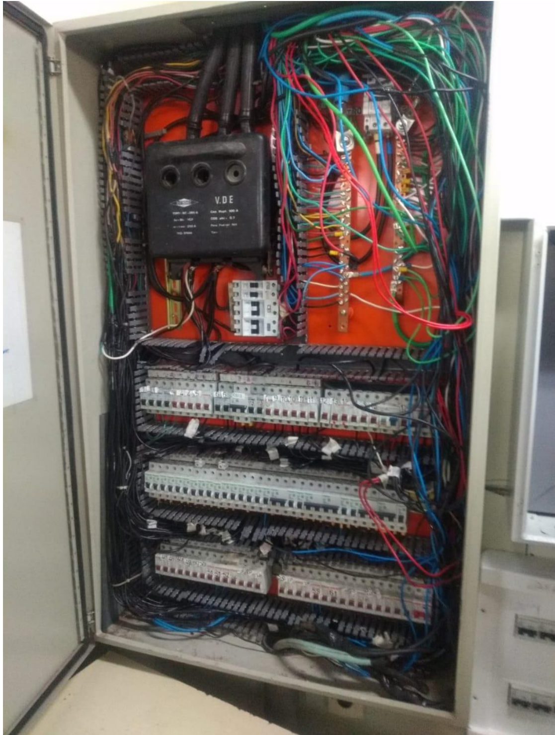
Detalhe quadro elétrico