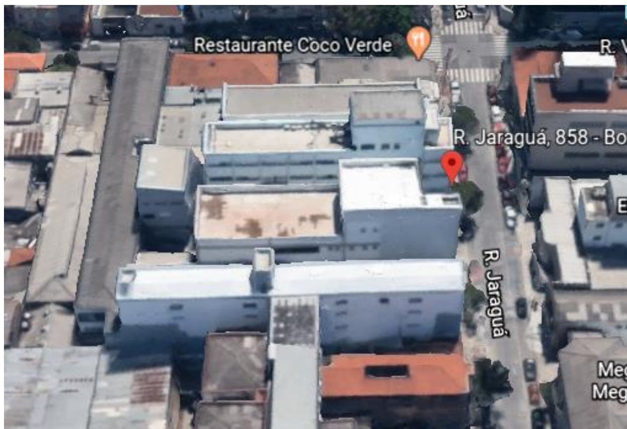
MAPA DA LOCALIZAÇÃO DA UNIDADE