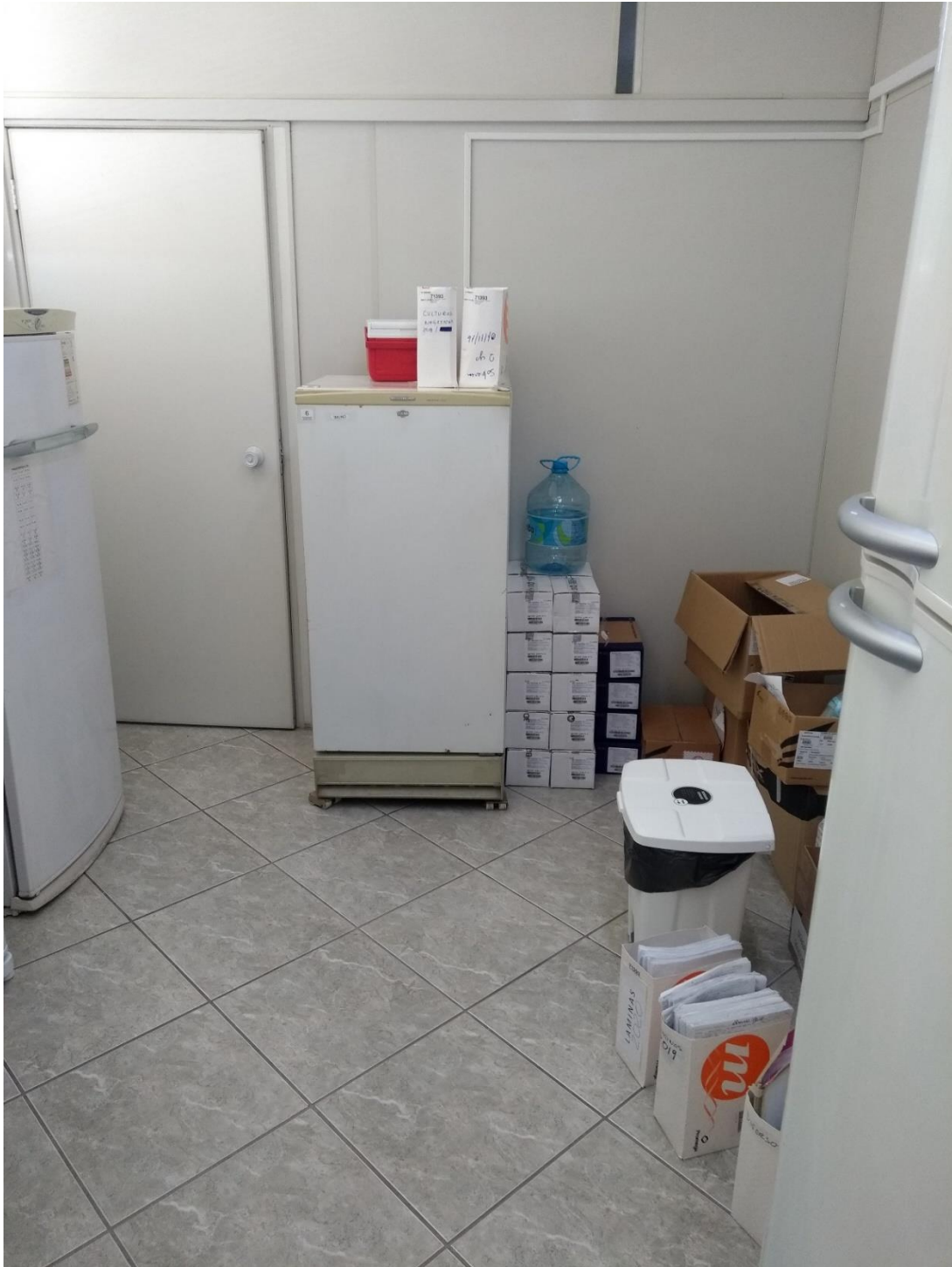
Sala de geladeiras