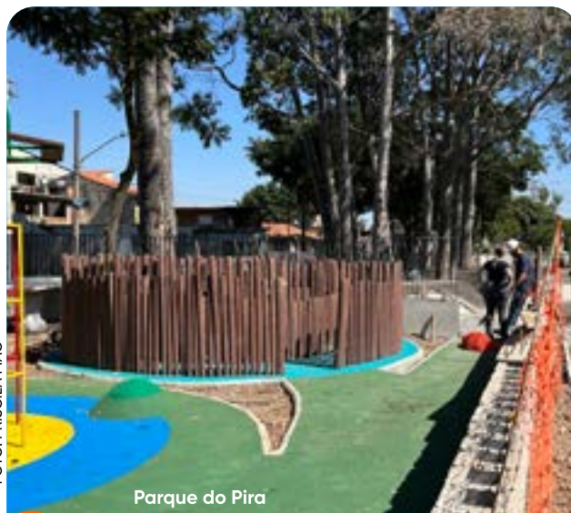
Parque do Pira