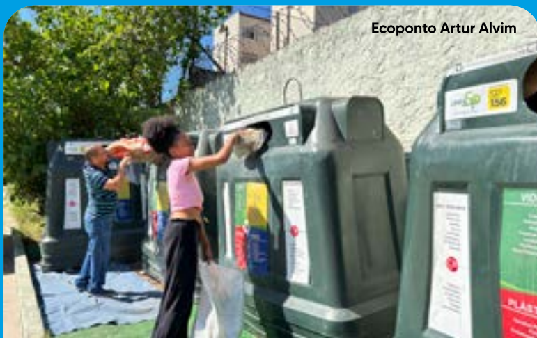
Ecoponto Artur Alvim