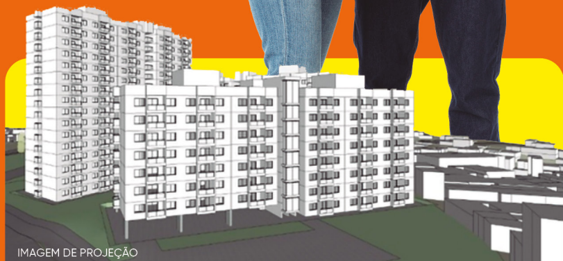
IMAGEM DE PROJEÇÃO

Serão construídas 770 moradias no Luiz Rotta, na Cidade Dutra. As unidades terão uma área média de 49 m 2 com 2 dormitórios, sendo alguns destinados a pessoas com deficiência. Os espaços contarão com quadras esportivas e equipamentos de ginástica.