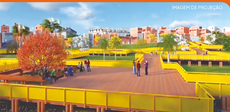
IMAGEM DE PROJEÇÃO

O Parque Cocaia, no Jardim Noronha, próximo à CEI Jardim Tanay, irá beneficiar mais de 4 mil famílias no Grajaú com quadras esportivas, parquinhos e equipamentos de ginástica. O projeto também inclui a canalização de córregos, tratamento de esgoto e uma ciclovia em toda a sua extensão.