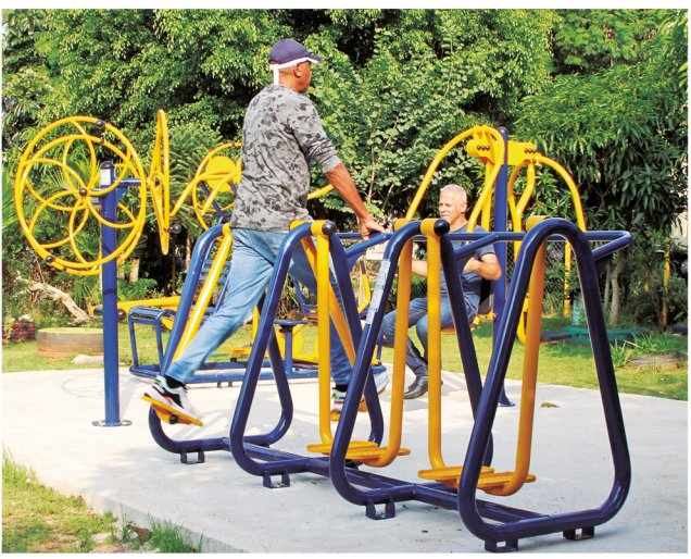
ÁREA NA RUA DOMITILA D'ABRIL