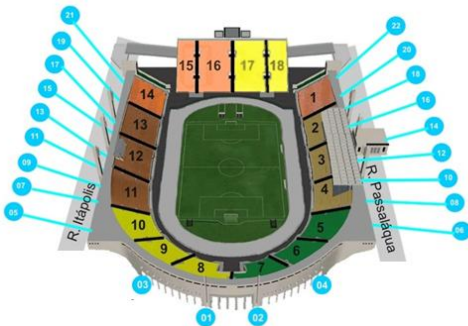
Figura 2 – Setores do Estádio