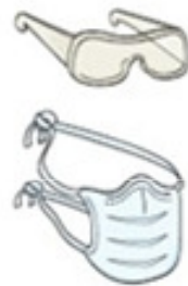
Óculos e Máscara