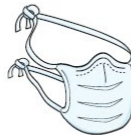
Máscara Cirúrgica (paciente durante o transporte)