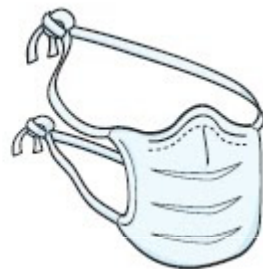
Máscara Cirúrgica (profissional)