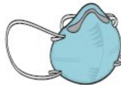
Máscara PFF2 (N-95) (profissional)