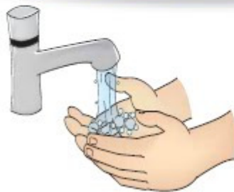
Higienização das mãos