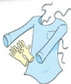
Luvas e Avental