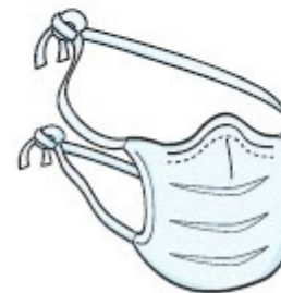
Máscara Cirúrgica (paciente durante o transporte)