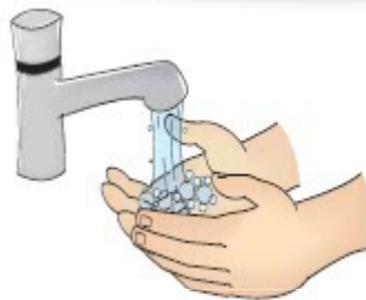
Higienização das mãos