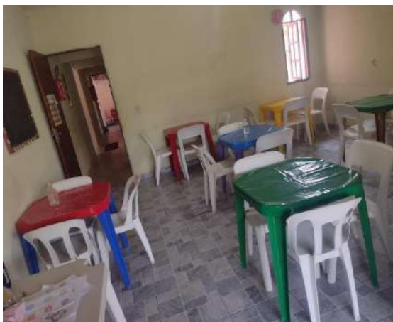
Sala de Atividades