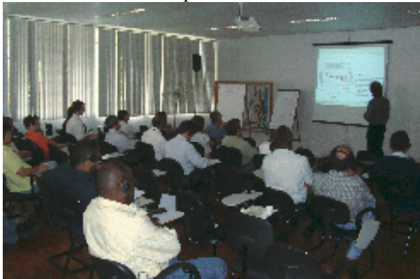
Dia 11/11: UMAPAZ