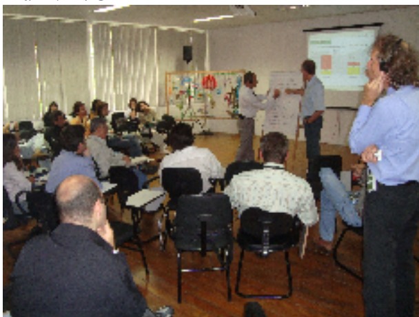
Dia 12/11: UMAPAZ