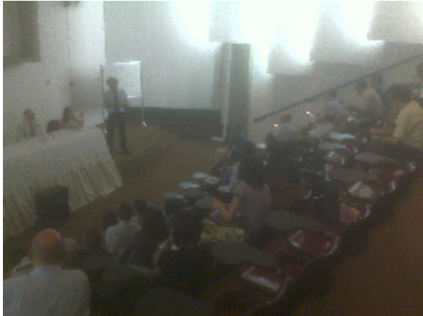
Dia 10/11: Local: Hospital Ermelindo Matarrazo

Participantes: Variando entre 35 e 40 servidores de: SIURB, EDIF, SPTRANS, COHAB, SEHAB, SMS, Hospital de Emelindo Matarrazo, Autarquia Hospital Municipal Leste, SVMA, DEPAVE e CDHU, PROCEL, Hospital das Clínicas e ICLEI