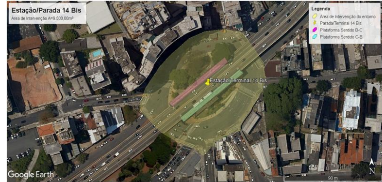
Área de intervenção da obra.