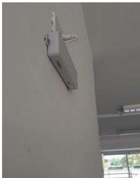
Iluminação de emergência