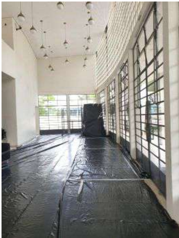
Reforma do forro do saguão de entrada