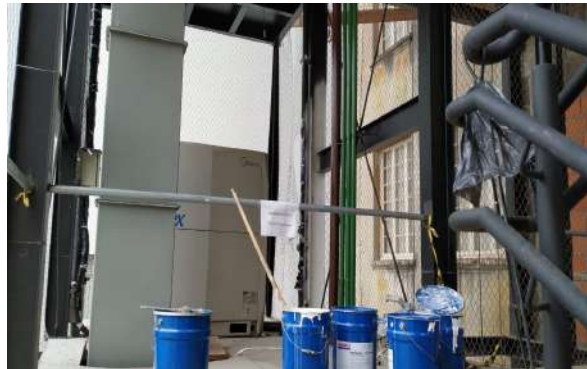
Aplicação de pintura intumescente