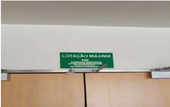
Sinalização de emergência