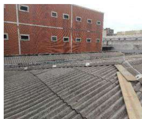
Sistema de Proteção contra Descargas Atmosféricas (SPDA)