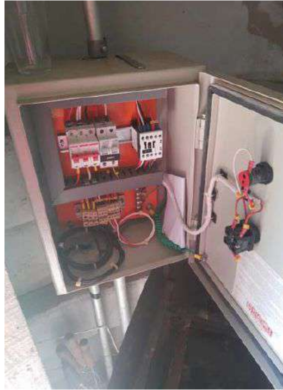
Serviços de elétrica