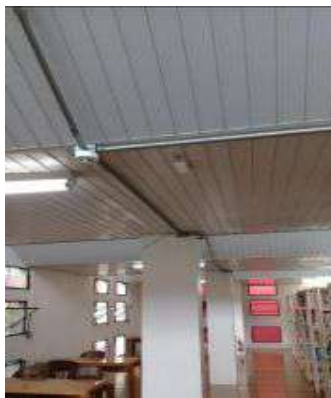
Detectores de incêndio