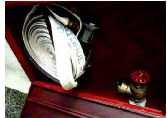
Instalação de mangueira, esguicho e chave de engate