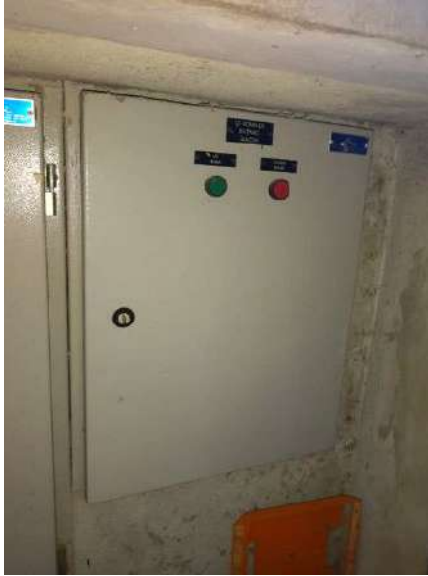
Serviços de elétrica

Serviços corretivos para obtenção de AVCB (em andamento)