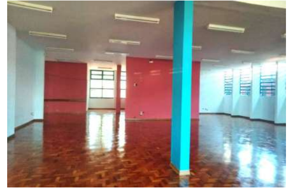
Pintura interna, piso reformado e elétrica