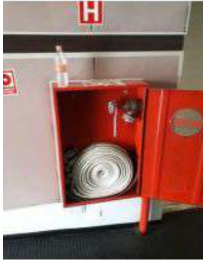
Instalação de esguicho com engate rápido na plateia do Teatro Décio de Almeida Prado

Serviços corretivos para obtenção de AVCB (em andamento)