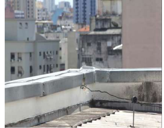
Instalação de SPDA