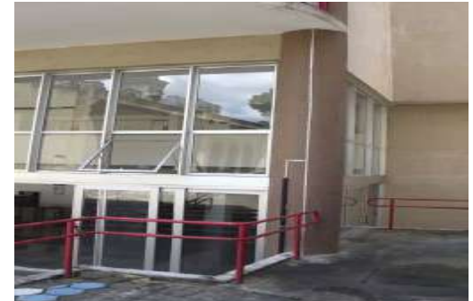
Instalação de SPDA