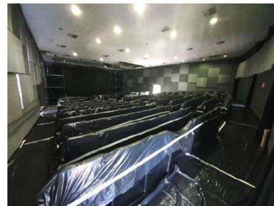
Reforma do forro da plateia