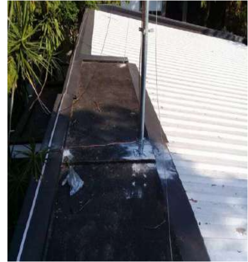
Instalação do SPDA na Biblioteca e no Teatro