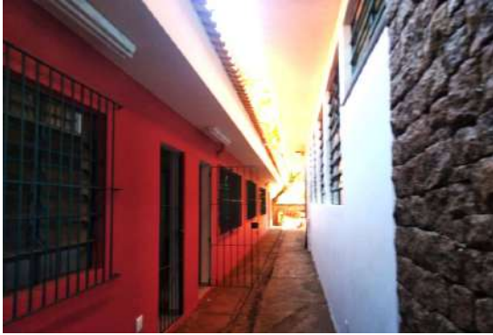
Troca de esquadrias e portas e pintura