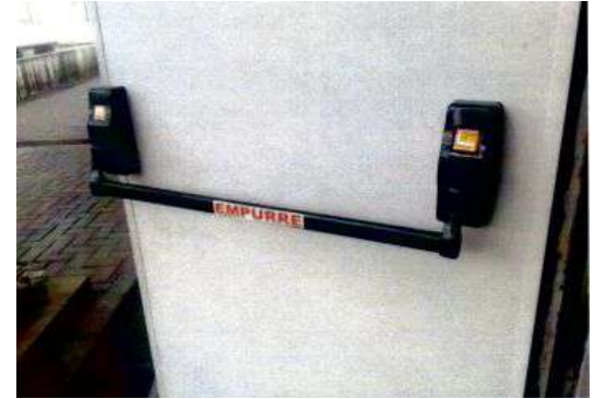
Instalação de barra antipânico