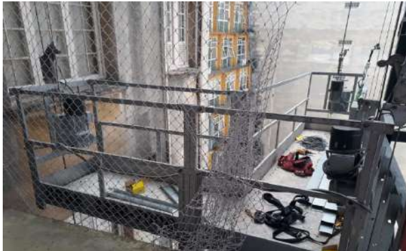
Instalação de balancins