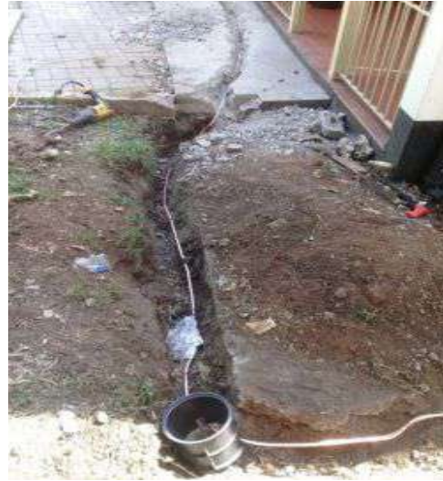
Instalação do SPDA na Biblioteca e no Teatro