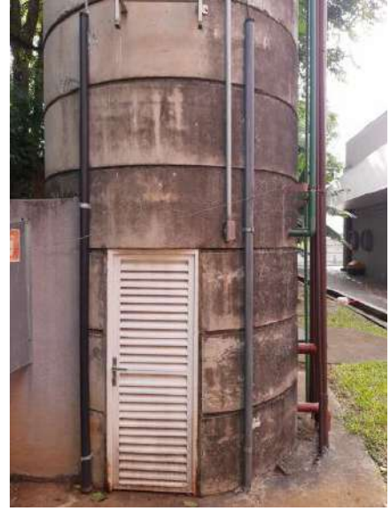
Instalação elétrica no reservatório e SPDA