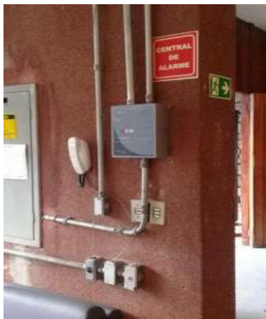
Central de alarme

Serviços corretivos para obtenção de AVCB (em andamento)