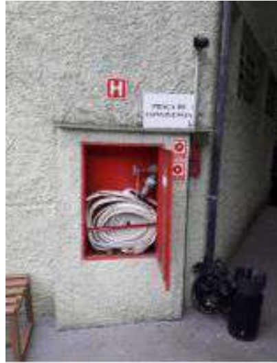
Instalação de esguicho com engate rápido