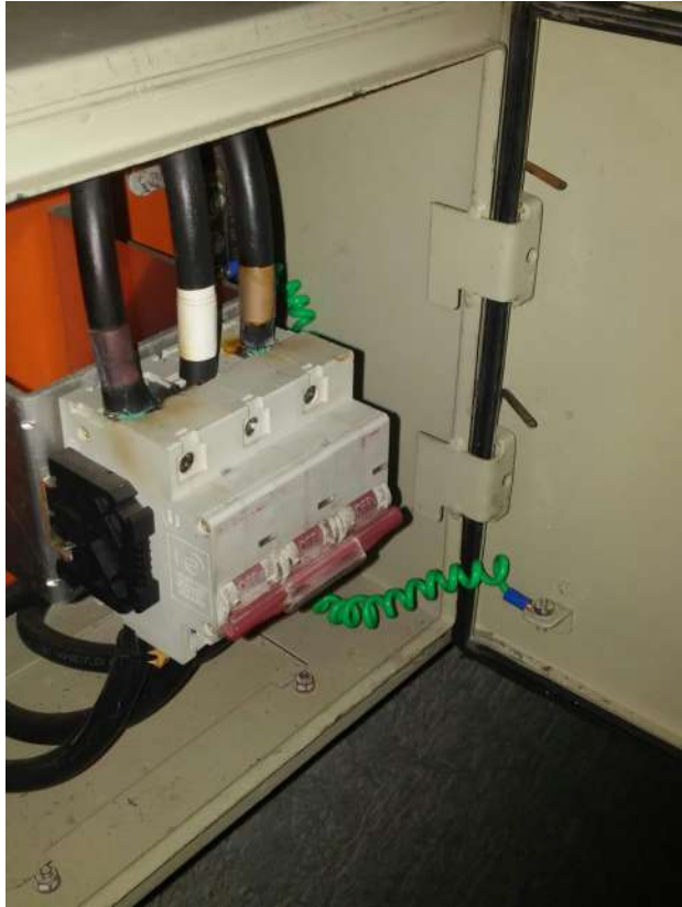
Serviços de elétrica

Serviços corretivos para obtenção de AVCB (em andamento)