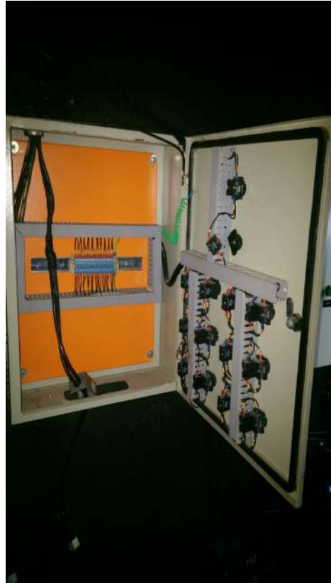
Serviços de elétrica