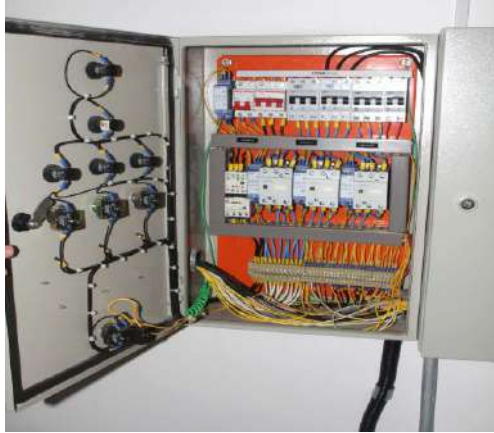
Serviços de elétrica

Serviços corretivos para obtenção de AVCB (finalizada)