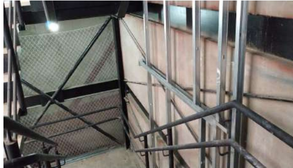
Fechamento da escada de emergência