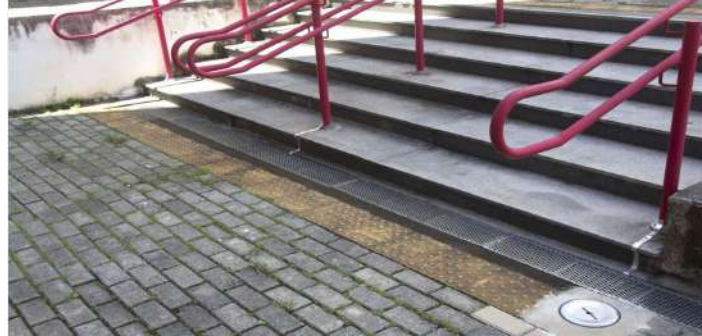
Instalação de SPDA