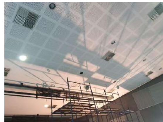
Reforma do forro da plateia