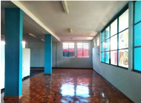
Raspagem e aplicação de resina