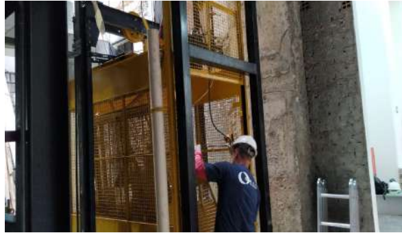
Instalação do elevador de serviço