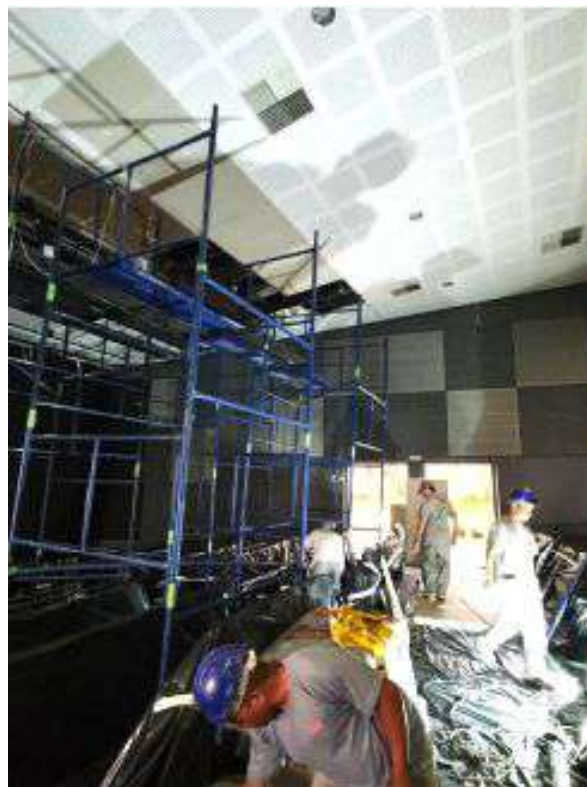
Reforma do forro da plateia