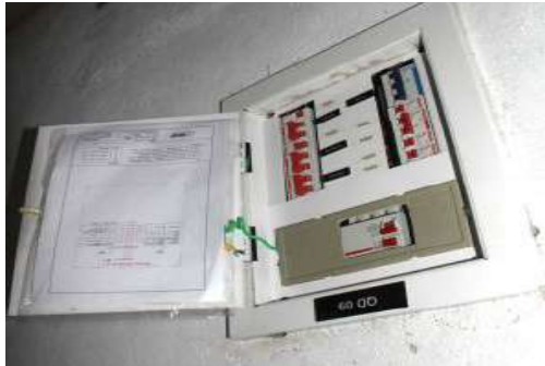
Serviços de elétrica