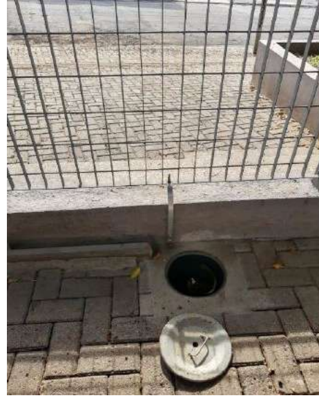
Sistema de Proteção contra Descargas Atmosféricas (SPDA) e equipotencialização - Aterramento do gradil