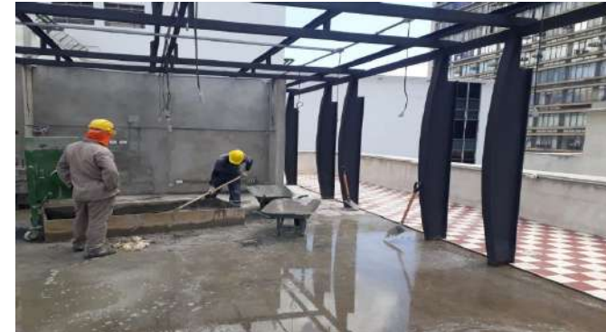
Restauração e recomposição da fachada posterior esquerda.