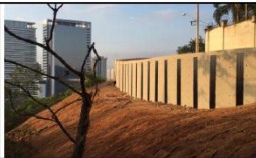
FOTO 321 – OBRA FINALIZADA