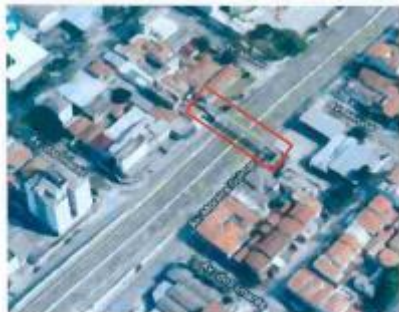
Foto 1 – Vista superior da implantação indicando a localização da passarela, foto obtida pela internet.