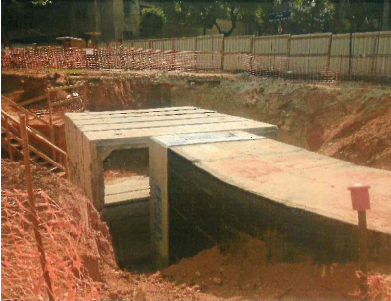
EXAUSTÃO E VENTILAÇÃO