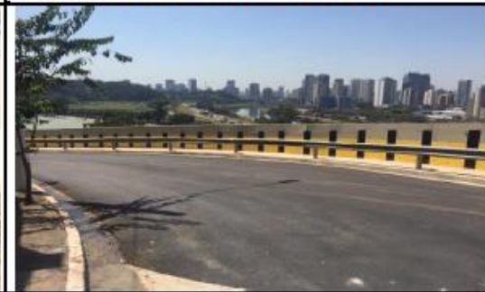
FOTO 325 – OBRA FINALIZADA