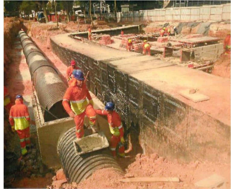
TUBOS DE PEAD, POÇO DE VISITA , E GALERIA TÉCNICA