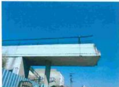
Foto 3 – Vista atual da passarela, Dr. José Granadeiro Guimarães, lado. Planalto paulista