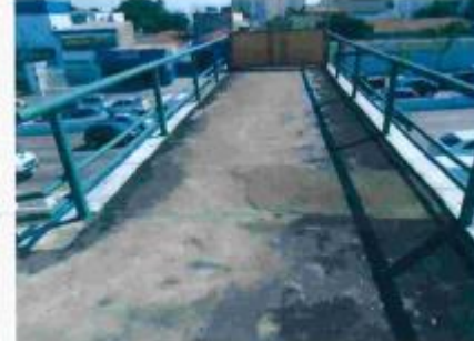
Foto 8 – Vista do piso do trecho existente da passarela lado Moema