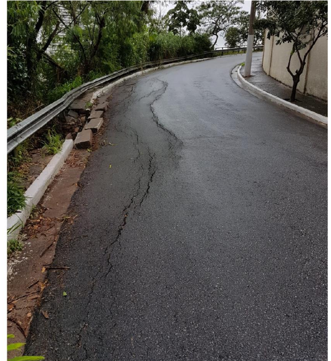
Foto 4.2.1 – Vista de proximidade do afundamento da guia, sarjeta e pavimento