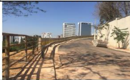
FOTO 324 – OBRA FINALIZADA