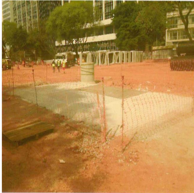
TESTE DE PISO