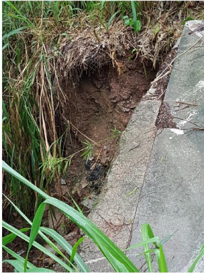
Figura 3.1 – Vista local do solo superficial constituído de ater