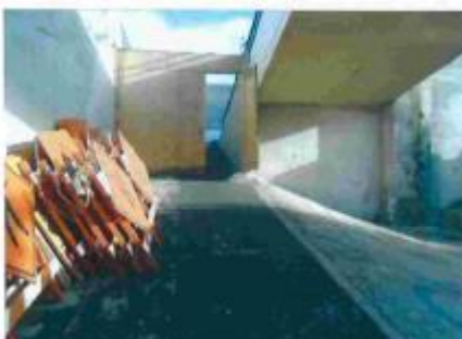
Foto 5 – Vista da rampa de acesso a passarela lado Planalto paulista