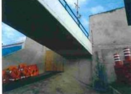
Foto 7 – Vista da face inferior da laje e lateral esquerda no trecho 02 da passarela, lado Planalto paulista.