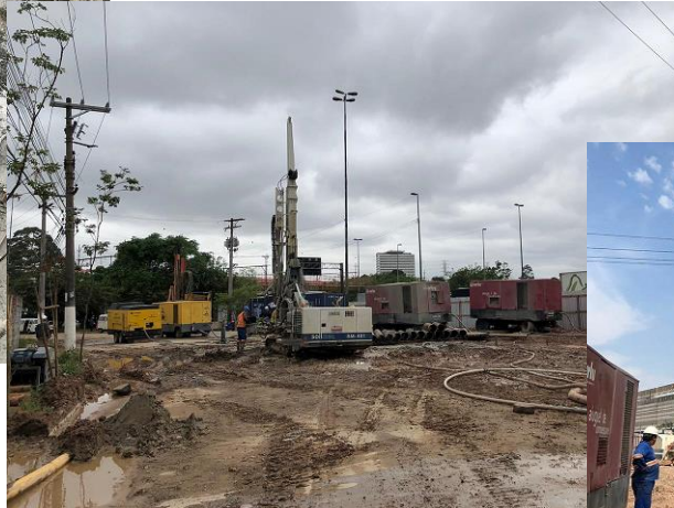
Estaca Raiz ap2