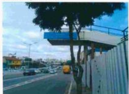
Foto 4 – Vista atual da passarela, Dr. José Granadeiro Guimarães, lado Moema,