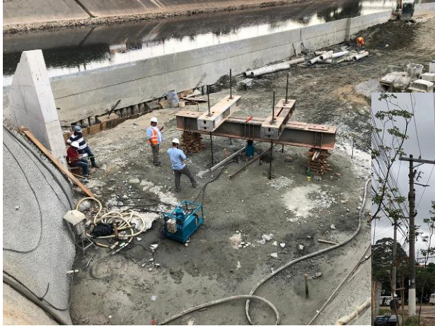
Prova de carga estática – Estaca Raiz ap3