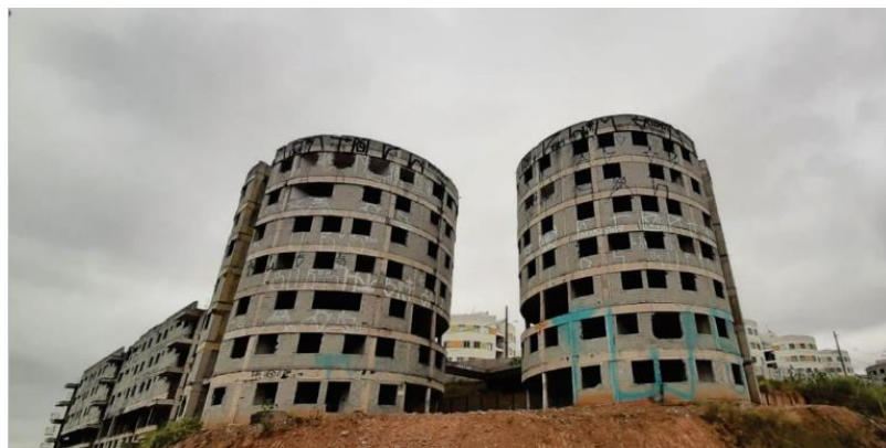
Blocos 1 e 10 – Cond. 3