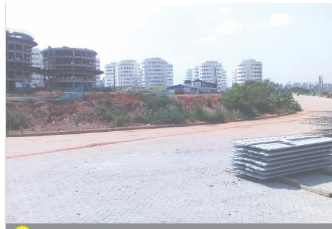
Condomínio 5 - Terreno