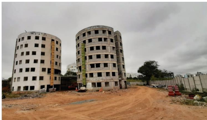
Blocos 1, 2 e 3 – Cond. 4