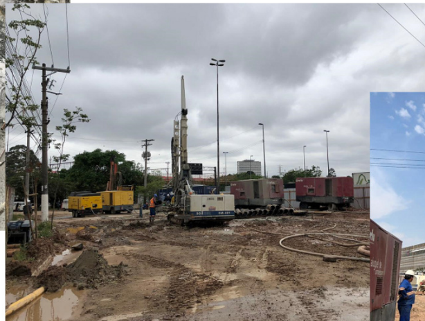
Estaca Raiz ap2