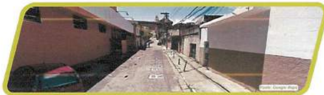
Figura 37 - Rua Felisberto Barbosa Dias