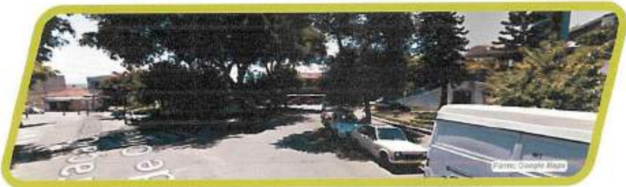
Figura 23 - Praça Comandante Eduardo de Oliveira