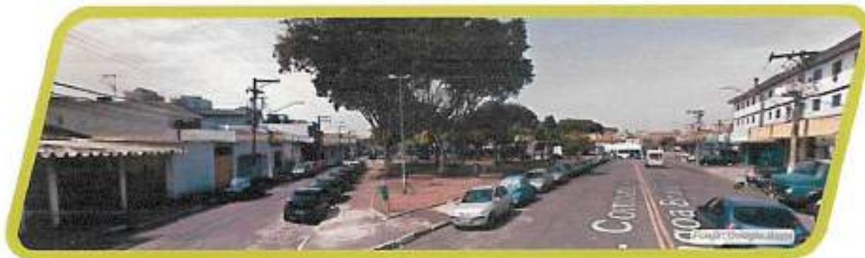
Figura 22 - Praça Carlos Koseritz