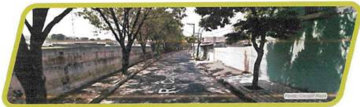
Figura 24 - Rua Capitão Busse