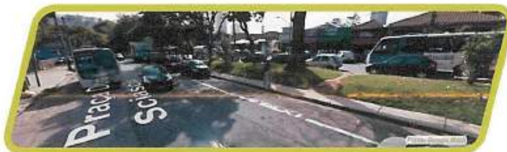
Figura 38 - Praça Dona Mariquinha Sciascia