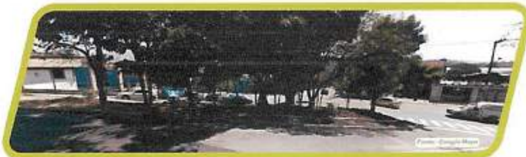
Figura 36 - Praça José Nelsom Anastasi