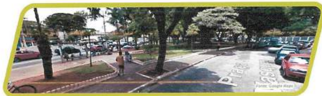
Figura 25 - Praça Doutor João Batista Vasquez