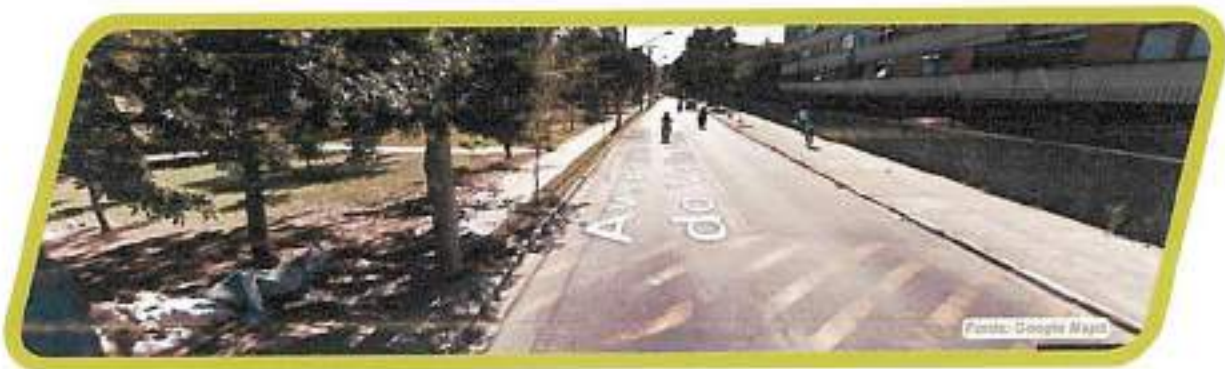
Figura 30 - Av. Paulo Lincoln do Valle Pontin