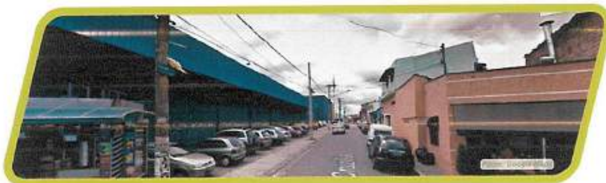
Figura 27 - Rua Cruzília