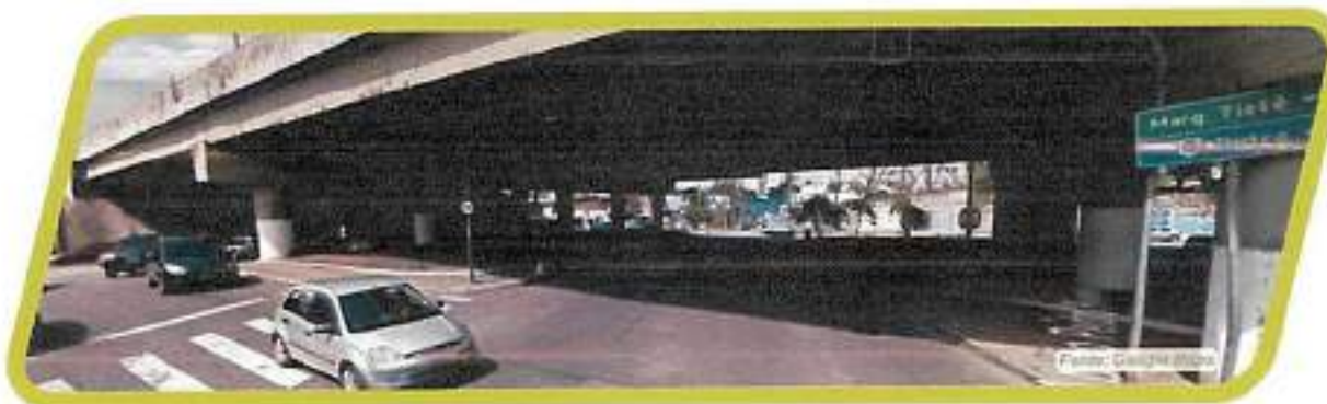
Figura 28 - Rua Abílio Pedro Ramos