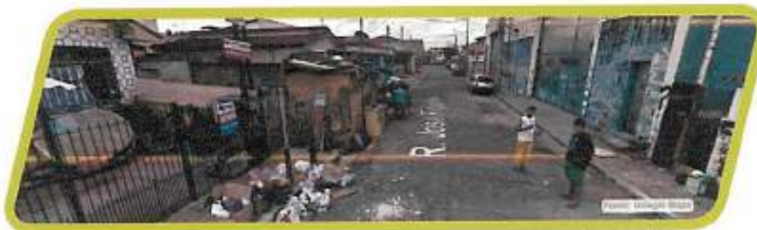
Figura 35 - Rua José Figliolini