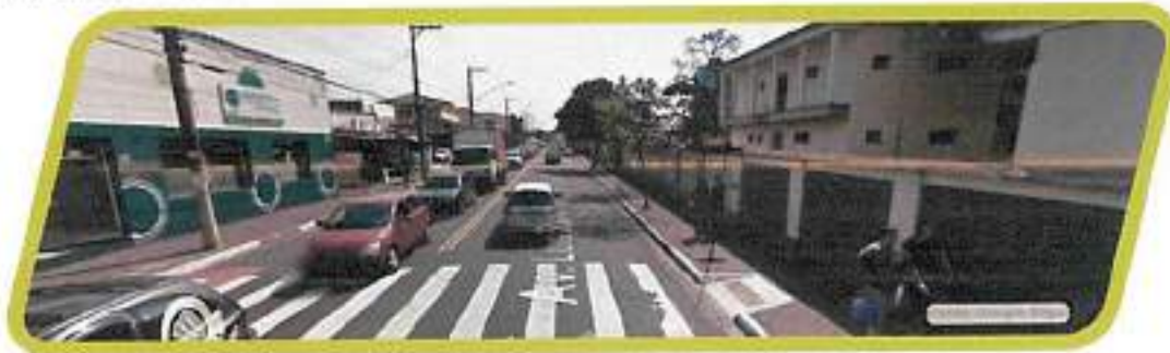
Figura 33 - Av. Luís Stamatis