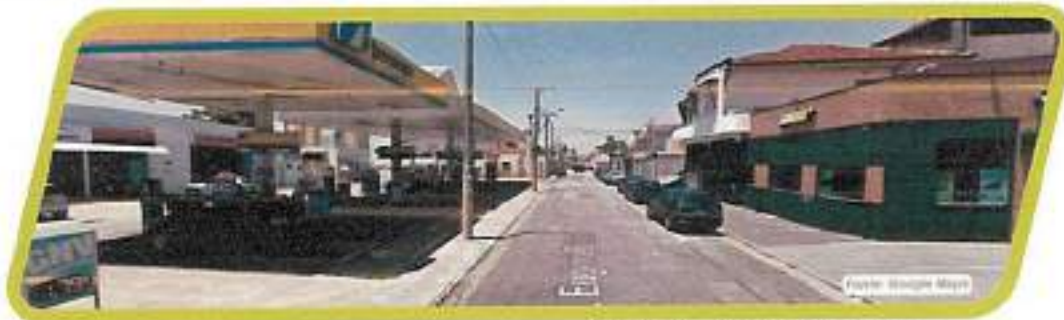
Figura 34 - Rua Eugênia Bresser