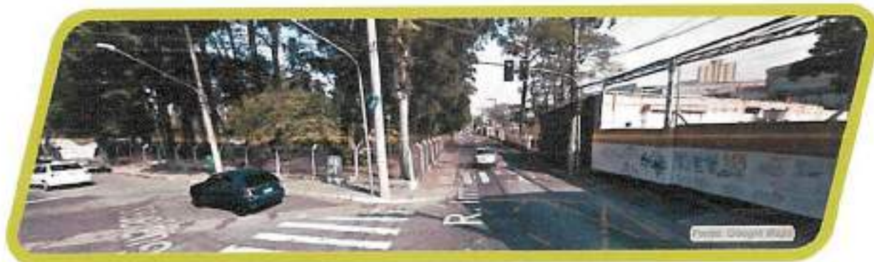
Figura 31 - Rua Irmã Emerenciana