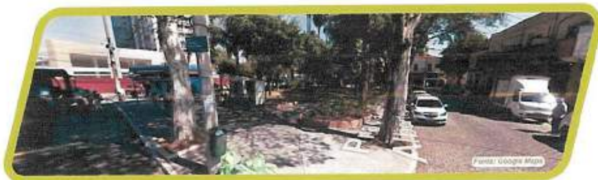
Figura 26 - Praça Comendador Alberto de Sousa