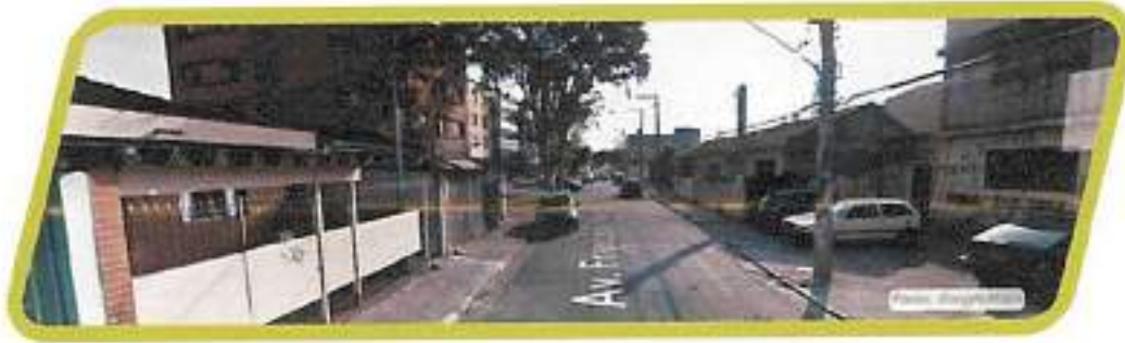
Figura 32 - Av. Francisco Rodrigues