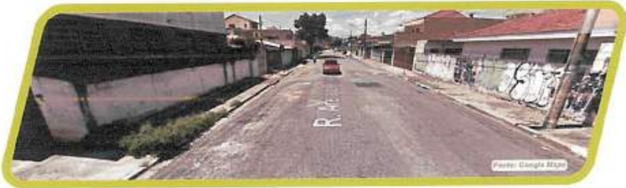
Figura 29 - Rua Areia do Rosário