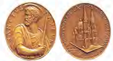
Prêmio Arquidiocese Medalha São Paulo Apóstolo Mérito em Serviço Social