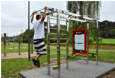
Estação de ginástica

Realizar estudo de viabilidade de ciclovía na área não gradeada do parque sem que haja nenhuma retirada de árvores ou qualquer impacto na permeabilidade geral do solo.