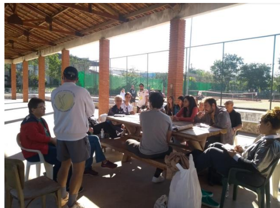
Registro das Oficinas