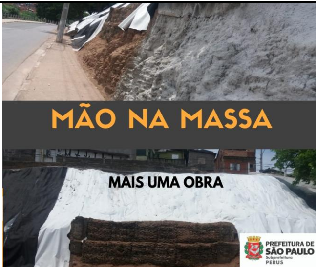
Colocação de manta geotêxtil e assentamento de canaleta - Rua Ernesto Bottoni