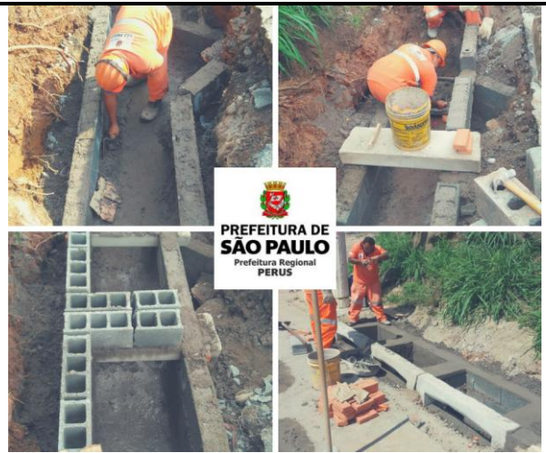
Reconstrução de Bocas de Lobo Tripla - Rua Ernesto Bottoni