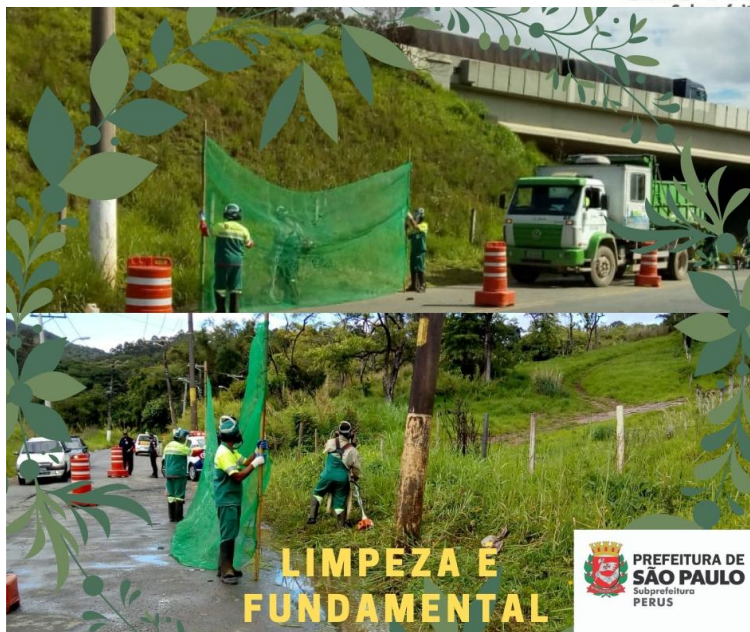
Limpeza - Prç. Inácio Dias e Tv. Cambaratiba