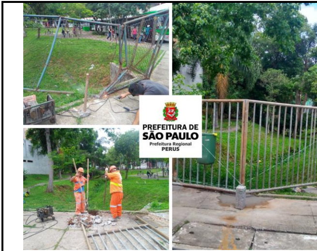
Substituição de gradil - Sol Nascente