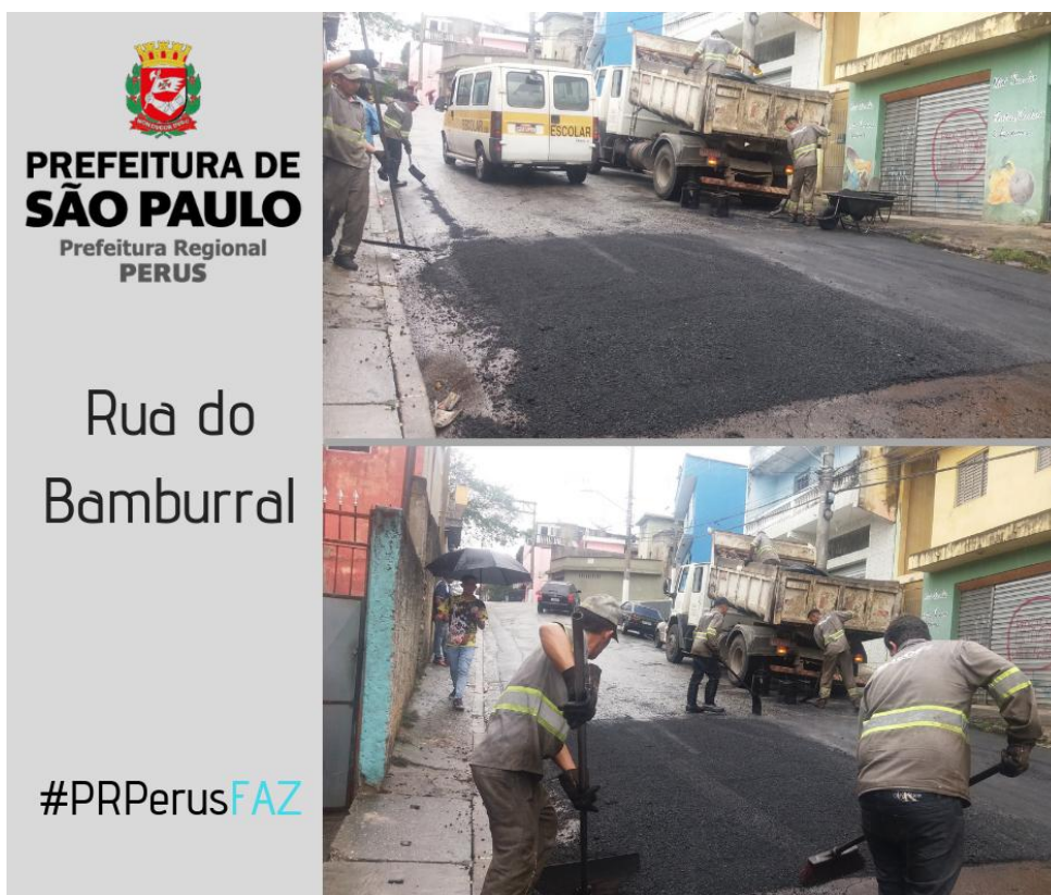
Tapa Buraco na Rua do Bamburral - Jd do Russo