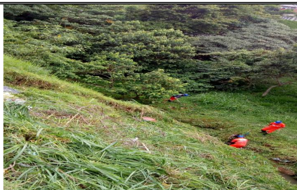
Limpeza de córregos – Serra da Capelinha