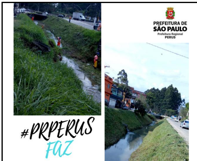
Limpeza manual de córregos - R. Ernesto Bottoni