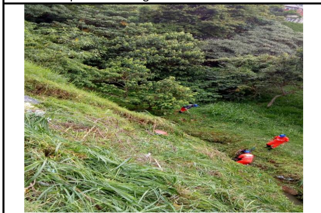
Limpeza manual de córregos – Rua Serra da Capelinha