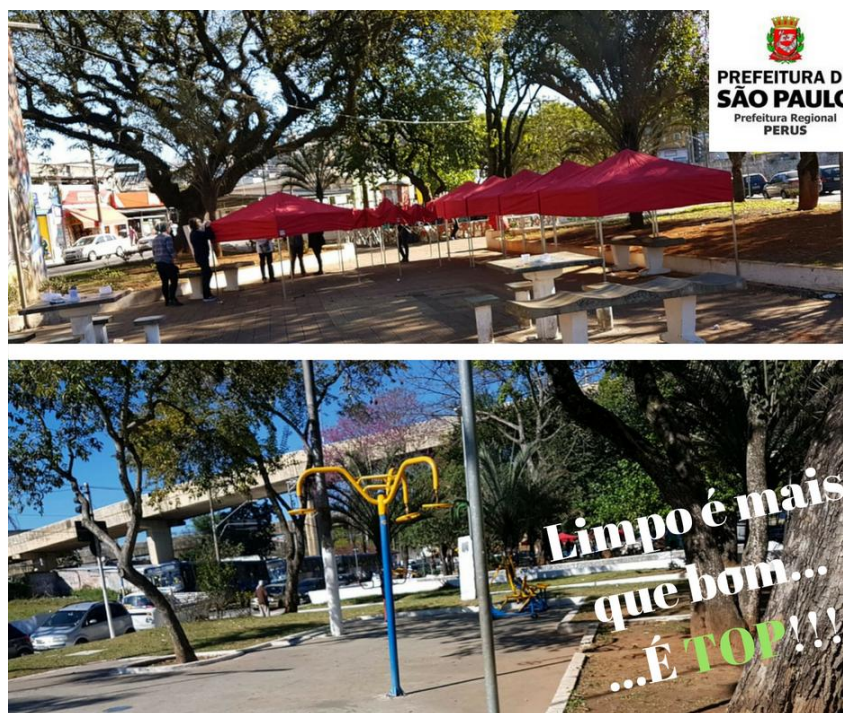
Limpeza - Rua Índia - Vila Fanton