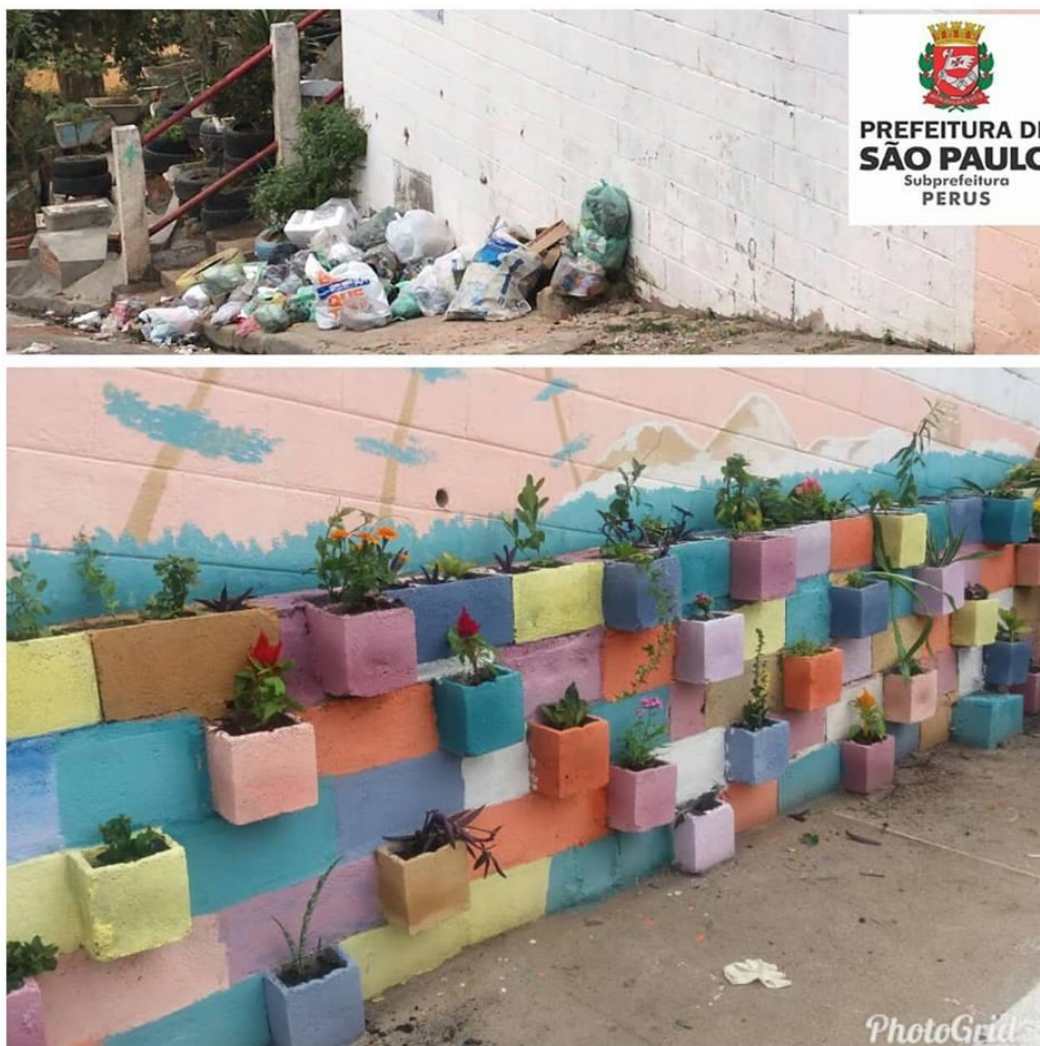
Rua José Pacheco

Também foram realizados, cerca de 3,6 km de serviços como varrição, raspagem, capinação e pintura na Av. Fiorelli Peccicacco. Ao todo, foram removidos aproximadamente quatro toneladas de lixo do ponto revitalizado e da Av. Fiorelli Peccicacco.