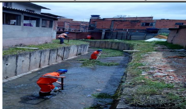
Rua Salmista - DEPOIS