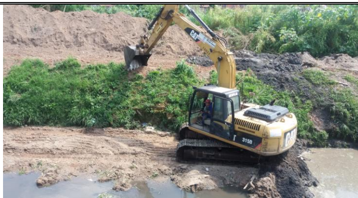
Limpeza de córrego - R. Ernesto Bottoni

Com atividades contínuas de limpeza e desassoreamento dos córregos (bacia hidrográfica que pertence o Ribeirão Perus), não houve, no decorrer deste ano, nos distritos Perus/Anhanguera intercorrências significativas de transbordamento dos córregos.