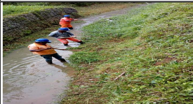
Limpeza de córrego - Rua coronel José gladiador