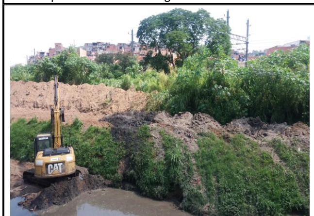
Limpeza de córrego - Rua Ernesto Bottoni