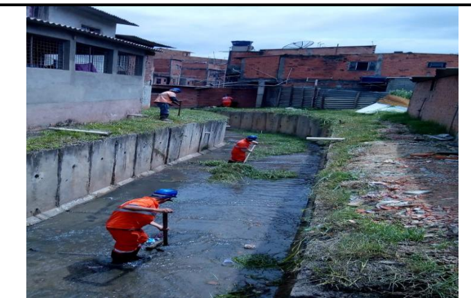
Limpeza manual de córregos – Rua salmista