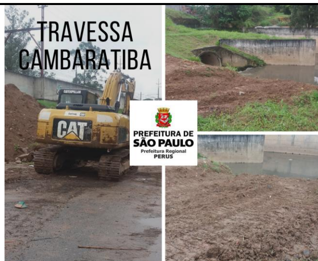
Limpeza de córregos – Travessa cambaratiba