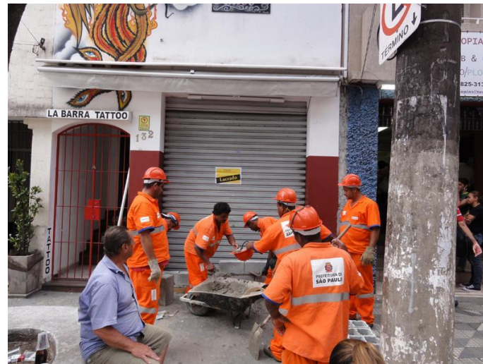
Legenda: Exemplo de fiscalização

Compete às Subprefeituras fiscalizar o cumprimento das normas municipais relacionadas com o código de edificações, zoneamento, abastecimento e posturas municipais. O trabalho consiste em orientar, fiscalizar e prestar informações ao público, sobre irregularidades em obras públicas e particulares. Em 2022, as principais ações fiscalizatórias desenvolvidas foram: A principal ação fiscalizatória desenvolvida foi realizada na Praça Marielle Franco, Jardim Paulistano. O local era ponto de baile funk. Houve um grande planejamento e articulação prévia entre Prefeitura, GCM, Polícia Militar e a comunidade local.