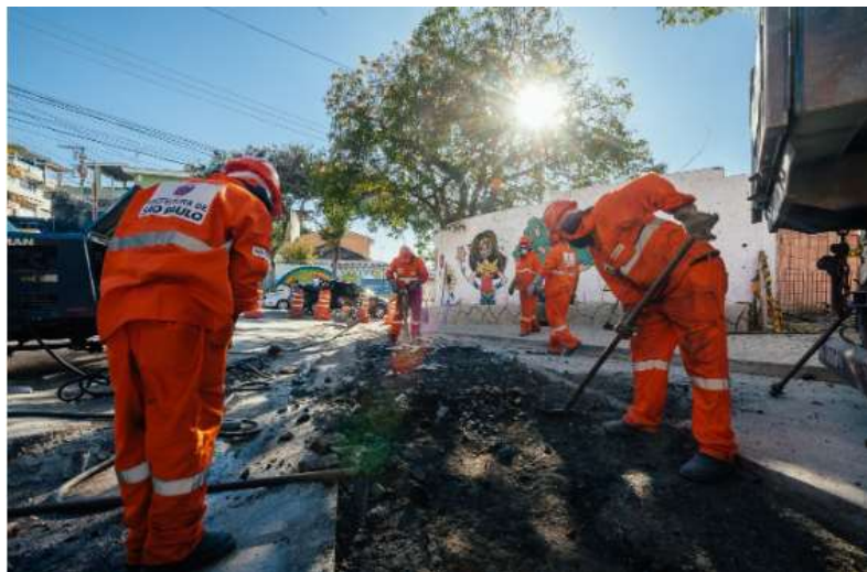
Legenda: Exemplo de Serviço de Tapa Buraco.

O serviço é iniciado com o recorte da área no entorno do buraco, depois é realizada a fresagem do pavimento, ou seja a remoção do asfalto desgastado, em seguida o recorte é preenchido com asfalto novo, de forma nivelada ao pavimento existente.