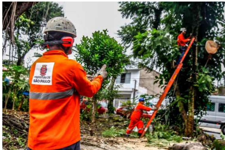
Legenda: Exemplo de Serviço de Manejo de árvores .

Os serviços que podem ser executados após a avaliação são os seguintes: Poda; remoção; ampliação de canteiro; transplante; remoção de vegetação parasita, entre outros. Pode acontecer por necessidades técnicas e de segurança.