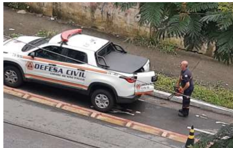
Legenda: Exemplo de ação de defesa civil

A atuação da Defesa civil tem o objetivo de reduzir os riscos de desastres. Também compreendendo ações de prevenção, mitigação, preparação, resposta e recuperação. Sempre que o cidadão sentir-se inseguro em relação a desastres naturais, enchentes, alagamentos, desmoronamentos, escorregamentos de terras, vazamentos de produtos químicos e combustíveis, ou exposto a situações de risco que exijam a atuação de profissionais, podem solicitar os serviços da defesa civil.