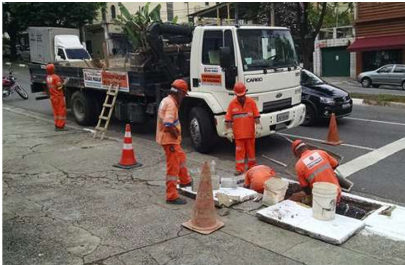
Legenda: Exemplo de Serviço de Drenagem

Atualmente a cidade possui aproximadamente 50 estruturas de contenção que podem ser classificados entre piscinões e polders, construídos em locais estratégicos da cidade, como nas pontes da Marginal Tietê e a locais próximos a rios e córregos, como no curso do rio Aricanduva e do córrego Pirajussara.