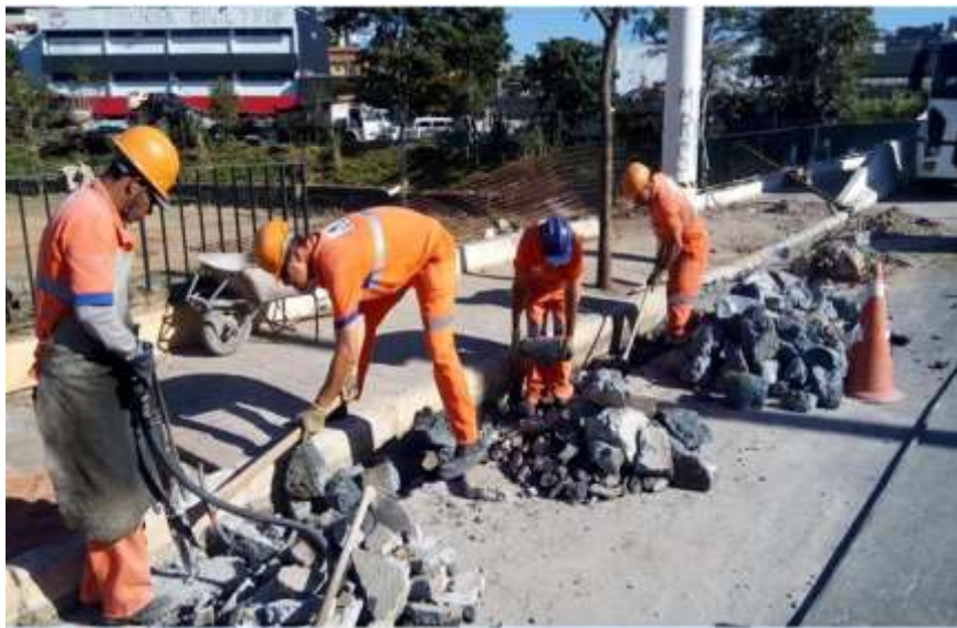
Legenda: Exemplo de Serviço de Manutenção de Logradouros