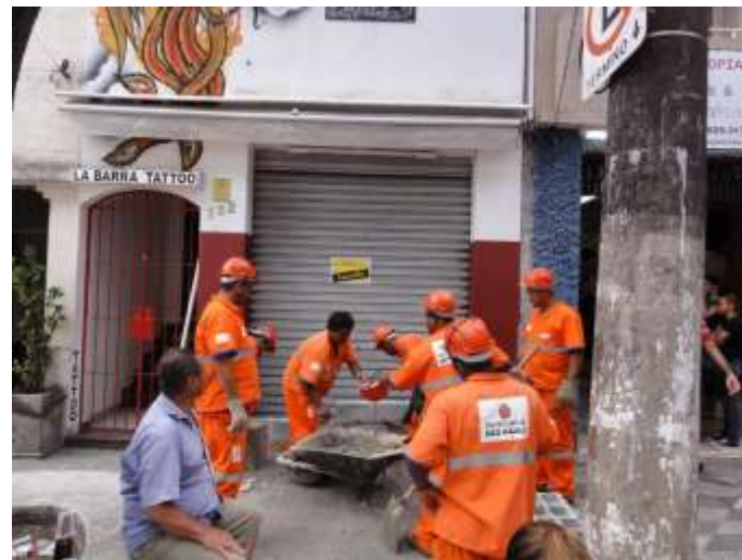
Legenda: Exemplo de fiscalização