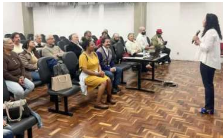
Legenda: Exemplo de Conselho em Funcionamento.

A região contou ainda com a articulação de outros conselhos e órgãos colegiados, como o CADES (O Interlocutor da Subprefeitura; CONSEG (Temos 1 representante da Subprefeitura que participa das reuniões); 2 Conselhos tutelares (SMDHC).