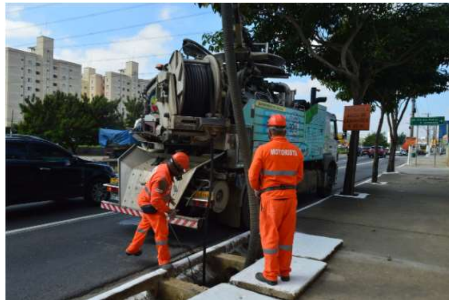
Legenda: Exemplo de Serviço de Microdrenagem.

O trabalho de limpeza da rede de microdrenagem é importante para a adequada coleta e condução de águas pluviais, evitando alagamentos e entupimentos em vias públicas, proporcionando assim, maior segurança a pedestres e motoristas nas ruas e avenidas.