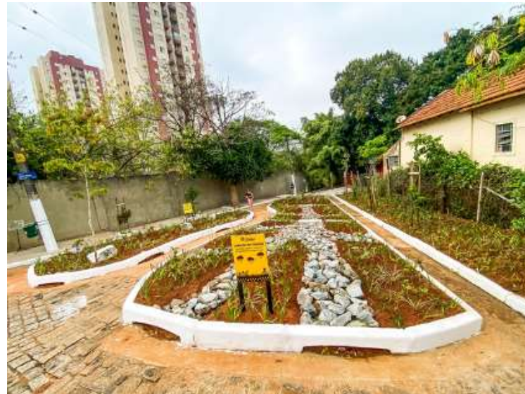
Legenda: Exemplo de Jardim de Chuva.

A iniciativa foi reconhecida com o Certificado de Mérito internacional pela AIPH World Green City Awards 2022.