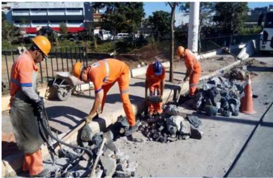
Legenda: Exemplo de Serviço de Manutenção de Logradouros