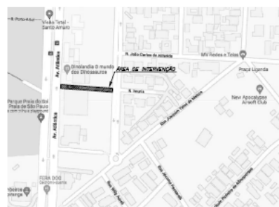
MAPA CHAVE 7/ ESC